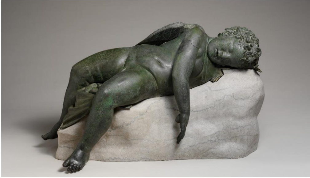
(Not: https://www.metmuseum.org/art/collection/search/254502 (02.08.2022)) Şekil 6. Bronz “Uyuyan Eros” Heykeli. MÖ. 250-150. Rodos üretimi.