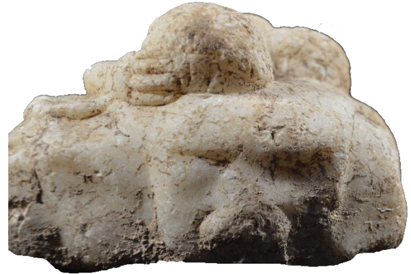
Şekil 4. Nysa “Uyuyan Eros” Kabartmalı Kapak. Eros saç ve kanat detayları ve aslan postunun baş ve pençe detayları.