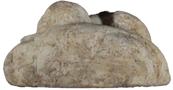
Şekil 2. Nysa "Uyuyan Eros" Kabartmalı Kapak. Kesit çizimi.