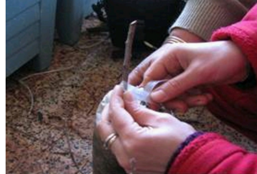
Şekil 5. Aşı bağlarının bağlanması.

23 Mart 2006 tarihinde diliksiz İngiliz aşı tekniği ile uygulanan aşılama ise, Isparta’da özel bir fidancılık işletmesinde yapılmıştır. Bu aşı tekniğinde öncelikle, anaçın tepesi yere paralel, sonra da bu kısım aşı bıçağı ile 3–4 cm’lik bir yüzey teşkil edecek şekilde bir yöne meyilli olarak ikinci defa kesilmiştir (Şekil 3.) Daha sonra, üzerinde 4– 5 göz bulunan aşı kaleminin alt ucu, alt gözün karşı tarafında aynı anaçtaki şekilde kesilerek, kalemin kesik kısmı, anaçın kesilen kısmına yerleştirilmiştir (Şekil 4). Son olarak da, yukarıdan aşağı doğru aşı bağı ile bağlanarak, parafinleme işlemi yapılmıştır (Şekil 5 ve Şekil 6). Aşılama bitkiler aşılama sonrası haziran ayı ortalarına kadar, polietilen örtülü yüksek tünel altında tutulmuşlardır.