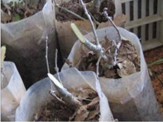
Şekil 3. Meşe anaçlarının diliksiz İngiliz aşı için hazırlanması.

Üç farklı aşılama zamanı ve aşı tekniğinin kullanıldığı çalışmada; “yongalı göz (chip-budding)”, “diliksiz İngiliz” ve “T-göz” aşı teknikleri kullanılmıştır. Yongalı göz aşısı uygulamaları, 15 Eylül 2005 tarihinde Eğirdir (Isparta) Orman Fidanlığına ait fidanlık parselinde yapılmıştır. Aşılamanın yapıldığı fidanlık parseli ve aşı için hazırlanmış olan anaçlar Şekil 2’de görülmektedir.