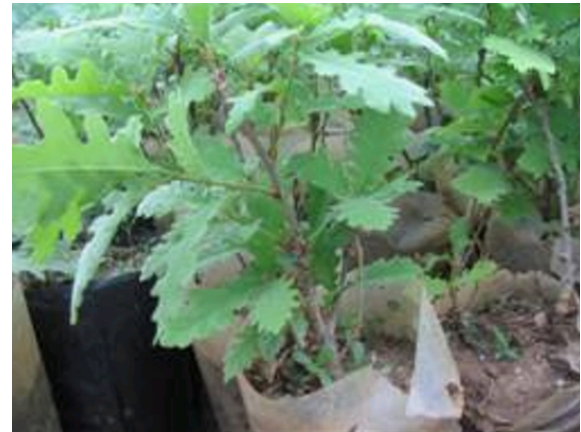
Şekil 1. Denemede anaç materyali olarak kullanılan kasnak meşesi fidanlarının genel görünümü.