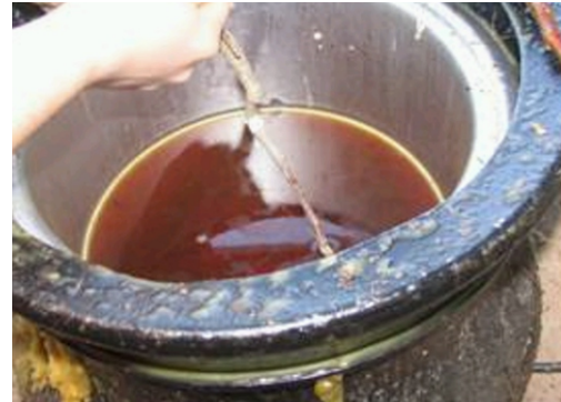
Şekil 6. Parafin uygulamasının yapılışı