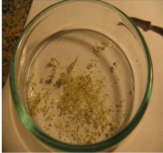
Şekil 7. Meşe gövdelerine ait kabuk parçalarından floem dokusunun kazınması ve ekstrakte edilen floem dokusunun genel görünümü.