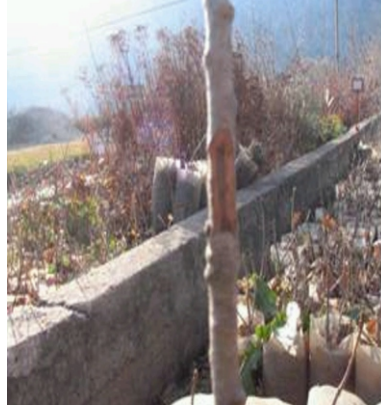
Şekil 2. Yongalı göz aşıların uygulandığı fidanlık parselinin genel görünümü ve aşıya hazırlanmış olan anaç.