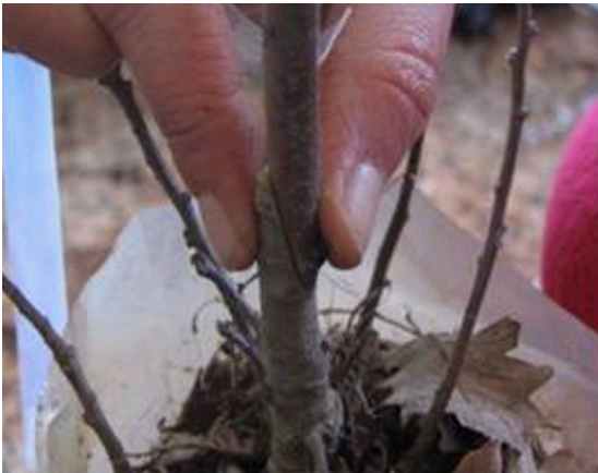
Şekil 4. Aşı kaleminin anaç üzerine yerleştirilmesi.

23 Mart 2006 tarihinde diliksiz İngiliz aşı tekniği ile uygulanan aşılama ise, Isparta’da özel bir fidancılık işletmesinde yapılmıştır. Bu aşı tekniğinde öncelikle, anaçın tepesi yere paralel, sonra da bu kısım aşı bıçağı ile 3–4 cm’lik bir yüzey teşkil edecek şekilde bir yöne meyilli olarak ikinci defa kesilmiştir (Şekil 3.) Daha sonra, üzerinde 4– 5 göz bulunan aşı kaleminin alt ucu, alt gözün karşı tarafında aynı anaçtaki şekilde kesilerek, kalemin kesik kısmı, anaçın kesilen kısmına yerleştirilmiştir (Şekil 4). Son olarak da, yukarıdan aşağı doğru aşı bağı ile bağlanarak, parafinleme işlemi yapılmıştır (Şekil 5 ve Şekil 6). Aşılama bitkiler aşılama sonrası haziran ayı ortalarına kadar, polietilen örtülü yüksek tünel altında tutulmuşlardır.