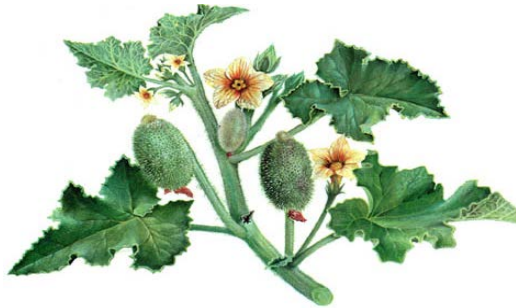
Şekil 1. Ecballium elaterium (L.) (cirtatan) [23].

Ülkemiz flora bakımından dünyada oldukça zengin ülkelerin başında gelmektedir. Bir ülkenin flora bakımından zenginliği; o ülkede yetişen çok fazla türe sahip olması, bitkilerin yayılışı ve çeşitli vejetasyon tiplerine sahip olmasıyla ifade edilmektedir. Ülkemizin floristik bakımdan zengin olmasının nedenleri; değişik iklim, topografya, jeolojik yapı, çeşitli toprak yapıları ve ana kaya tiplerine sahip olmasına, birçok cinsin gen merkezi olmasına, floristik açıdan endemizm oranının yüksek olmasına, çok sayıda kültür ve süs bitkisinin orijin merkezinin oluşuna, Anadolu ve çevresinde birçok kültür bitkisinin bulunmasına, Asya ile Avrupa kıtaları arasında köprü görevi yapmasına ve üç farklı fitocoğrafik bölgenin (İran-Turan, Akdeniz ve Avrupa-Sibirya) birleştiği yerde bulunmasına bağlıdır [2-4].