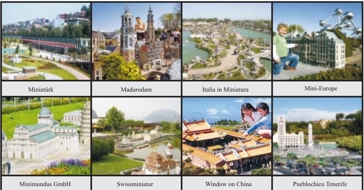
Şekil 1. Araştırma alanlarının fotoğrafları

Araştırma materyali; başlıca araştırma alanları (Şekil 1) ile bu çalışma için özgün olarak hazırlanmış anket formundan oluşmaktadır. Bunun yanı sıra; minyatür parkların kavramsal içeriğine ve araştırma