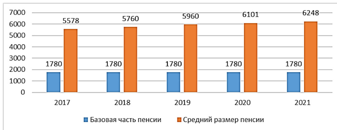
Рис. 3: Размер средней и базовой части пенсии, сом.

Численность пенсионеров КР составила в 2020 г. 736 тыс. человек. Среднемесячный размер пенсии населения в КР за 2017-2020 гг. возрос всего на 9,4%, в то время как базовая часть пенсии за 2017-2022 гг. остается на уровне 1780 сом. из-за дефицита бюджета (рис. 3). В 2021 г. средний размер пенсии составил 6248 сом., что почти на четверть выше стоимости фактически сложившегося прожиточного минимума для пенсионеров (за 2021 г. 5580 сом.). К тому же улучшился показатель количества пенсионеров, получающих пенсии выше прожиточного минимума пенсионера (ПМП). Если в 2010 г. лишь 22,5% пенсионеров получали пенсию выше уровня ПМП, то по итогам 2021 г. доля таких пенсионеров достигла 51%.