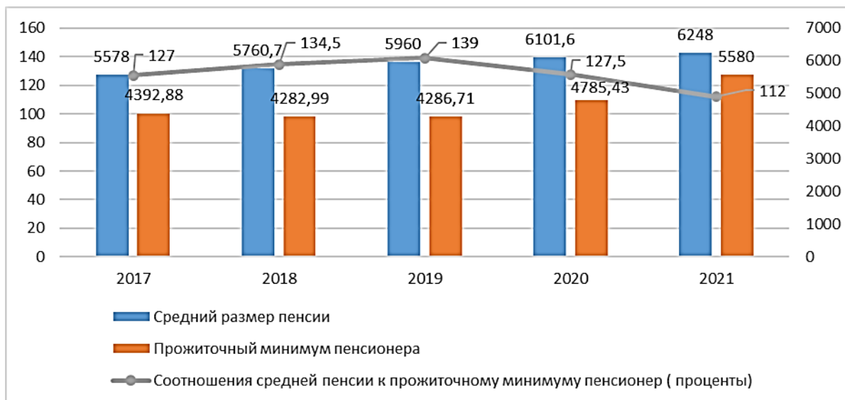
Рис. 2. Процентное соотношение средней пенсии к прожиточному минимуму пенсионера