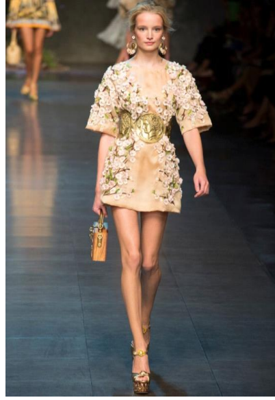
Resim 3: Dolce Gabbana'nın 2014 İlkbahar Ready To Wear Defilesi