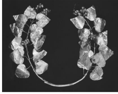
Kaynak: (Andrewoliver, s. 271)