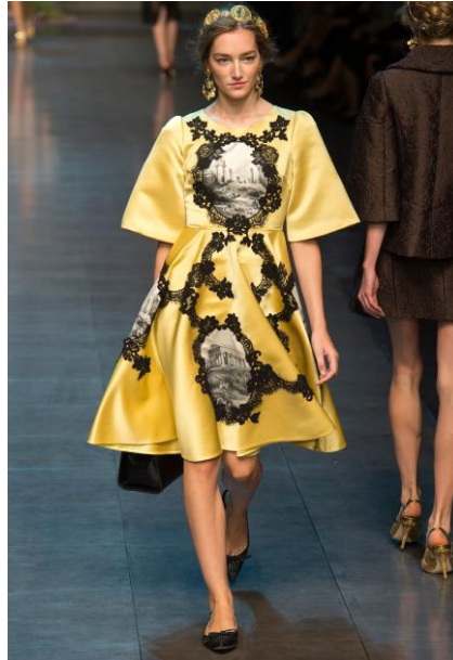
Resim2: Dolce Gabbana'nın 2014 İlkbahar Ready To Wear Defilesi