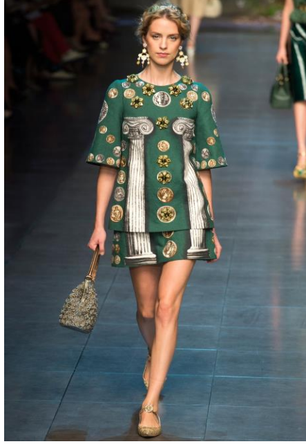
Resim 1: Dolce Gabbana'nın 2014 İlkbahar Ready To Wear Defilesi