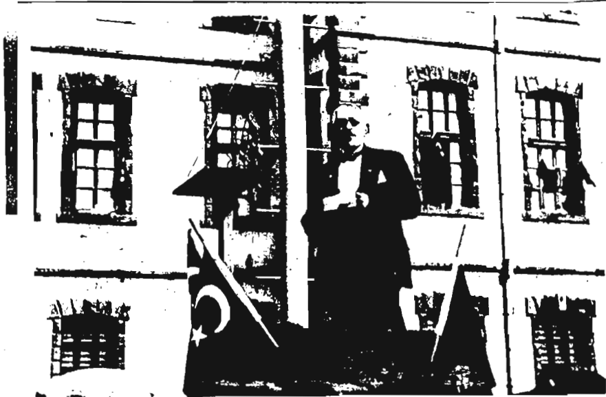
Durak Bey 12 Mart 1934 tarihinde Erzurumun Kurtuluşu Dolayısıyla eski belediye binası önünde konuşma yaparken