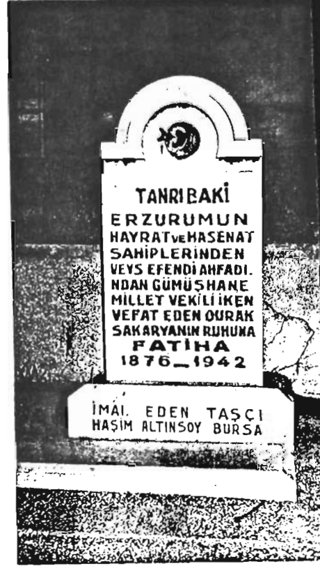
Durak Bey'in Bursa Emir Sultan'da