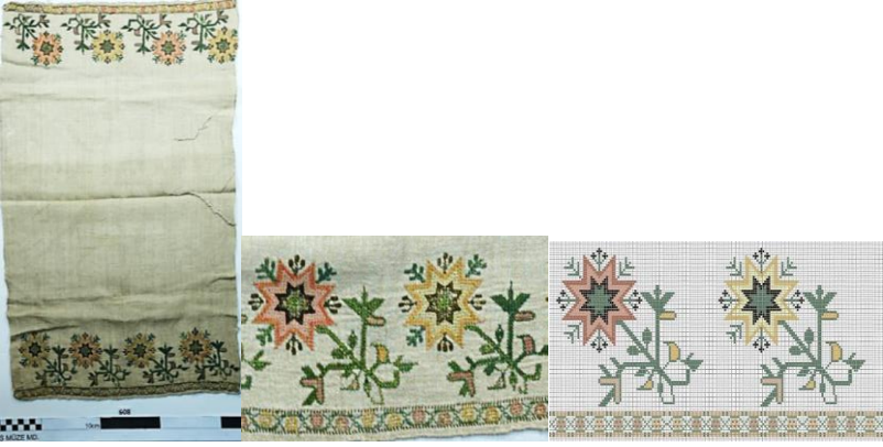
Fotoğraf 3. Peşkir genel görünümü. Fotoğraf 4. Motif detayı Çizim 2. Desen çizimi

İkinci örnekte pamuk-keten kumaş kullanılmış ve saçaksız olarak tasarlanmıştır. Peşkirin her iki kısa kenarında dört adet çiçek motifinin tekrarı ile düzenlenmiştir. Kısa kenarda en altta ince sınırlar arasında baklava motiflerinin içinde iki adet pembe iki adet sarı çiçek motifi olacak şekilde ince su oluşturulmuştur. Bunun üzerinde ise hafif yana yatık şekilde sekiz köşeli yıldız çiçeği motifi yer almaktadır. Biri sarı biri pembe olmak üzere toplam dört adet bulunmaktadır. Çiçeğin yaprakları ve bazı tohumları yeşil renkli, bazı tohumları ise siyah renklidir. Konturlü olarak yapılan peşkirde bir tarafın renkleri sergilenme koşulları nedeniyle solmuştur.