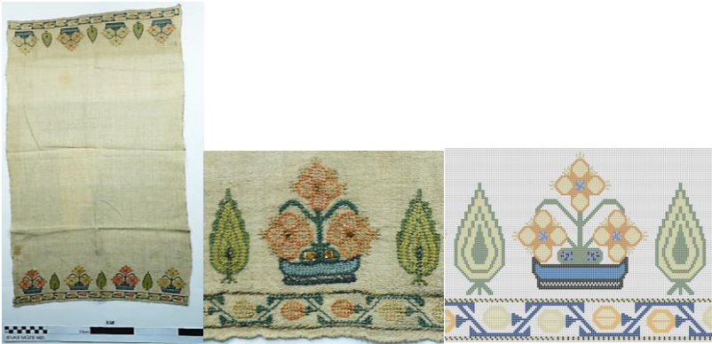
Fotoğraf 5. Peşkir genel görünümü. Fotoğraf 6. Motif detayı. Çizim 3. Desen çizimi.

İkinci örnekte pamuk-keten kumaş kullanılmış ve saçaksız olarak tasarlanmıştır. Peşkirin her iki kısa kenarında dört adet çiçek motifinin tekrarı ile düzenlenmiştir. Kısa kenarda en altta ince sınırlar arasında baklava motiflerinin içinde iki adet pembe iki adet sarı çiçek motifi olacak şekilde ince su oluşturulmuştur. Bunun üzerinde ise hafif yana yatık şekilde sekiz köşeli yıldız çiçeği motifi yer almaktadır. Biri sarı biri pembe olmak üzere toplam dört adet bulunmaktadır. Çiçeğin yaprakları ve bazı tohumları yeşil renkli, bazı tohumları ise siyah renklidir. Konturlü olarak yapılan peşkirde bir tarafın renkleri sergilenme koşulları nedeniyle solmuştur.