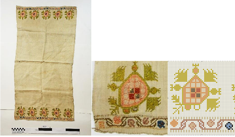
Fotoğraf 11. Peşkir genel görünümü. Fotoğraf 12. Motif detayı. Çizim 6. Desen çizimi.

motifi bulunmaktadır. Dallar kahverengi, yapraklar yeşil, üzüm ise sarı renklindedir.