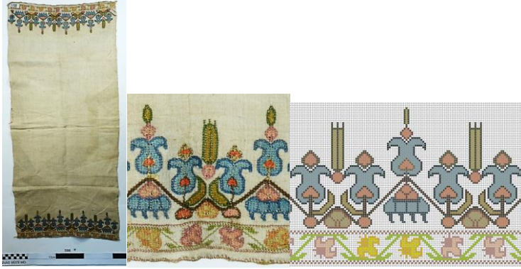
Fotoğraf 7. Peşkir genel görünümü. Fotoğraf 8. Motif detayı. Çizim 4. Desen çizimi.

olacak şekilde planlanmıştır. Saksıda üç adet çiçek bulunmaktadır. Mavi renkli saksıdaki çiçekler bir pembe bir sarı olacak şekilde sıralanmıştır.