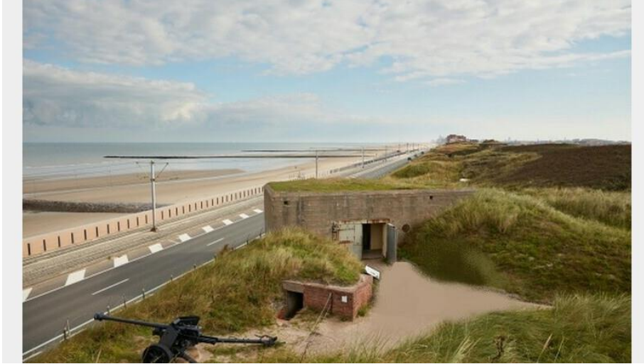
Resim 16: Oostende Şehrinde Yer Alan Atlantic Wall Open-Air Museum ( https://www.loisiramag.fr/patrimoine/826/atlantikwall-raversyde )