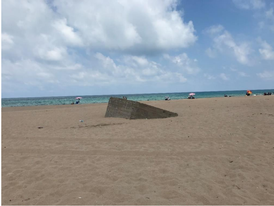
Resim 13: Sahilköy, Korugan