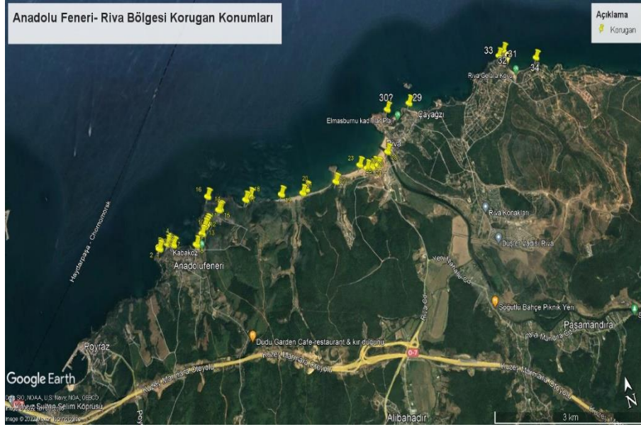
Şekil 2: Anadolu Feneri ve Riva Arası Koruganların Konumları