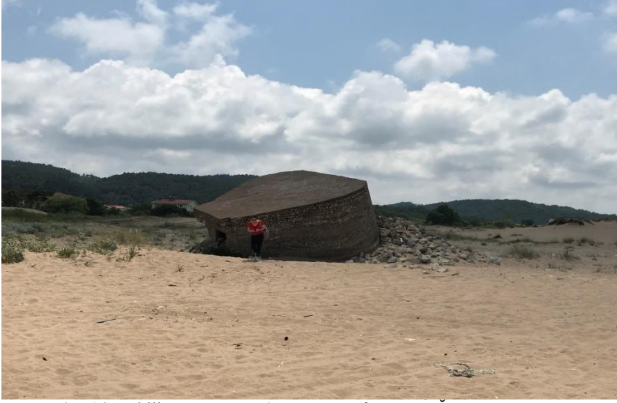
Resim 14: Sahilköy, Korugan