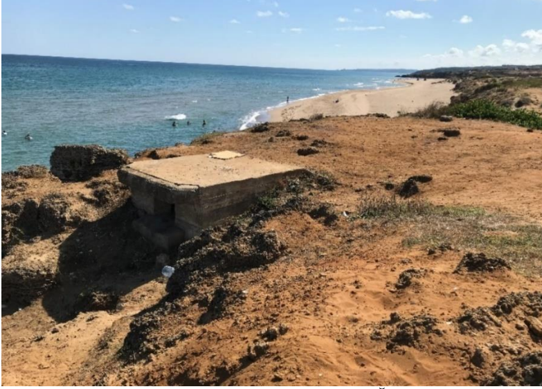
Resim 2: Sahilköy, Korugan