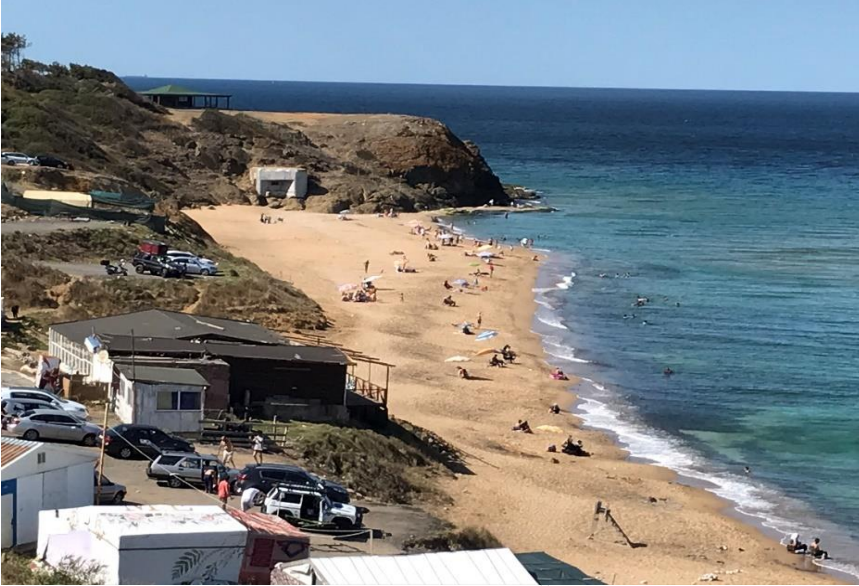
Resim 5: Riva, Korugan