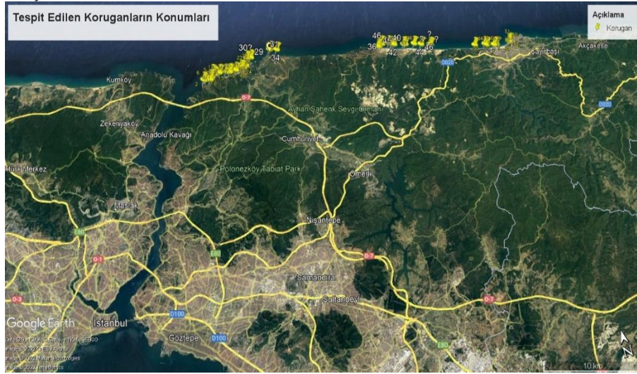
Şekil 1: Tespit Edilebilen Koruganların Konumları