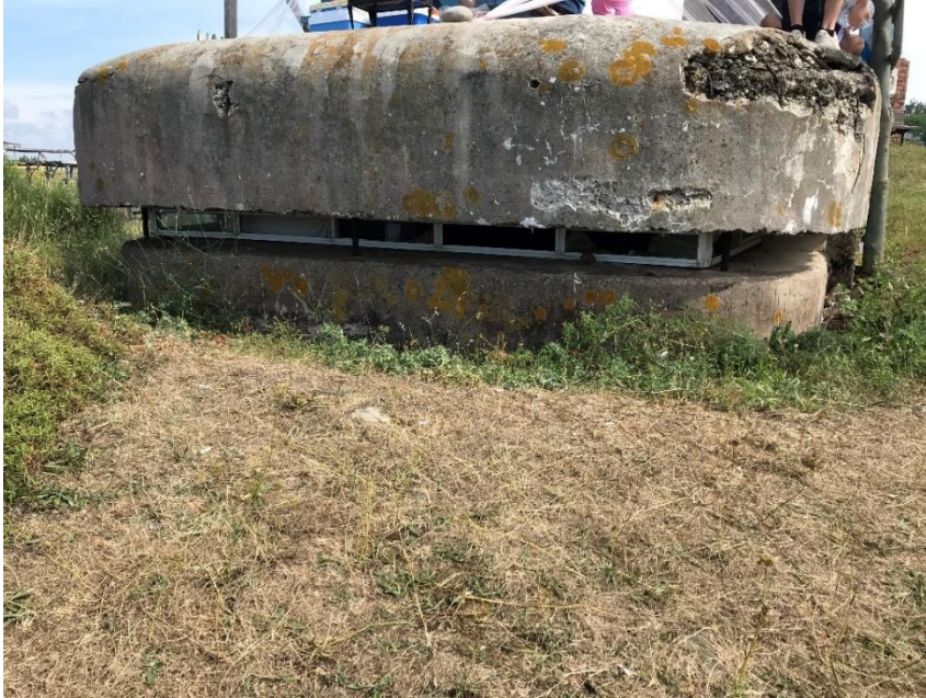
Resim 9: Riva, Korugan