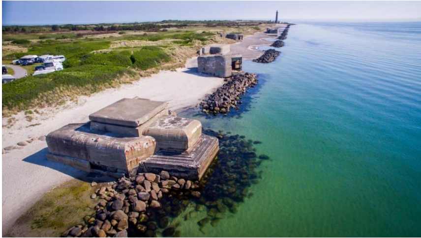
Resim 17: Skagen Bunker ( https://atlantvolden.dk/en/locations/skagen-graa-fyr#gallery-6 )