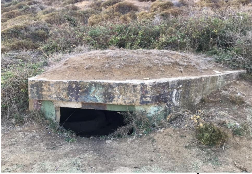
Resim 12: Anadolu Feneri, Korugan