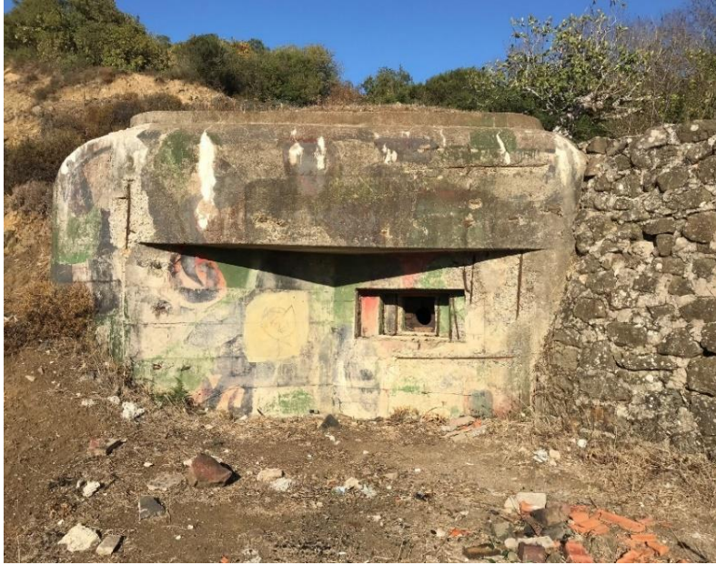
Resim 1: Anadolu Feneri, Korugan, (Foto: Mustafa ARMAĞAN)