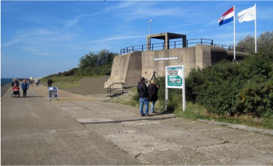
Resim 15: Hoek van Holland Atlantic Wall Museum, ( https://www.atlantikwall-museum.nl/home.html )