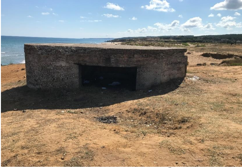
Resim 3: Sahilköy, Korugan