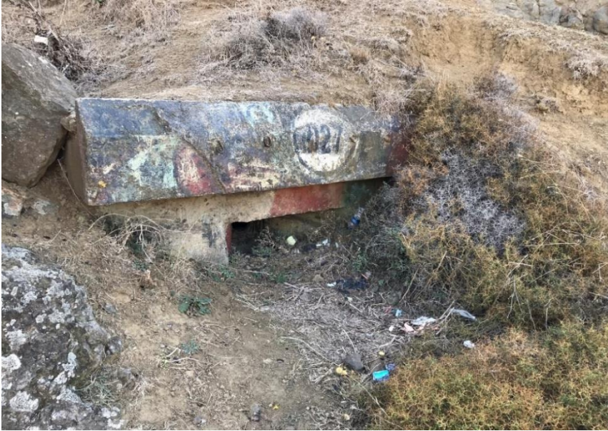
Resim 11: Anadolu Feneri, Korugan