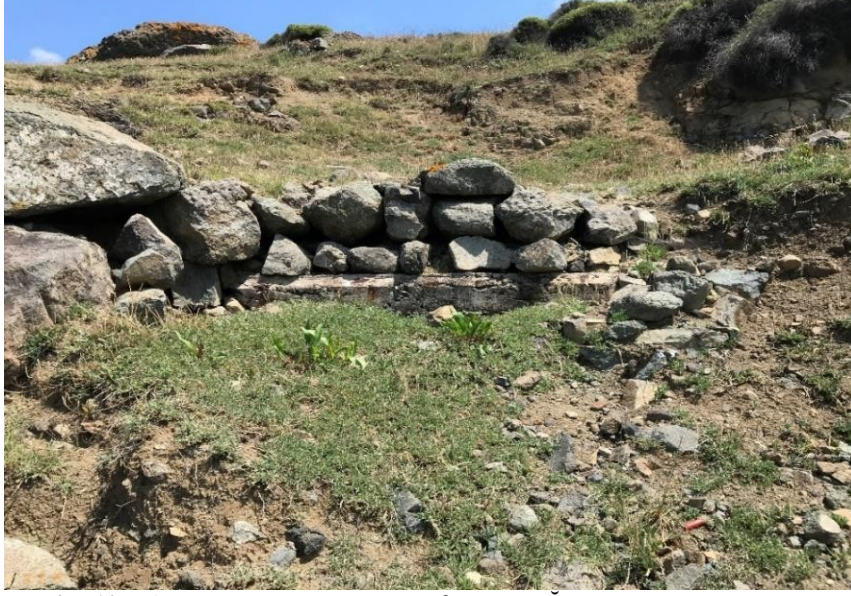
Resim 10: Riva, Korugan