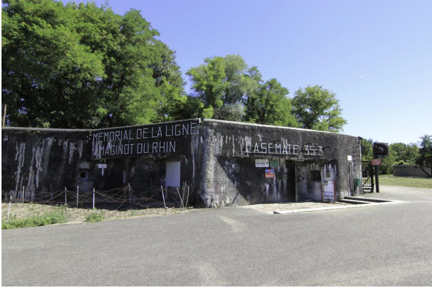
Resim 18: Ren Meginot Hattı Anıt Müzesi, ( https://europe remembers.com/fr/destination/musee-memorial-de-la-ligne-maginot-du-rhin/ )