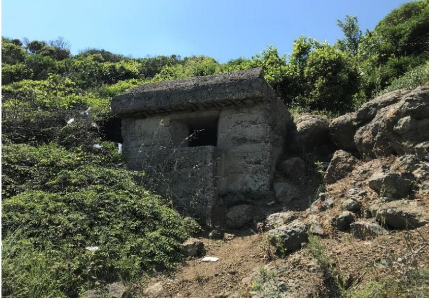
Resim 7: Riva, Korugan