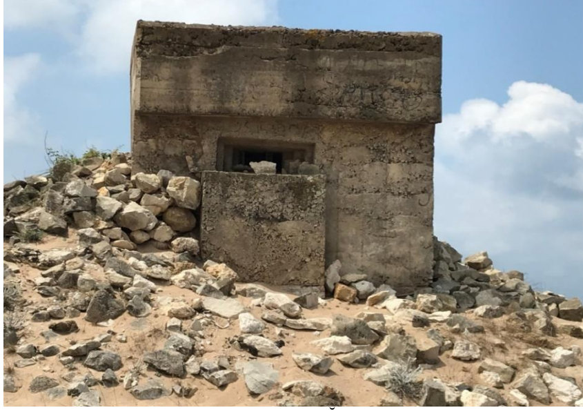
Resim 8: Korugan, (Foto: Mustafa ARMAĞAN)