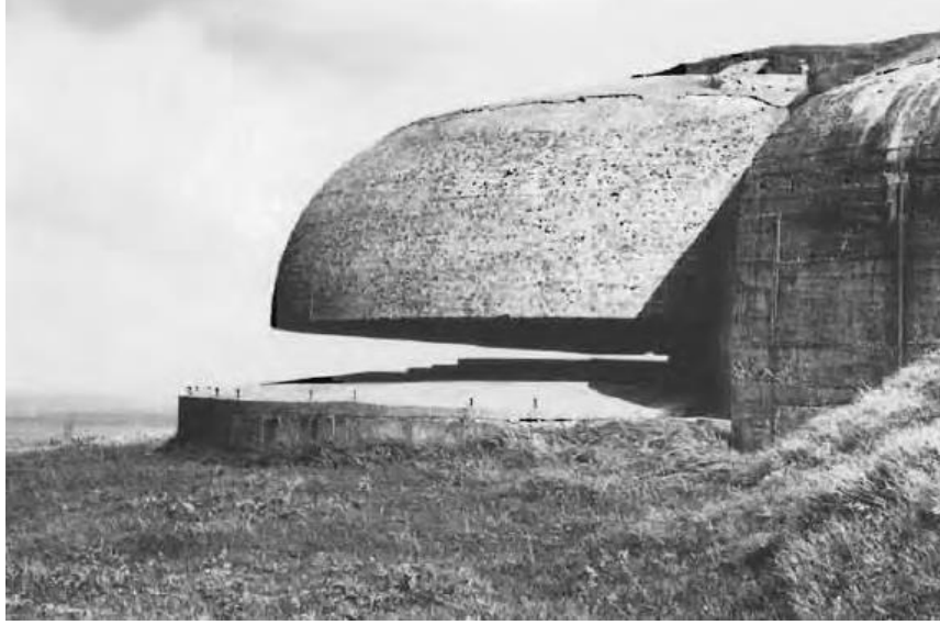
Resim 20: Oval Hatlara Sahip Korugan (VİRİLİO, Paul (1994), Bunker Archeology , Princeton Architectural Press, Newyork, s.156.)