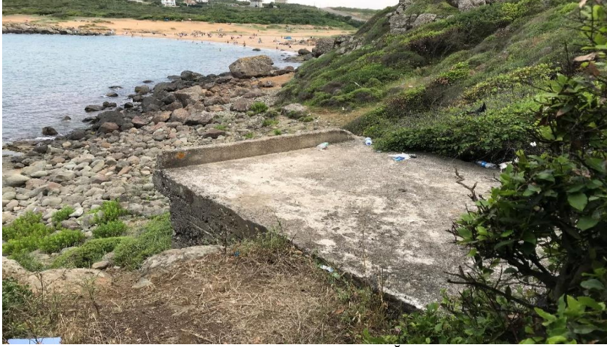
Resim 6: Riva, Korugan