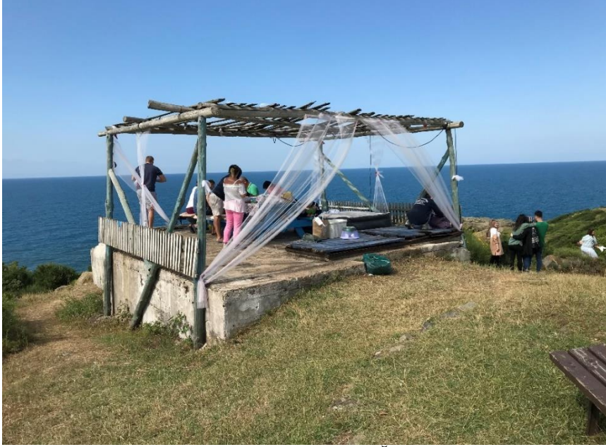
Resim 4: Riva, Korugan