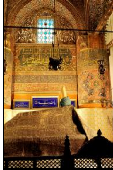
4-Türbenin içten görünümü

Mezar odası bulunan türbe, dört fil ayağı üzerinde yükselmektedir. Türbenin üç yanı açıktır. Üst örtüsü dıştan dilimli olup çinilerle kaplanmıştır. Türbenin fil ayakları, kubbesi ve güney duvarı kalem işi süslemelerle bezelidir. Güney duvarı-