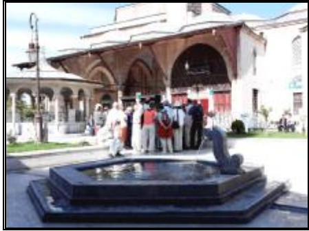
16-Şeb-i Arus Havuzu