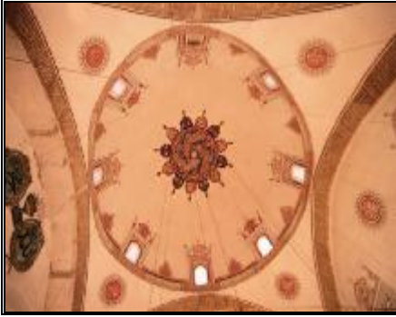
7-Mescit kubbe süslemeleri

Mescidin ana girişi batı yöndedir. İki kanatlı kapısı ceviz ağacından künde-kari tekniğinde yapılmıştır. Mescidin ayrıca doğu yönde semaheneden mescide geçişi sağlayan küçük bir kapısı ile güneyde huzurdan girişi sağlayan Çerağ Kapısı bulunmaktadır. Mescidin zemini yerden 35 cm. yüksek tutulmuştur. Mermerden yapılmış mihrabı, ahşaptan yapılmış müezzin mahfeli ile taştan yapılmış kürsüsü orjinaldir.