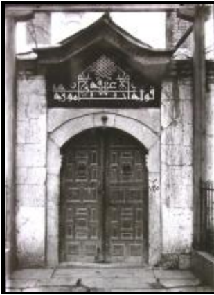
1-Mevlâna Dergahının Asarı Atika Müzesi olarak düzenlendiğini gösteren bir resim