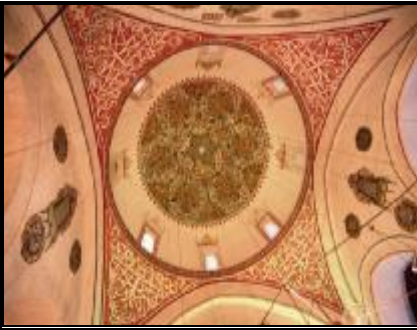
5-semahane kubbe süslemeleri

Mevlevi Ayini semanın yapıldığı yerdir. 17.50 x 17.50 m. ölçülerinde kare plana sahiptir. Semahane, dört fil ayağı üzerinde yükselen bir kubbe ile örtülüdür.(resim 5) Kubbenin içi geometrik, bitkisel ve rûmî motiflerinden oluşan kalemişiyle süslenmiştir. Semahanede mutrip, kadınlar mahfeli ile erkekler mahfeli bulunmaktadır. Semahane Osmanlı Sultanı II.Selim tarafından yaptırılmıştır 5 . II.Abdülhamit döneminde semahaneye kadınlar ve erkekler mahfeli ilave edilmiştir 6 .