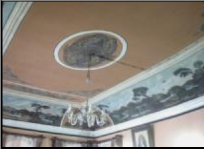
11-Meydan-ı Şerif tavan süslemeleri

Şeyh Efendi ile dergahta görevli diğer Mevlevi dedelerin sabah namazından sonra kahve içtikleri ve murakebe yaptıkları yerdir. 1867 yılında onarım gören Meydan-ı Şerif Odası, günümüzde Müdür Odası olarak kullanılmaktadır. Tavanı Barok üslupta yapılmış kalem işleriyle süslenmiştir.(resim 11)