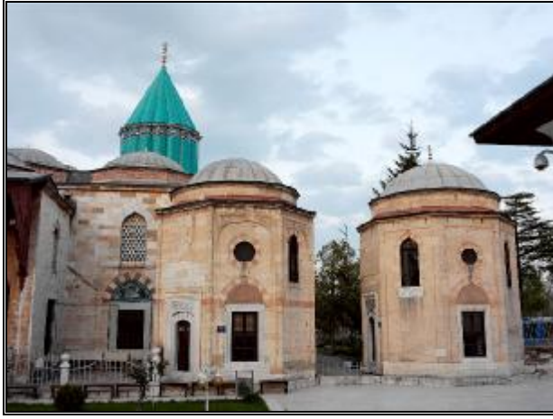
16-Bahçe içerisinde yer alan türbelerden görünüm