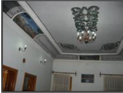
13-Çelebi dairesinin kalem işi süslemeleri

Müzenin kuzey batısında Derviş Hücreleri'nin arka tarafındaki bahçe içerisinde yer almaktadır.(resim 12) 19.yy.da yaptırılan Çelebi Dairesi tek katlı olup, bir salon ile dört odaya sahiptir. Salonun tavanı kalem işi süslenmiştir.(resim13) Çelebi Dairesi Şeyh Efendi'nin evi olarak kullanılmıştır.