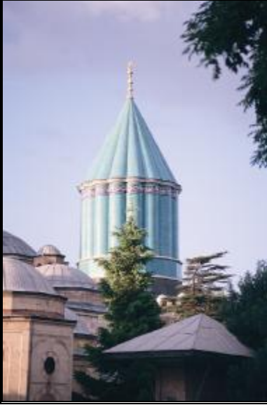
3-Hz. Mevlâna'nın Türbesi

Hz. Mevlâna'nın ölümü üzerine Selçuklu Sarayı'ndan Alâmeddin Kayser ile Süleyman Pervane'nin karısı Gürcü Hatun tarafından Mimar Tebrizli Bedredin'e 160 bin dirhem harcanılarak yaptırılmıştır 1 . Kaynaklara göre türbenin inşaatı 1274 yılında tamamlanmıştır 2 . (resim 3)