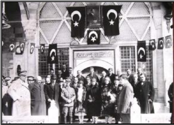
2-Dergahın müze olarak açılışının yapıldığı gün