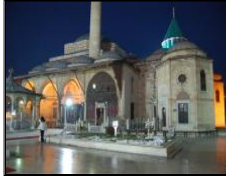
8-Son cemaat yerinin genel görünümü

Son Cemaat yeri mescidin batısında bulunmaktadır. Tilavet Odası girişi ile birlikte 4 bölümlü olan son cemaat yeri 4 kubbeye örtülüdür. Son cemaat yerinin güney batısında yer alan minaresi 1918 yılında yapılmış olup, tek şerefelidir. (resim 8)