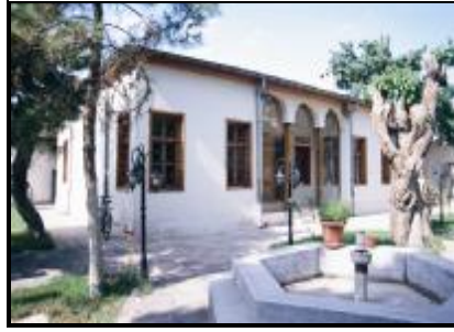
12-Çelebi Dairesinin genel görünümü