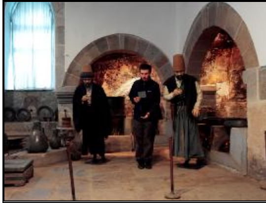
10-Mutfaktan bir görünüm

Derviş Hücreleri ile birlikte 1584 yılında yaptırılan mutfak, 1867 yılında onarım görmüştür 9 . Mutfak giriş kısmının üst katında Kazancı Dede'nin kaldığı bir oda bulunmaktadır. Tonozlu girişten sonra Mevlevi Dervîşi olmak isteyenlerin 3 gün oturup sıvandıkları Saka Postu, Ateşbaz Velî makamı olarak kabul gören yemeklerin pişirildiği ocaklar ile ölen dervişlerin gasillerinin yapıldığı yer karşımıza çıkmaktadır.