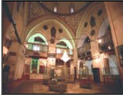
6-semahanenin içten görünümü

Semahanenin duvarlarında madalyonlar içerisinde bulunan kalem işi süslemeleri 1888 yılında Konyalı hattat ve ressam Mahbub Efendi tarafından yapılmıştır. Kitabesi Mescidin güney davarında yer almaktadır. Semahanenin kubbesinde, kubbe kasağında ve kubbeye geçiş kısımlarında yer alan kalem işi süslemeleri 1985 yılında yaptırılan restorasyon sırasında sıva altından açığa çıkartılarak yeniletilmiştir 7 .