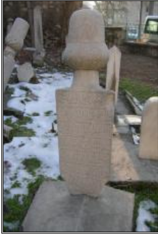
Resim 10- Abdurrahim Atâ Çelebi'nin Baş Taşı