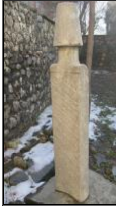
Resim 2- Hacı Molla zâde Salih Ziya Bey'e Ait Baş Taşı