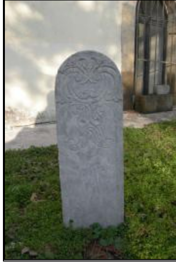
Resim 5a- Mehmet Faik Efendi'nin Ayak Taşı