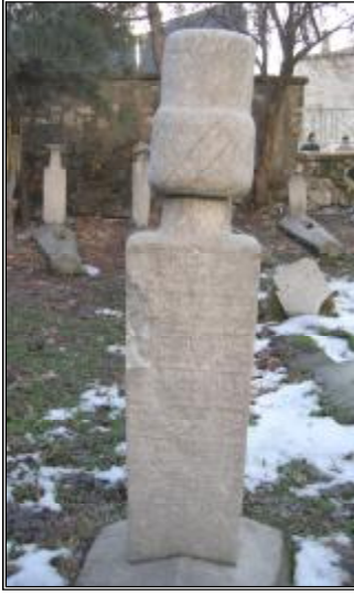
Resim 8- Şeyh Abdullah Efendi'nin Baş Taşı