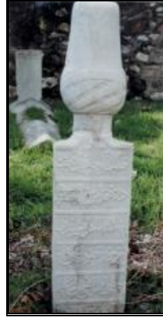
Resim 12a- Yahya Sâkıb Çelebi'nin Baş Taşı (N. Bakırcı'dan)

Mezarlığın kuzey batısında bulunan Yahya Sâkıb Çelebi'ye ait kabirden günümüze ancak ayak taşı ve pehle kısmı intikal etmiştir. 1994 yılında N. Bakırcı tarafından yapılan araştırmada ise baş taşının mevcut olduğu müşahede edilmektedir. (R.12). N. Bakırcı'nın çalışmasında yer alan baş taşına ait bilgileri buraya aktarıyoruz 18 :