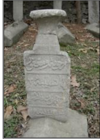
Resim 13- Nesibe Hanım'a Ait Baş Taşı

مرحومه ومغفور Merhume ve mağfur لها نسيبه lehâ Nesibe روحیچون فاتحه Ruhiçün fâtiha سنه ۱۲۱۶ Sene 1216