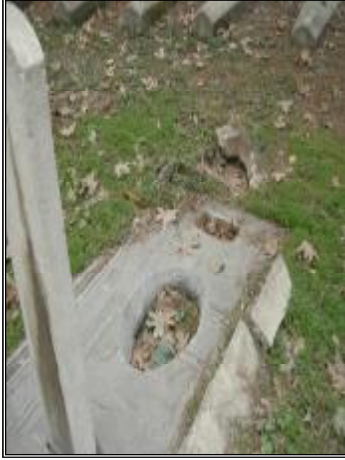
Resim 12- Yahya Sâkıb Çelebi'nin Mezarının Bugünkü Durumu