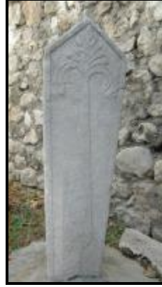
Resim 2a- Hacı Molla zâde Salih Ziya Bey'e Ait Ayak Taşı