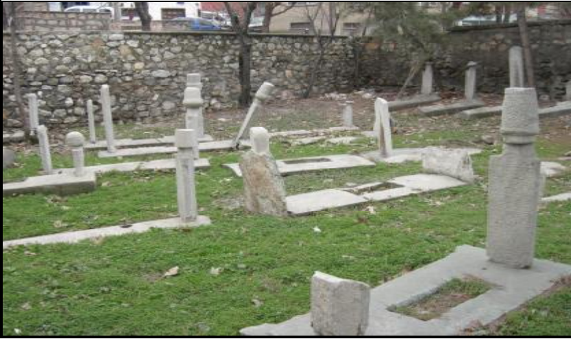
Resim 18-Hazirenin Kuzey Doğu Cepheden Görünümü