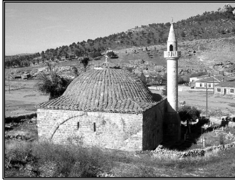
Ek 3: Bahşî'nin müderrislik yaptığı Kızılcatuzla köyündeki I.Murâd Hüdâvendigâr Camii