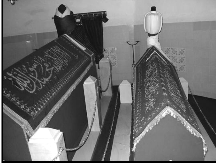
Ek:2 Yahyâ b. Bahşî'nin türbesi