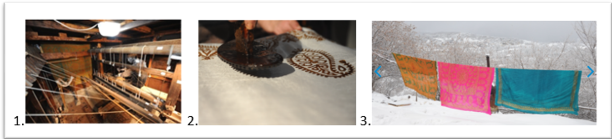
Görsel 7: 1. İpek kelağayının tezgâhta dokunması; 2. Baskı işlemi; 3. Başörtüsü çeşitleri (URL-6).

Kelağayı, ipek kumaşların aksine kalıp kullanılarak süslenirdi. Kelağayının basma-kalıp üsuluyla süslenmesi “tavakeş” adlı uzman kalıp ustaları tarafından yapılıyordu (Halili, 2019: 145). Kelağayılar, geometrik veya bitkisel motiflerden oluşan desenlerle süslenirdi (Terlanov ve Efendiyev, 1960: 60).