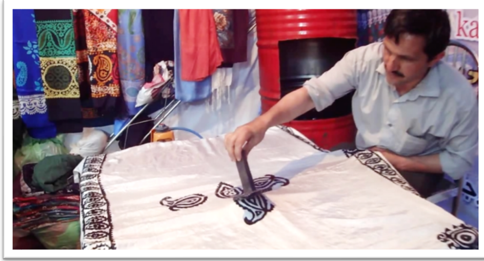
Görsel 12: İpek kelağayıya baskı işlemi (Üskü, Tebriz) (URL-8).

edilen doğal renkleri, kumaş üzerinde çeşitli desen ve şekiller kullanarak el sanatlarında uygulamaktadırlar. Bu yöntemde kumaş üzerine yapılan boyama işlemlerinde daha çok ravent, ladin, nar kabuğu ve zerdeçal gibi bitkisel boyalar kullanılmaktadır. Antik çağda bu alanda faaliyet gösteren sanatçılar, saç ağacı yaprakları, kostik soda ve kil karışımından dayanıklı ve kıvamlı bir malzeme elde etmişler ve kumaşın bir kısmını bu malzeme ile fırça ile kaplayarak tüm kumaşı boyamışlardır. Batik baskı yöntemleri arasında dayanıklı baskı, şablon baskı, ipek kumaş üzerine batik boyama, örümcek ağı, fırça, boyasız ve bant (büküm) yapılır (URL-7).