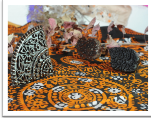
Görsel 3: Tahta baskı işlemi yapılmış kelağayı (URL-4).

Azerbaycan halkının sözlü halk edebiyatı örneklerine, destanlarına, koşma, garaylı ve manilerine, özellikle aşk şiirine kadınların güzelliğine güzellik katan kelağayılarla ilgili bilgiler ve şiirsel fikirler yansıtılmaktadır. Kelağayı, farklı devirlerde yaşamış şairlerimizin ilgisini çekmiş ve mısralarında inci olmuştur.