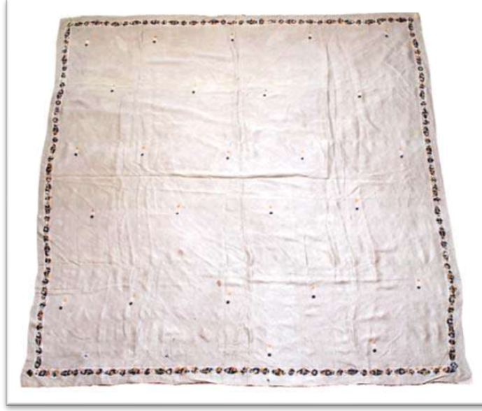
Görsel 6: Kelağayı, ipek, ölçüsü: 150X150 cm