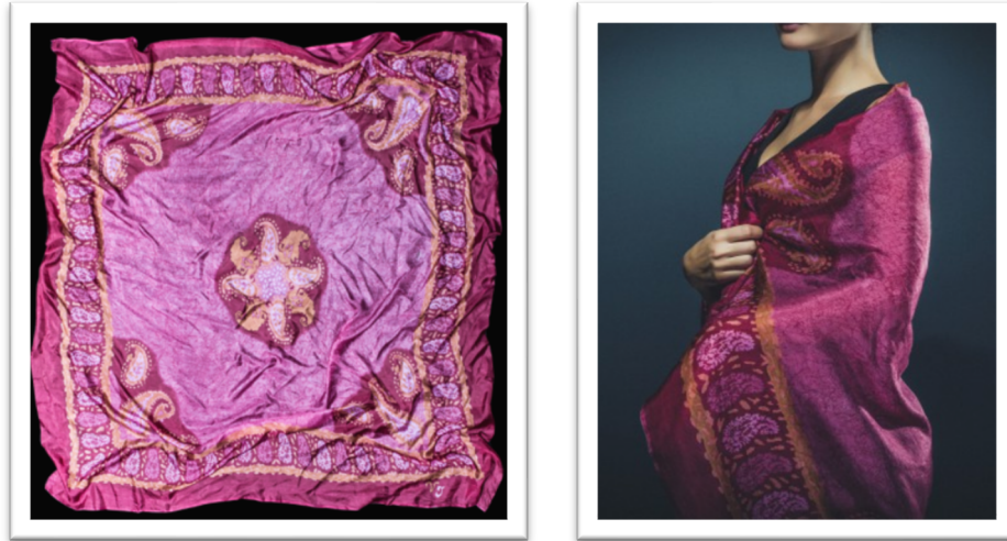
Görsel 2: Azerbaycan kelağayısı (URL-3).

Çelebi, A. Düma ve F. Kotov gibi seyyah ve diplomatlar, hatıralarında kelağaydan bahsetmektedirler (Babayev ve Şahbazov, 2017: 146).