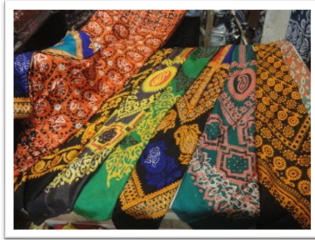
Görsel 5: Tebriz Kelağayı (URL-5).

Uzun zamandır bilinen kelağayı Azerbaycan'ın Tebriz, Gence, Şamahı, Şeki ve Nahçıvan'da yüksek kalite ile üretilmektedir. Bakü'ye 165 km uzaklıkta bulunan İsmayılı ilçesine bağlı Basgal köyü ve Şeki'de başörtüsü üretimi daha yaygın üretilmektedir.