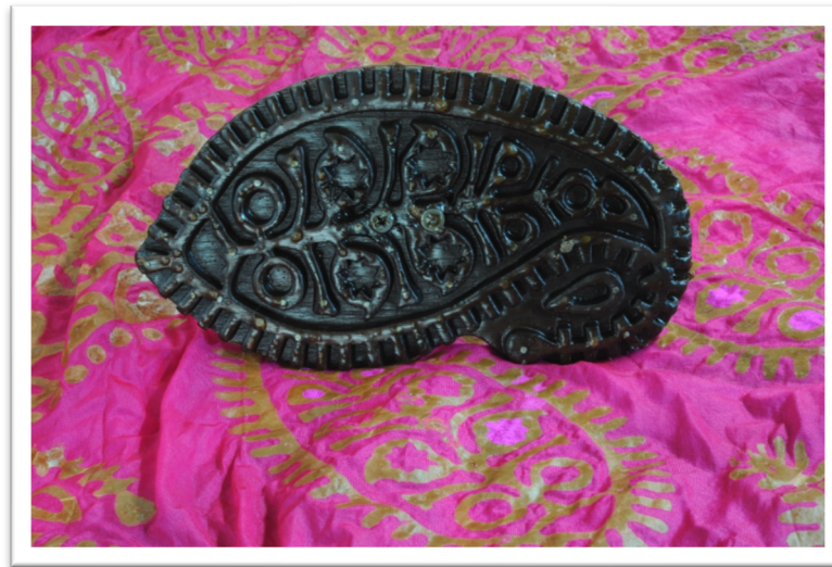
Görsel 8: Tahtadan yapılan buta desenli kalıp (URL-7).

Kelağayının etek uçları (bordür) ve bazen honça (orta) geometrik ve çiçek desenleri ile süslenmektedir. İşlenen desenlerin gücü ve derin anlamları yüzyıllardır değişmeden kalıplarda kullanılmıştır. Desenler içerisinde en yaygın olan dekoratif unsurlardan biri buta (Görsel 8) yer almaktadır.