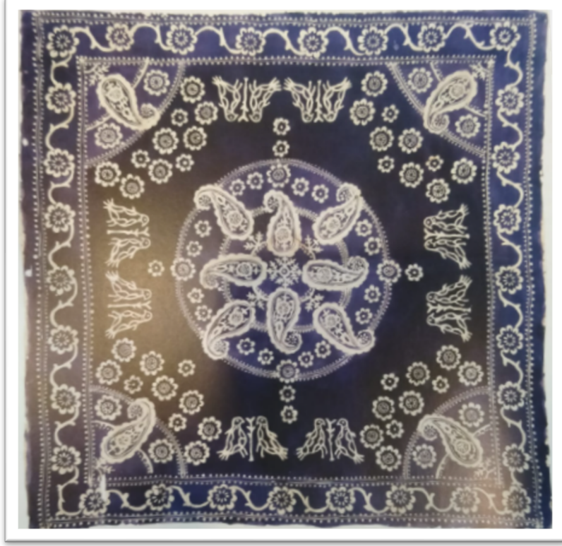
Görsel 9: Buta motifli mavi masa örtüsü, pamuk, 92x92 cm, 1937

halklarında da popülerdir. Bu bağlamda Azerbaycan'ın kuzeybatı sınırında yerleşen Gürcüstan'da “buta” motifli çeşitli dokumaların olduğu ve günlük hayatta blok baskılı pamuklu tekstillerin yaygın olarak kullanıldığı bilinmektedir.