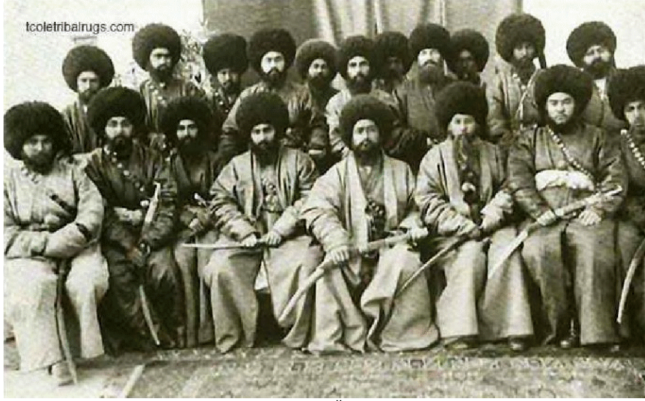
1879 Yılı Birinci Göktepe Savařı'nın Üst ve Alt Kumandanlarından Bir Grup.

Kerimberdi İřan'ın elinde sakladığı Kur'an-ı Kerim'le yemin ederek başlanan bu savařta zafer kazanmak Türkmenler için kolay olmadı. řavařta 2 bin (bazı belgelere göre 3 bin) Türkmen, aynı sırada ünlü řahıslardan Berdimurat Han ve amcası Kurban Han řehit oldu.