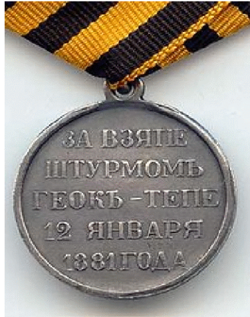
Rusya’da 1881’de sikkelenen ‘Göktepe’yi Zaptederek Ele Geçirme’ Madalyası

Araştırmacılar daha sonra Göktepe kalesini koruyanların üstüne 872.000 tüfek mermisi ve 12.400 top mermisinin atılmış olduğunu hesapladılar. Buna rağmen Ruslar kaleye giremediler. Kalenin uzun ve kalın duvarlarının altını kazarak 1 ton patlayıcı ile 12 Ocak saat 7.00’da kaleyi patlatmak yoluyla girmeyi başardılar.