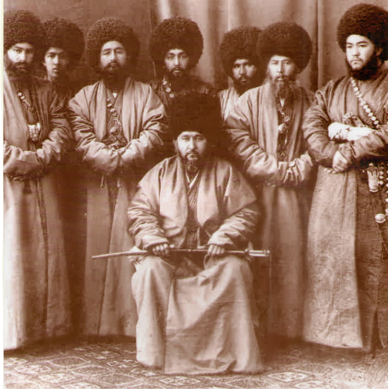
1879 veya 1880 yılında bir İngiliz fotoğrafçı tarafından çekilen resimde tahmine göre ortada sandalyede oturan şahıs Göktepe Savaşı'nın Kahraman Kumandanlarından Kerimberdi İşan olmalıdır.

Göktepe faciası, Türkmenistan'ın son asırlara ait tarihinin en korkunç ve üzücü sayfalarını oluşturmakla beraber gerçekten övülecek kahramanlıklar ve kahramanlarla da hınca-hınç doludur. Çağdaş araştırmacılar Rusların Türkmenlerden bir tek vatan haini bulamadıklarına dikkat çekiyorlar. Bu yazımızda – başlığında belirttiğimiz gibi – Göktepe kahramanlarının bazılarından kısaca söz edeceğiz.