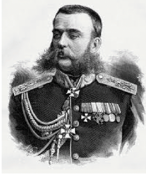
General M.D. Skobelev (1843–1882)

değildi. Kaleyi koruyanların ailelerini geldiği köylere geriye göndermek teklifini – bundan Rusların faydalanacağı için – Kurbanmurat İşan reddetti.