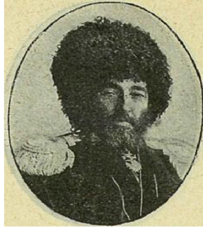
İlk olarak Türkmenlerden Rusya'nın Devlet Duması'na (Parlamento) Deputat (Millet Vekili) seçilen Albay Mahtumkulu Han Nurberdi Hanoglu (1907 yılında San-Petersburg'da çekilen fotoğraf).

Ordu'ya Baş kumandanlık yaparak 1918 yılında General askerî unvana münasip görülen ilk Türkmen olmuştur.