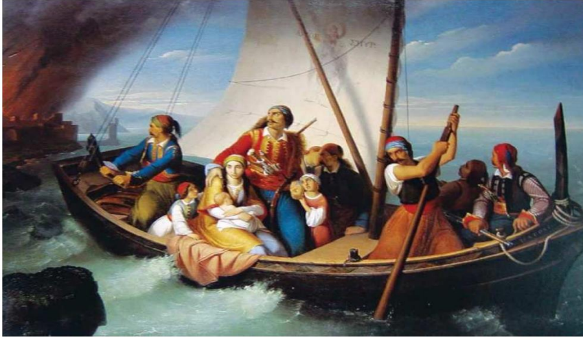
Ek-2: Pargalıların Türk yönetimi yerine İngiliz yönetimini tercih ederek Yedi Ada'ya gidişi