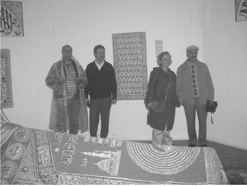
13. Türk Sanatları Kongresi 2007, Budapeşte, Gül Baba Türbesi