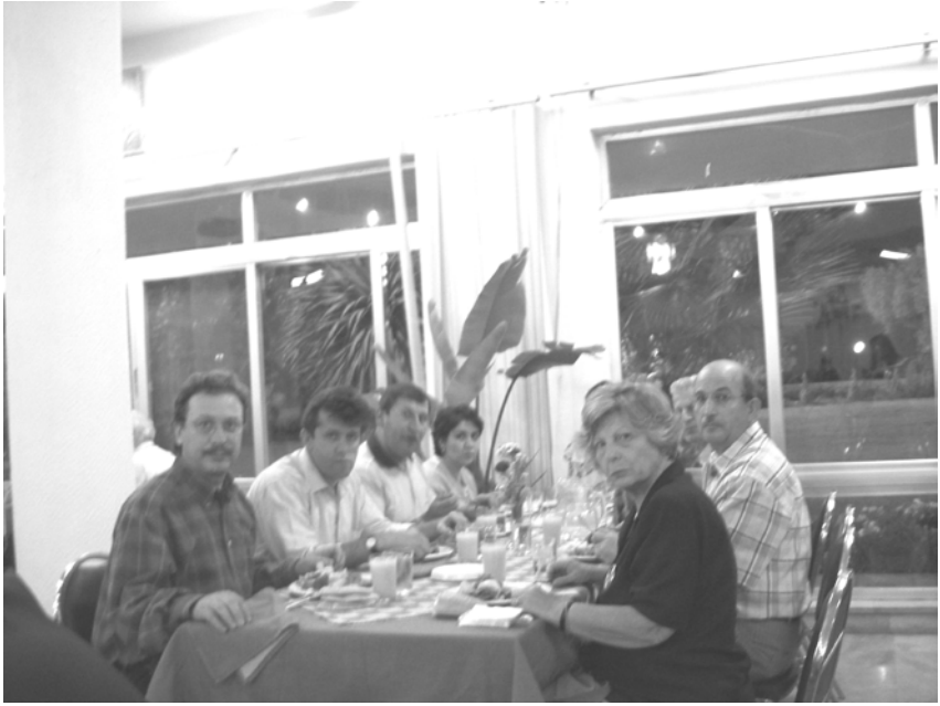
12. Türk Sanatları Kongresi 2003, Amman

yerine getireceğini umut ediyor, mekanı cennet olsun, diyerek satırlarımı sonlandırmak istiyorum.