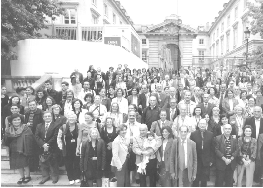
14. Türk Sanatları Kongresi 2011, Paris