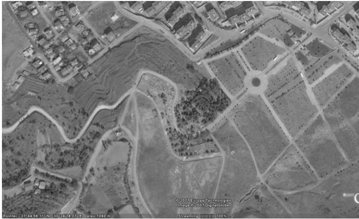
Resim 1: Isparta Hanife Sultan Mezarlığı

Hanife Sultan Mezarlığı, Isparta şehir merkezinin güney doğusunda kalan Halikent Mahallesi sınırları içerisinde yer almaktadır. Yerli halktan alınan bilgilere göre Halikent Mahallesi şehir tarihi açısından yeni kurulmuş bir mahalle olmasına rağmen Hanife Sultan Mezarlığı mahallenin kurulmasından önce de kullanılmakta olan eski bir mezarlıktır.