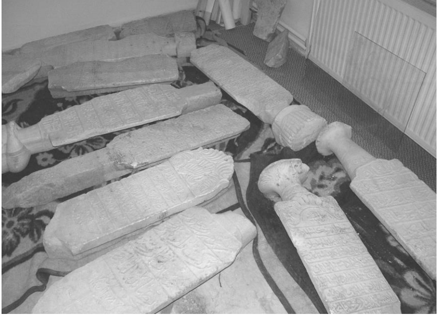
Resim 2: Hanife Sultan Mezarlığındaki “Isparta Mezarlıklar Müdürlüğü” binasında bir odada toplu halde bulunan mezar taşları

Tamamı kitabeli olan taşlardan en eskisi 1178/1764 tarihli (Katalog No:1) taş iken en yenisi 1279/1862 tarihli (Katalog No:7) taştır.