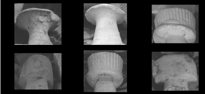
Resim 3: Hanife Sultan Mezarlığında Bulunan Mezar Taşlarında Kullanılan Serpuşlar

Burada tespit edilen mezar taşlarında dikkat çekici bir başka özellik ise, on altı taştan sağlam halde bulunan on tanesinden altı tanesinin başlıklı olması, tüm kadın mezar taşlarında, mezarın kadına ait olduğunu gösterir; gerdanlık, çiçek vb. bitkisel motiflerin yer almasıdır 23 . Erkek ve kadınlara ait şahidelerde yer alan başlıkların bir arada görülebilmesi için başlıklar, tablo içerisinde bir araya getirilmiştir (Resim 3).