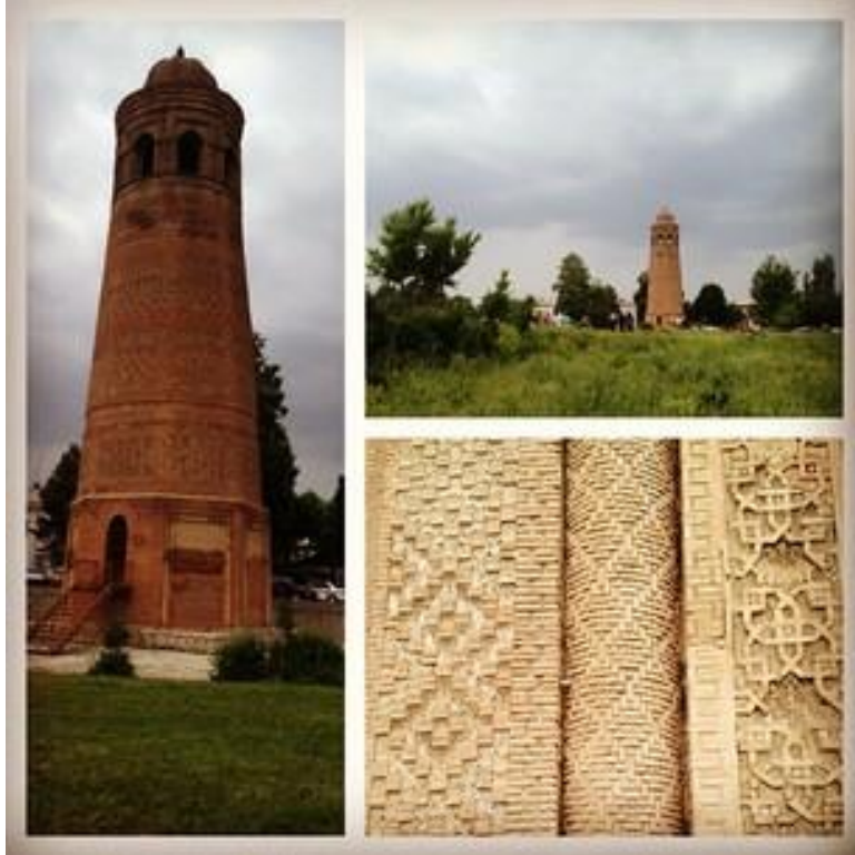
Özkent'te Karahanlılar Döneminden Kaldığı Tahmin Edilen Minare