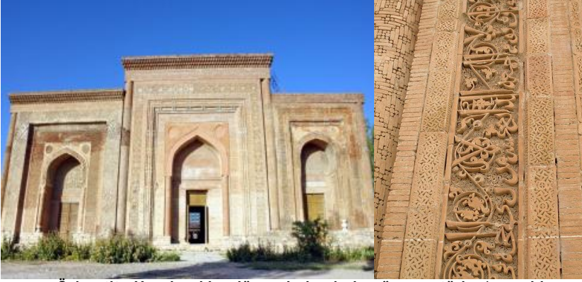
Özkent'te Karahanlılar döneminden kalan üç yapı-türbe/mescid