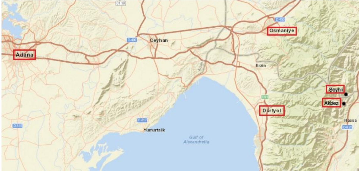
Şekil 1. Darüleytamların bulunduğu yerler (Google Harita)

Ticaret ve Ziraat Nezareti, 24 Eylül 1917 tarihinde Maarif Nezaretine gönderdiği yazısında Adana Valiliği tarafından yapılan incelemede Şeyhli Darüleytamı'nda 50, Dört Yol Darüleytamı'nda 15 ve Akbez Darüleytamı'nda 25 şehit çocuğu barındığından bahisle söylenenlerin aksinde civar darüleytamlarda yer sıkıntısının olmadığını bildirmiştir (Şekil 1). Şeyhli civarında bulunan ormanların ormancılık eğitimine uygun olması sebebiyle başka bir yerin seçilmesinin şimdilik mümkün olmadığını ileri bir zamanda orman mektebinin binasını tamamlanması halinde binanın iade edilebileceği vurgulanmıştır (BOA.MF.MKT.1229/130).