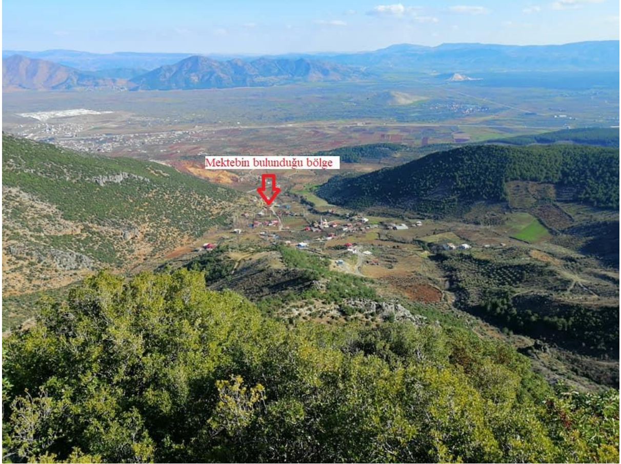
Şekil 4. Esenler köyünden genel görünüş