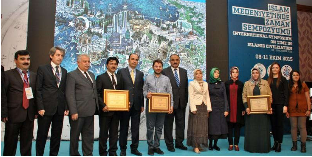
“ZAMANA DAİR” Minyatür Yarışması ödülleri takdim edildi.