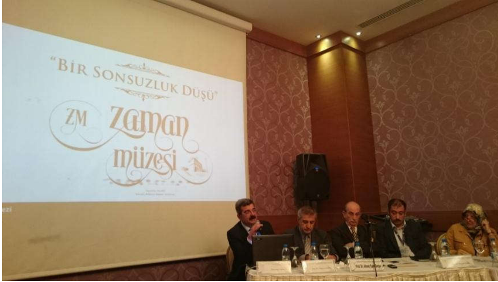
10 Ekim 2015 Cumartesi B Salonu II. Oturumu

12.10'da tamamlanan son bildiri oturumu ardından 12.35'te genel değerlendirme oturumuna geçildi.