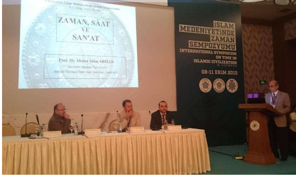
9 Ekim 2015 Cuma A Salonu III. Oturumu