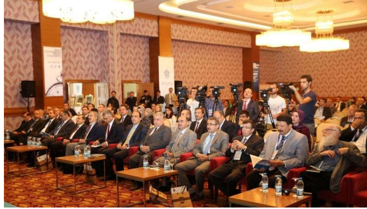
Sempozyum açılış oturumundan.

Sempozyum, iki ayrı salonda -açılış konferansı hariç- toplam 24 oturumda gerçekleştirildi. Türkiye ile beraber 14 ülkeden katılım sağlandı. 70 yerli, 21 yabancı bilim adamı bildirilerini sundular.