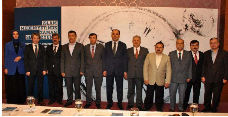
Sempozyum tanıtım basın toplantısından.

Sempozyum, iki ayrı salonda -açılış konferansı hariç- toplam 24 oturumda gerçekleştirildi. Türkiye ile beraber 14 ülkeden katılım sağlandı. 70 yerli, 21 yabancı bilim adamı bildirilerini sundular.