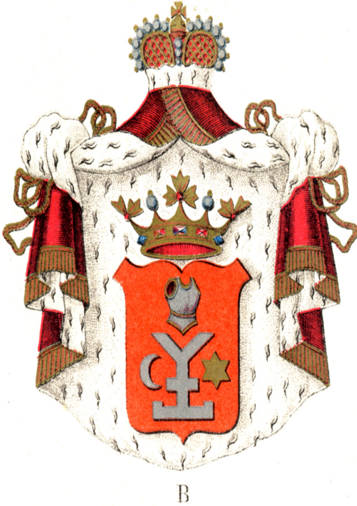
EK 1: Mazepa'nın Arması: Veliçko Samiylo, "Litopis", Kiyiv: Klio, 2020.