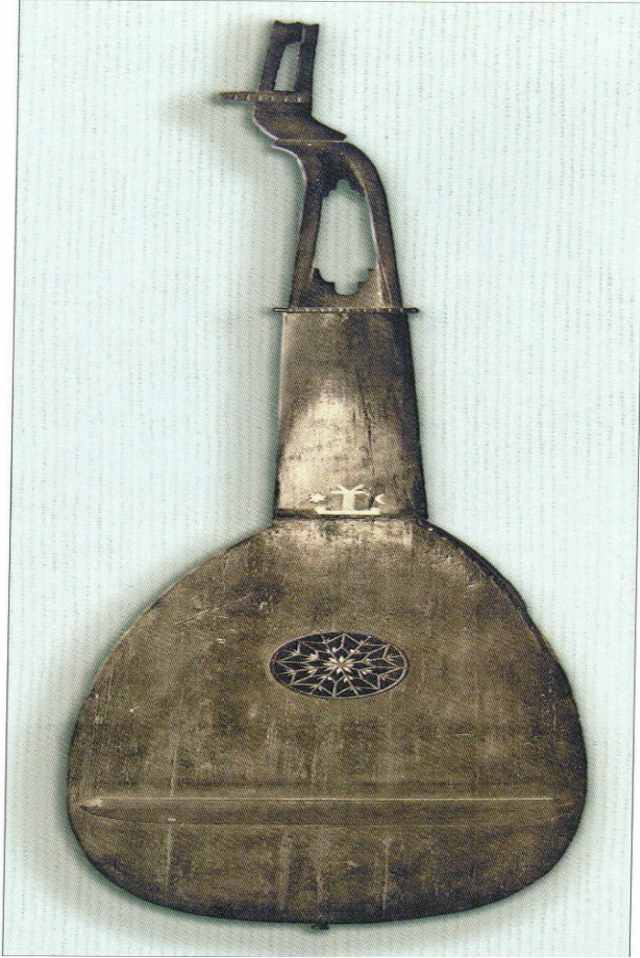
EK 3: Mazepa'nın şahsi torbanı: Veličko Samiylo, "Litopis", Kiyiv: Klio, 2020.