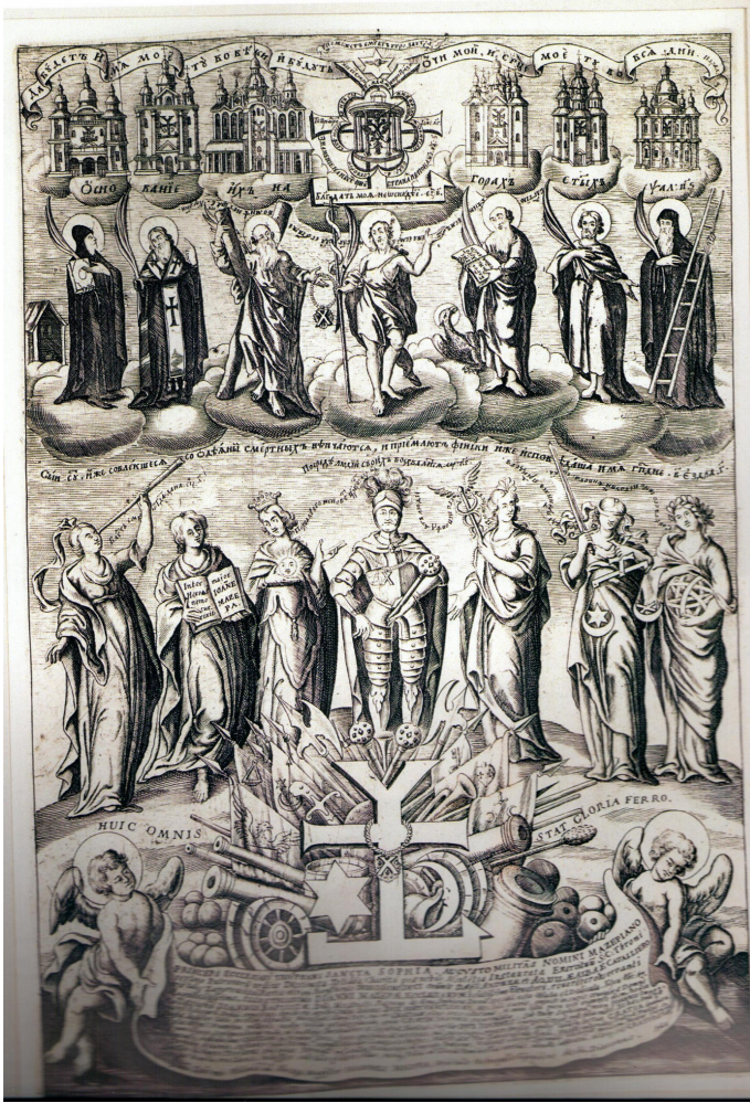
EK 2: Mazepa'nın şerefine gravüre çizilen methiye: Veličko Samiylo, "Litopis", Kiyiv: Klio, 2020.