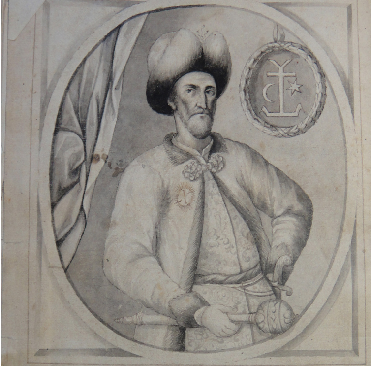
EK 4: Mazepa'nın portresi: Veliçko Samiylo, "Litopis", Kiyiv: Klio, 2020.