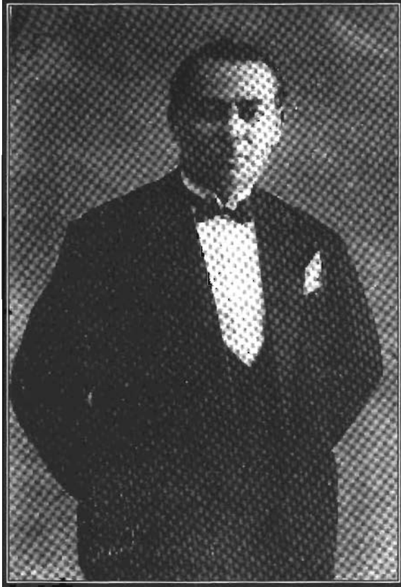
BAHA SAİT BEY