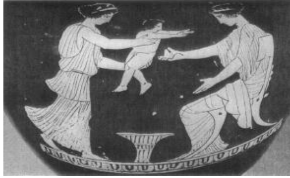
Res. 2: MÖ 450, Çocuğu annesine uzatan bakıcı kadın (Fantham vd. 1994, 105, fig. 3.19)