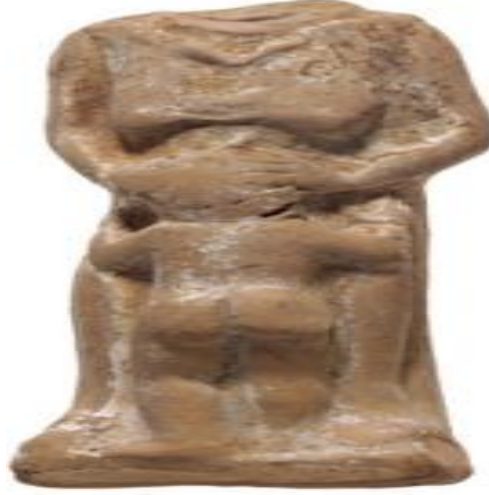
Res. 4: MÖ 4. yy. Çocuk ve bakıcısı (Rotroff-Lamberton 2005, 39, p 214)