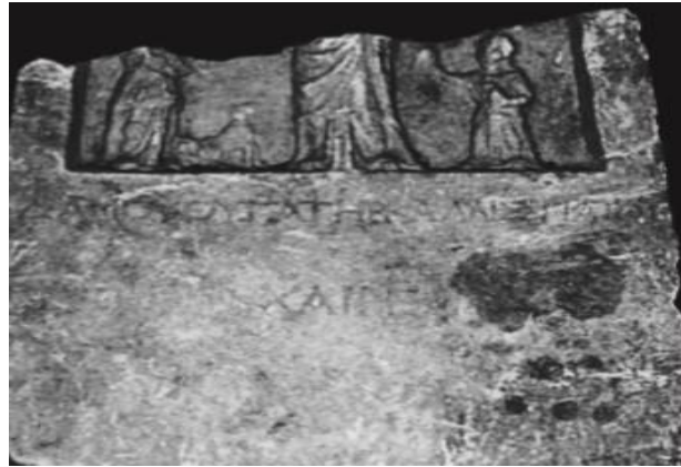
Res. 6: MÖ 1. yy. Damous adlı bir kızın mezar steli ve evcil hayvanı (Lafli-Christof 2015, 128)