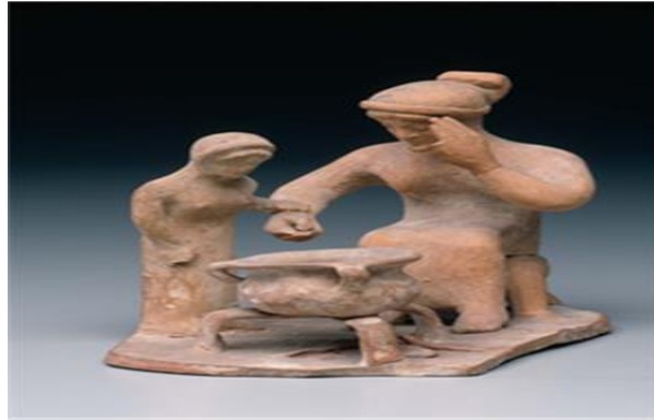
Res. 3: MÖ 6. yy. sonları, Boiotia, Bir terrakota figürinde bir kadının kız çocuk ile yemek pişirme sahnesi (Güzel Sanatlar Müzesi Boston) (Oakley 2013, 150)