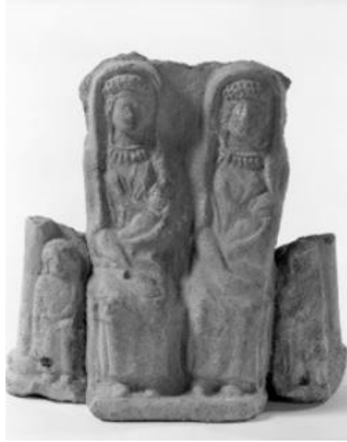
Res. 5: MÖ 3. yy. Bir adak heykeli üzerinde bebekleri emziren sütanneler tasviri, Roma-Caere (Nagy 1988, 234, fig. 240; Pedrucci 2020b, 152, fig. 8)