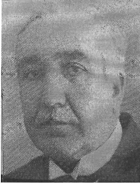
ALİ HAYDAR YULUĞ

TBMM III.DÖNEM İSTANBUL MİLLETVEKİLİ (21930)