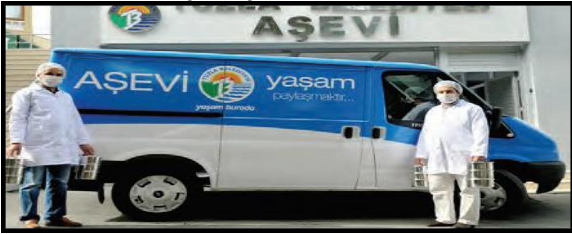
Görsel 1: Yardımseverlik Değeri ile İlgili Görsel

Ders kitabı sayfa 12'de yer alan Görsel 1.de Sosyal Bilgiler Öğretim Programında yer alan temel değerlerden "duyarlılık, dayanışma, yardımseverlik ve sorumluluk" değerlerinin vurgulandığı söylenebilir.