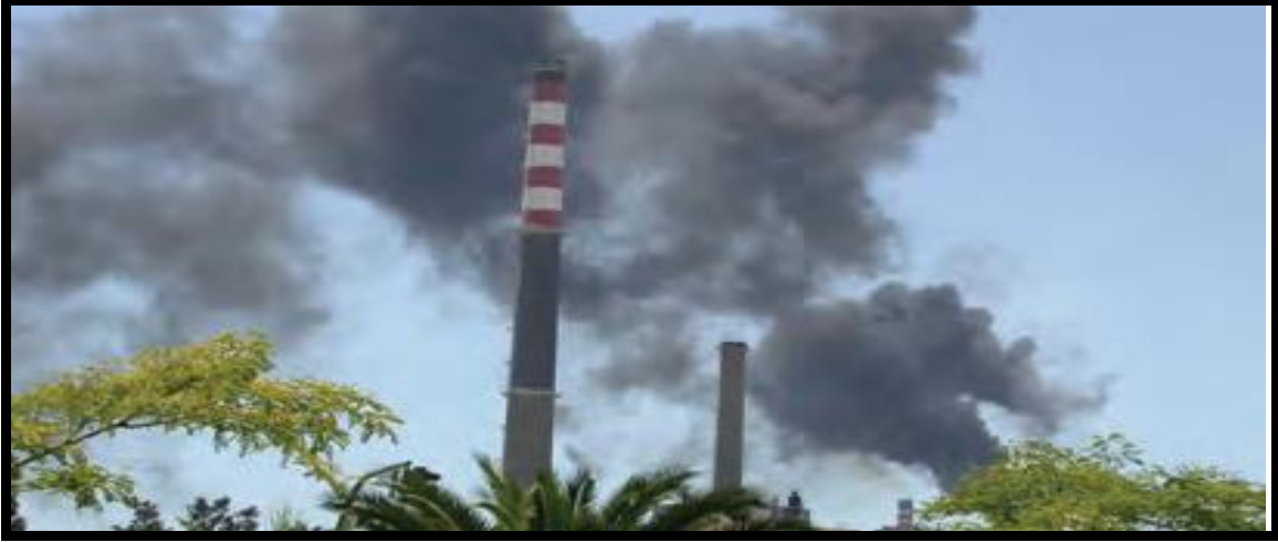
Görsel 2: Duyarlılık ve Sorumluluk Değeri ile İlgili Görsel

Sayfa 84'te yer alan Görsel 2.de Sosyal Bilgiler Öğretim Programında yer alan temel değerlerden "duyarlılık, sevgi, saygı, sorumluluk" değerlerinin vurgulandığı söylenebilir.