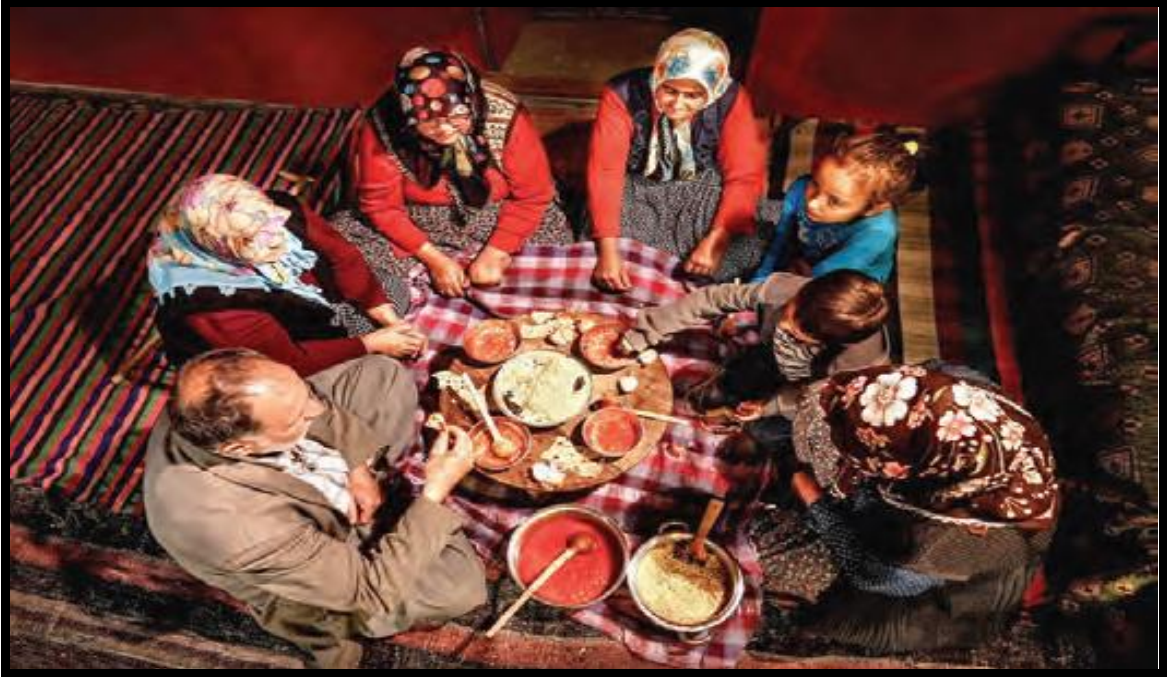
Görsel 3: Dayanışma, Aile Birliğine Önem Verme, Sevgi- Saygı Değerleri ile İlgili Görsel

Sayfa 56'da yer alan Görsel 3.te Sosyal Bilgiler Öğretim Programında yer alan temel değerlerden "aile birliğine önem verme, duyarlılık, sorumluluk, dayanışma, sevgi, saygı, yardımseverlik" değerlerinin vurgulandığı söylenebilir.