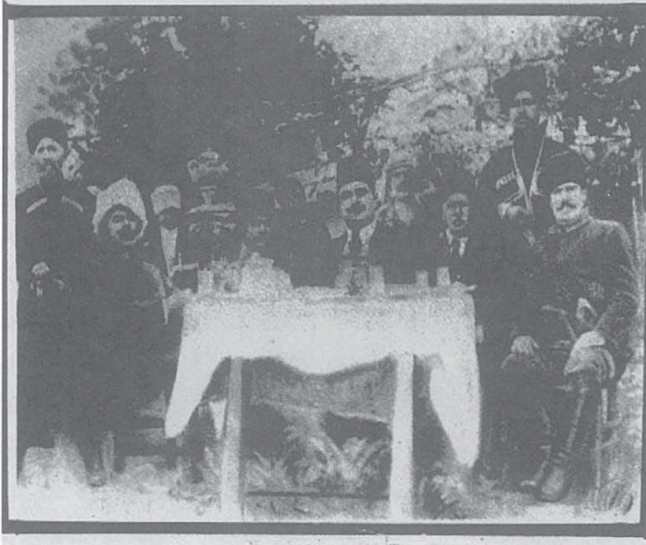
Binbaşı Rüştü (Kobaş) II.Düzce Ayaklanması Sırasında Ağustos