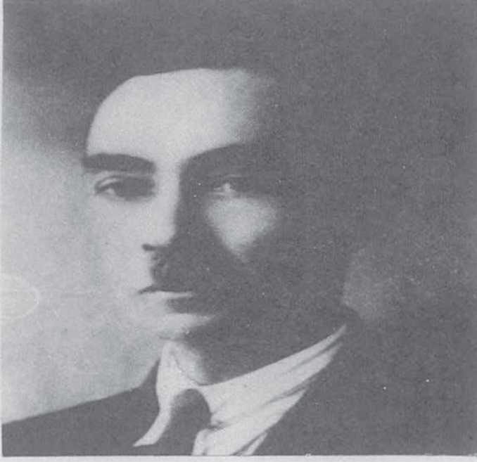
BOLU MUTASARRIFI HALİL (TÜRKMEN)