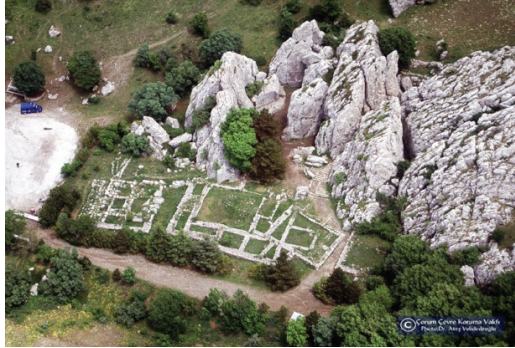
Res.8 Yazılıkaya Açıkhava Mabedinin havadan görünümü