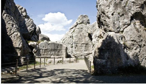
Res.11 Yazılıkaya Açık hava Mabedi A Odası (Çorum Müze Arşivi)