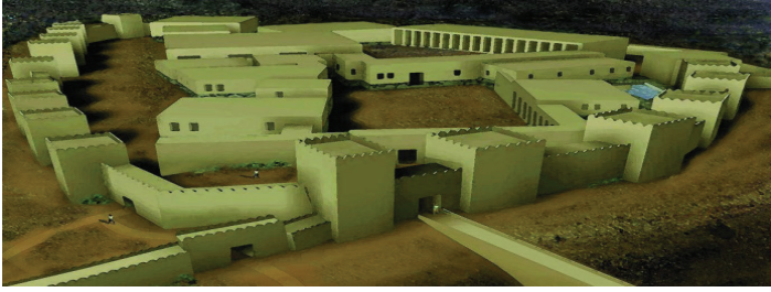
Res.7 Hattuša/Büyükkale