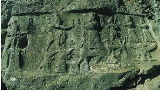
Res.12 Yazılıkaya Ana sahne. (A Odası)