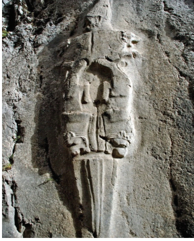
Res.13 Yeraltı Tanrısı Nergal (Yazılıkaya, B Odası)