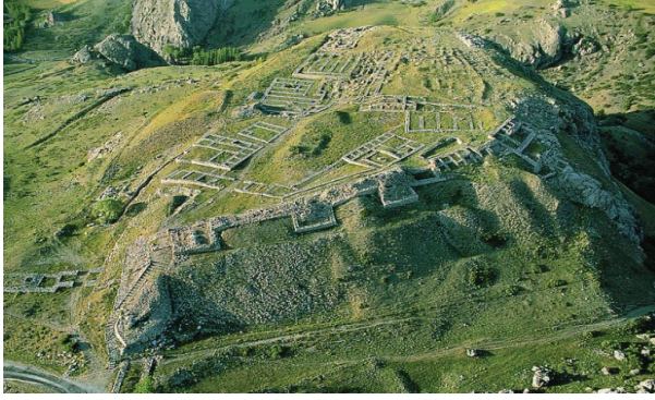
Res. 6 Büyükkale'nin Rekonstrüksiyonu.