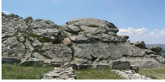
Res. 1 Boğazkale/Nişantaş