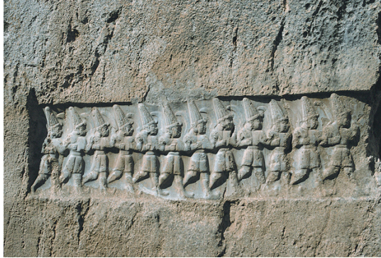
Res. 5 Yazılıkaya B Odası/ On iki Tanrı Kabartması

II. Murşili yıllıklarında purilli bayramının Tanrıça Lelwani için hešta evinde kutladığını ifade etmektedir: “İlkbahar olduğunda büyük bayram olan