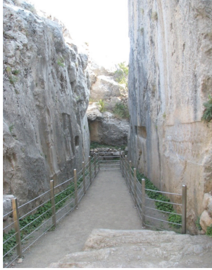
Res.4 Yazılıkaya B Odası

ödeyerek bu dünyaya girişi sembolize ediyordu (Bittel, 1978-1980: 21-28.; Darga, 1992: 171). Sevinç-Erbaşı'ya göre “ Yeraltı Tanrıları deyince, çukurdan sonra ilk akla gelen şey, bu çukuru açmak için kara toprağın bağrına saplanan, tanrılaşmış ya da tanrı simgesi olan sivri uçlu bir kılıç ya da hançerdir. ” (Bu ve daha fazla bilgi için bkz. Sevinç-Erbaşı, 2015:183 vd). Diğer taraftan Güterbock, Yazılıkaya ve Büyükkaya'nın benzer özelliklerine işaret etmiş ve hešta evi için aday iki uygun yer olabileceklerine dikkat çekmiştir (Güterbock, 1953: 76, dip. 2).