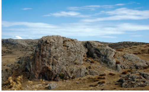
Res.2 Boğazkale /Sarıkale