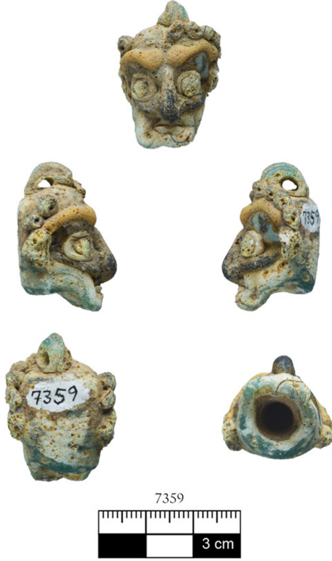
Resim 3. Tenedos nekropolisi (1993-PM.3), baş formu cam pendent.