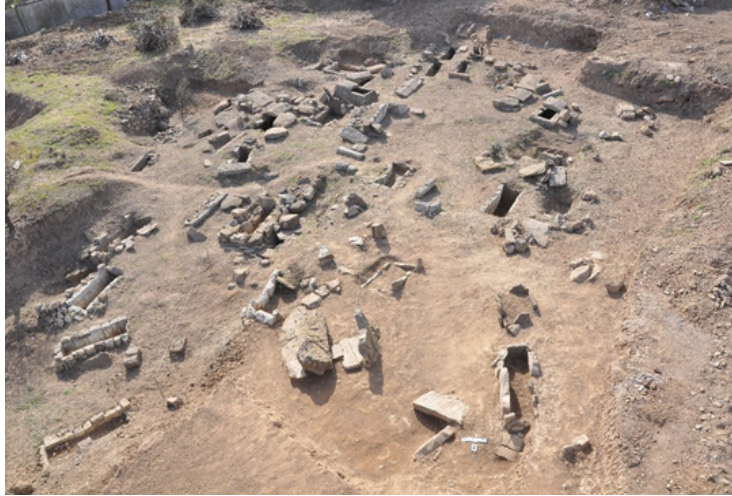
Resim 2. 2017 yılı kurtarma kazısı sonrasında Tenedos nekropolisindeki mezarların görünümü.