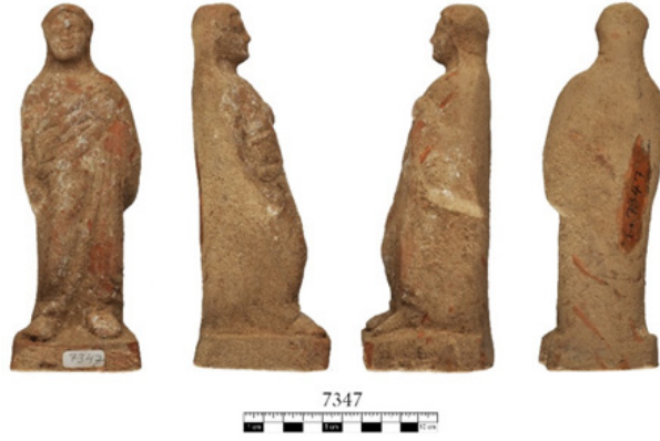
Resim 5. Tenedos nekropolisi (1993-PM.3), ayakta duran kadın figürini.