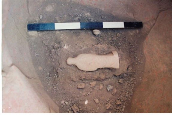
Resim 4. Tenedos nekropolisi, 1993, pithos (PM.3) mezar.