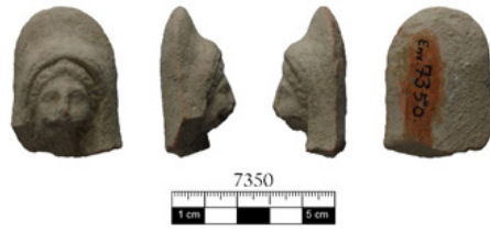
Resim 6. Tenedos nekropolisi (1993-PM.3), baş/protom parçası.