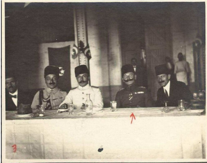
Ek 6: Emanuel von Hoff ve Osmanlı Subayları