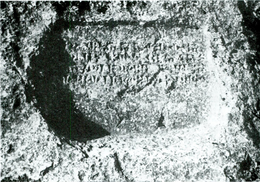
Abb. 1 — Van Kalesi. Felsnische mit Inschrift von Menua.