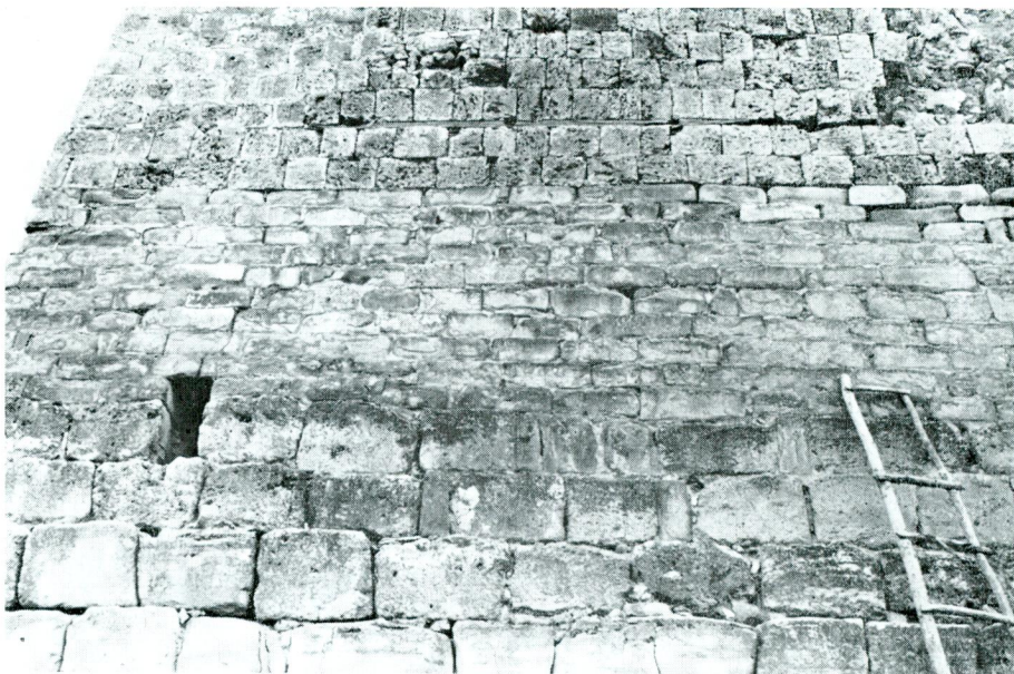
Abb. 4 — Van Kalesi. Die Zitadelle. Detailaufnahme der Bauschicht mit den beschrifteten Steinen.