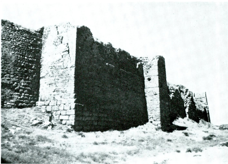
Abb. 3 — Van Kalesi. Die urartäische Zitadelle.