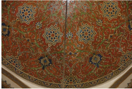
Şekil 4: Huzûr-ı Pîr Kubbe Kalemişi Tezyinâtı Detayı

c) Kubbe eteğindeki geniş bordür çizimi bozuk olmakla birlikte 16. yüzyıl üslubunu yansıtan biçimde tasarlanmıştır (Şekil 4).