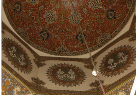
Şekil 5: Huzûr-ı Pir Kubbe Kasnağı Kalemîşi Tezyinâtı

Kubbe kasnağı oldukça yüksek biçimde inşa edilmiştir. Kasnağın alt ve üst kısımlarında geçmelerden oluşturulmuş geniş bordür tasarımı vardır. Kasnağın kırılma noktalarında alt ve üst karşılıklı tuğ motifleri yer alır. Başlık tarzında uygulanmış olan bu formların içerisinde dendanlı rûmîler ve 18. yüzyılın hatâî motifleri bulunmaktadır. Kubbe kasnağının merkezinde ise iri şemse formları yer almaktadır. Şemsenin merkezinde müsennâ istifler ve yazının zemininde \frac{1}{2} simetrisinde yeşil ve turuncu renkli rûmî motifli bir tasarım görülmektedir (Şekil 5).