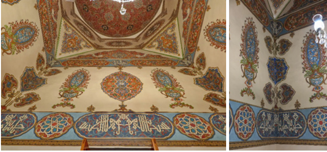
Şekil 8: Huzûr-ı Pîr Duvar Yüzeyi Kalemîşi Tezyînâtı

Türbe mimarisinin bu birimlerinin hemen alt kısmı yani kubbe duvarlarının üst kısmında dört cephe yüzeyini kuşatan bir tasarım mevcuttur. Mavi zemin üzerine kartuş formları ve kartuşlar arasına da dairevi formlar birbirleri ile bağlantılı şekilde duvarın üst kısmını kuşatmaktadır. Kartuşlar arasındaki dairevi formların içerisinde rûmî motifli zemin üzerinde kûfî istifli “Yâ Sübhan, ey her türlü eksiklikten sonsuz derecede yüce olan Allah”, köşelerde ise müsennâ “Yâ Hü” yazıları bulunmaktadır. Kartuşların tasarımında turuncu zemin üzerine ½ simetrisinde rûmî ve hatâî motiflerden müteşekkil desen kullanılmıştır.