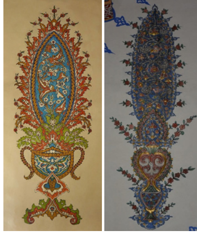
Şekil 9: Huzûr-ı Pîr ve Cem Sultan Türbesi Duvar Yüzeyi Saksılı Buket Kalemişi Tezyînâtı

Saksı veya vazo diye nitelendirilen formların arasında iri, dendanlı, oval şemse formlarının kullanıldığını görülmektedir. Klasik Osmanlı üslubunda oluşturulan bu şemse formları doğu, batı ve kuzey duvar yüzeylerinde görülmektedir. Şemselerin salbekleri, duvar yüzeyinin alt ve üst kısmındaki kartuşlu kuşaklara bitleştirilmiştir. Şemse formu; \frac{1}{4} simetrisinde merkezde kademeli renklendirilmiş iç bünyeli rûmîlerle oluşturulan kapalı form ve bunun dışında kalan kısımlara hatâî motiflerinin uygulandığı bir tasarıma sahiptir. Formun dendanlı dış pervazı sarı, mavi ve beyaz ile renklendirilirken dönem özelliği olarak düğümler yapılmıştır. Bu tasarımlarda her ne kadar dönem anlayışı aksettirilmeye çalışılmış olursa da oldukça sadedir. Edirne ve Bursa yapılarında dikkat çeken fantastik özellikler yoktur.