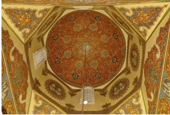
Şekil 3: Huzûr-ı Pîr Kubbe Kalemişi Tezyînâtı

Kubbeyi tamamen kaplayan tezyînâtı detaylı biçimde incelediğimizde sekiz dilimli bir tasarıma sahip olduğunu görülmektedir. Türbenin kubbe tezyînâtının sıvama nakışlı oluşu da Bursa Muradiye Türbeleri ve Hz. Mevlânâ Kubbe-i Hadrâ örneklerinde olduğu gibi yine II. Bâyezid Devri'nde yapılan kalemişleri ile birlik sağlamaktadır. Bu bölümde iç mekândaki tasarımı detaylandırabilmek için kubbe merkezinden başlamak suretiyle, kubbe eteğine doğru bir sıralama ile değerlendirmede bulunulacaktır (Şekil 3).