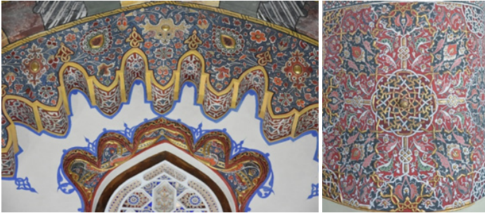
Şekil 10: Bursa Cem Sultan Türbesi ve Konya Mevlânâ Türbesi Kalemişi Tezyînâtı Motif Detayları

Bu alanda uygulanan diğer nakışlar yapının köşelerindeki üst üste sıralı üç simetrik desenlerdir. Kompozisyonun merkezinde 1/10 dilimli şemse formu yer alır. Form, yalın rûmîler ve hatâî motiflerinden müteşekkildir. Mavi ana zemin üzerine turuncu ile renk ayrımları yapılmıştır. Ancak tasarımı meydana getiren motifler özgün ve sistematik değildir. Bu dairevi şemse formunun alt ve üst kısımlarında sağ ve sol taraflara dönük başlık formu biçiminde yine rûmî, hatâî motiflerinin uygulandığı nakışlar bulunmaktadır. Bir nevi salbek düşüncesi ile yapılan bu tasarımın birbirine olan bağlantıları düğümlerle sağlanmıştır. Söz konusu bu düğüm motifleri, dönem yapılarında görülür ve devrin tezyînât anlayışını yansıtmaları bakımından önemlidir (Şekil 10).