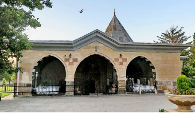
Şekil 1: Evi

Pîrevi olarak adlandırılan bölüm bünyesinde Medhal, Çilehane, Orta Medhal, Mescid, Kırklar Meydanı, Hazire, Güvenç Abdal Türbesi ve Hacı Bektaş Velî'nin Türbesi'ni barındıran ve 13.-16. yüzyıllar arasında peyderpey inşa edilen yapılar topluluğudur (Şekil 1). Pîrevi'ne giriş, bordürlerindeki tezyînâttan anlaşılacağı üzere 14. yüzyılın başlarına veya ilk yarısına ait olduğu tahmin edilen müzeyyen taç kapıdan sağlanmaktadır. Bütünüyle beyaz mermerden biçimlendirilmiş olan taç kapının üst kısımlarındaki desenlerde eksikliklerin varlığı dikkat çekmektedir. Bu husus Tanman'a göre "taçkapıda bir inşâî zorlamanın olduğu ve nedeninin ise muhtemelen Kırklar Meydanı'nın inşa edildiği H. 960 / M. 1553 yılındaki tâdilât sırasında taçkapının üstten kesilerek önündeki ahşap tavanın yüksekliğine uydurulmuş olmasından kaynaklanmaktadır" (Tanman, 1996, 459-471; Akok, 1968, 34).