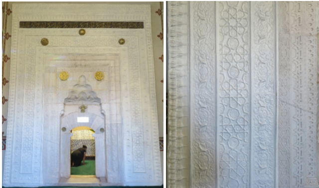
Şekil 2: Huzur-ı Pîr Girişi, Mermer Taç Kapı ve Tezyînat Detayı

Hacı Bektaş Veli'nin türbesine Kırklar Meydanı'na açılan, müzeyyen mermer bir taç kapıdan ve "Gök Eşik" adı ile bilinen mermer eşikten geçilerek girilmektedir. Giriş kapısının çevresinde mermer ve alçı olmak üzere iki tür malzemeden imal edilmiş bordür tezyînat bulunmaktadır (Gürses, 1964, 66-67). Mermer kapının orijinal malzemesi olup Selçuklu üslubunda rûmî, saç örgüsü, kırık çizgiler ve geçme motiflerle tezyin edilmiştir. Mermer bordürlerin hemen dışında kapıyı çevreleyen dört adet bordür ve en üstte taç kısmı alçı malzeme olup üzerine geometrik, mukarnas, rûmî, hatâî motifler uygulanmıştır. Bu tasarımlar Beylik Devri özelliklerini taşımaktadır. Alçı ile oluşturulan bu kısmın kapı üzerine tekabül eden bölümünde üç adet kabara ve bir kitabe bulunmaktadır. Kapının üst kısmında celi sülüs ile "el Hayy, el Kayyûm, el Vâhid, el Mâcid, el Vâhid, el Ehad" istifi sekiz defa mükerrer şekilde yazılmıştır (Şekil 2). Türbenin H.1019 / M.1610-11 tarihli Gümüş Kapısı 1925 tarihindeki kapatılma esnasında Ankara Etnografya Müzesine taşınmış (Noyan, 1964, 46) ancak daha sonra dergâha iade edilmiştir. Kapı şu anda Kırklar Meydanı'nda teşhir amacıyla değerlendirilmektedir.