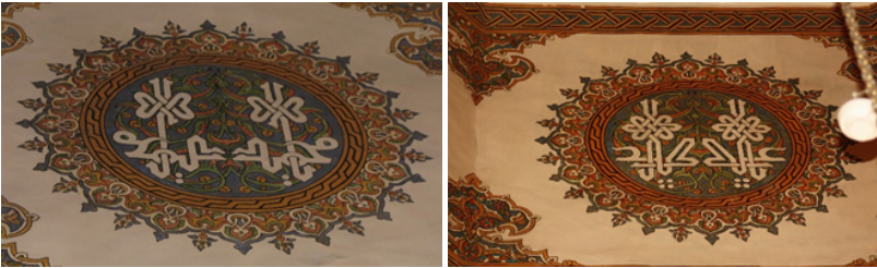
Şekil 6: Huzûr-ı Pir Kubbe Kasnağı Müdevver Şemse Formu Kalemîşi Tezyinâtı ve Müsennâ İstifli Kûfî Yazı

Şemsenin dış kısmını 15. yüzyılın tezyinât üslubuna benzetilmeye çalışılmış dendanlı bir bordür çevrelemiştir. Sekiz köşeli kubbe kasnağının üç tarafında doğu, batı ve güney yönlerinde pencere bulunduğu için tasarım kubbe kasnağının diğer beş cephesinde kullanılmıştır. Bununla birlikte şemse formlarının iç kısımlarındaki kûfî hat ile istiflenmiş dört defa “Yâ Muhammed” bir defa “Yâ Ali” yazıları okunmaktadır. “Yâ Muhammed” istifleri ara yönlerde, “Yâ Ali” istifi ise kuzey yönde, giriş kapısının üst kısmına tekabül etmektedir. Yazılarda da geçme motifleri kullanılmış, örgülü kûfî tarzında istiflenmiştir (Şekil 6).