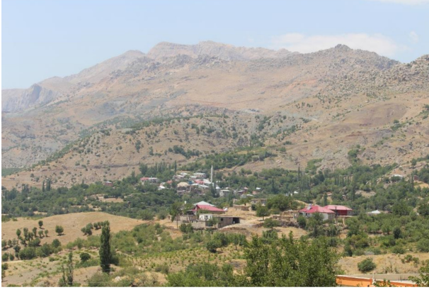
Fotoğraf 2. Yeşilyurt Köyü (Temmuz 2016). Photo 2. Yesilyurt Village (July 2016).

geçen yol boyunca uzanış göstermiştir. Köyün güneyi ise tamamen tarımsal arazilere ayrılmış bulunmaktadır (Fotoğraf 2).