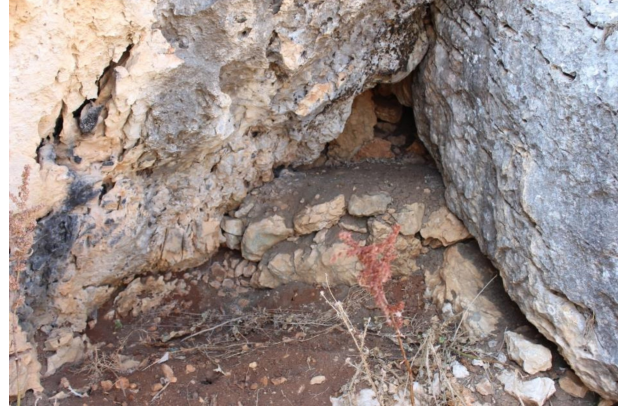
Fotoğraf 6. Kaya oyuğunda oluşturulmuş Hol bölümü. Photo 6. A Hol compartment generated in rock hollow

Tepelik alandan bağımsız olarak inşa edilen meskenler ise yine tek bölmeden oluştuğu gibi iki bölmeli de olabilmektedir. Bu bölmelerden büyüğü mesken sahiplerinin yaşam alanı olarak kullanılırken, diğer bölme mutfak, kiler veya hayvanların barınması amacıyla kullanılabilir.