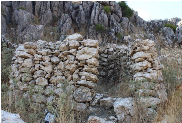
Fotoğraf 5. Kayalık sahadan bağımsız olarak oluşturulmuş dairevi bir Hol. Photo 5. A circular Hol seperated from rocky field.

Tepelik alandan faydalanılarak oluşturulmuş olan meskenler genellikle tek bölmelik olurken, konumlanmış olduğu girinti ve oyukun büyüklüğüne ve şekline göre, iç düzeninde farklı bölmeler teşkil ettirilebilmektedir. Küçük oyuk sahasının her bir kısmı farklı amaçlarla kullanılmakta ve adeta bir evin odaları gibi fonksiyonel olarak organize edilmiş bulunmaktadır (Fotoğraf 6).