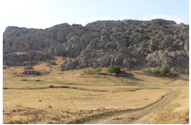
Fotoğraf 3. Avacık yaylasında meskenlerin konumlandığı tepelik saha (Temmuz 2016). Photo 3. Hilly fields that dwellings are located in Avacık yaylası (July 2016).

Yayla sahasının neredeyse tüm çevresi belirtilen türde bir topografik üniteyle çevrili olmasına karşın, meskenler sahanın Kuzeydoğu kesiminde toplu halde konumlanmışlardır. Bu durumun oluşmasında, elverişli topografik faktörler önemli rol oynasa da, birlikte olma, bu yolla güven içinde hissetme ve yardımlaşma gibi beşeri faktörlerin etkisi de göz ardı edilmemelidir.