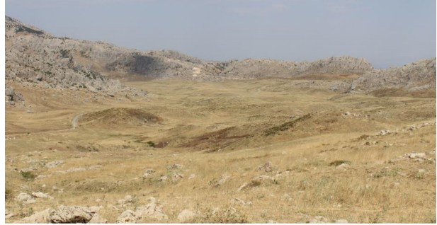
Fotoğraf 1. Avacık yayla sahası genel topografik görünümünü (Temmuz 2016). Photo 1. General topographic view of Avacık yaylası (July 2016).

lardan oluşmakta, eğim değerlerinin fazlalığı ise her türlü tarımsal üretimin gerçekleştirilmesine engel teşkil etmektedir. Tarımsal üretime ilişkin kısıtlar hayvancılık faaliyetini öne çıkarmakta, bu durum yakın çevrede bulunan çayırlardan maksimum verimi sağlamayı gerekli kılmaktadır. Yörede yaylacılık, bu faaliyete katılan köylerin hemen kuzeyinde yer alan ve yükseltisi 1700-1900 m. arasında değişen çayır sahalarında gerçekleştirilmektedir.