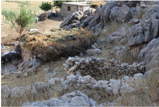
Fotoğraf 10. Avacık yaylasında Hol meskenler yerini betonarme binalara bırakmaktadır. Photo 10. Hol dwellings leave the place to reinforced concrete building, in Avacık yaylası.

Yaylanın geçmişte kullanım yoğunluğunu açık bir şekilde ortaya koyan 40'ın üzerinde mesken bakiyesi izlenirken (Fotoğraf 11), 2016 yılında sadece bir Hol'ün kullanılmakta olması bu meskenlerin akıbeti hakkında fikir vermektedir. Geline aşama ve yaşanan süreç, hem Kurdek yaylasında ve hem de Avacık yaylasında geleneksel meskenler olan kıl çadır ve Hol meskenlerin