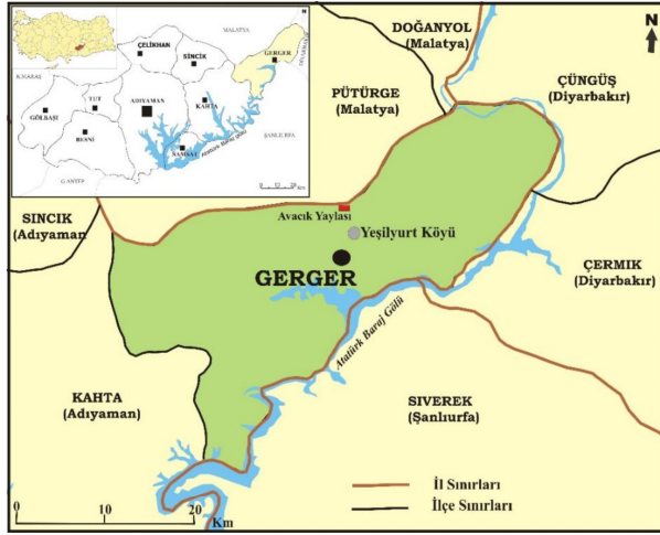
Şekil 1. Avacık yaylası lokasyon haritası. Figure 1. Location map of Avacık yaylası.

denizden 1600-1700 m yükseklikte yer almakta ve adeta küçük bir ova görünümüne sahip bulunmaktadır (Şekil 2).