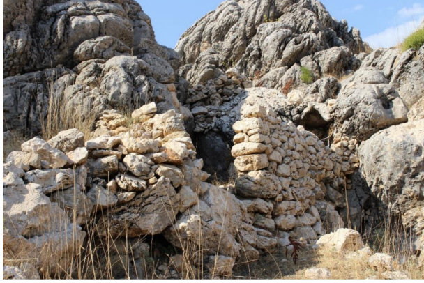
Fotoğraf 4. Kayalık saha mesken inşası için elverişli şartlar sağlar (Temmuz 2016). Photo 4. The rocky field ensures creating favorable conditions for dwellings (July 2016).

duğu girinti ve küçük oyukların barınma amaçlı olarak yeniden düzenlenmesiyle oluşturulmuş meskenlerdir. Bu yolla mevcut oyuk ve girintilerin çevresi yine yakın çevreden sağlanan taşlarla örülmekte, üstü ise yörenin yaygın doğal bitki örtüsü durumunda olan meşelerin dal ve yapraklarıyla kapatılarak barınmaya uygun hale getirilmektedir (Fotoğraf 4).