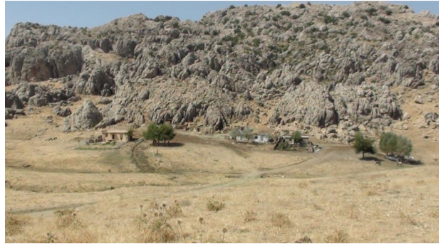
Fotoğraf 12. Avacık yaylasında betonarme meskenler (Eylül 2013). Photo 12. Concrete dwellings in Avacık yaylası (September 2013).

Avacık yaylasında yeni meskenlerin de geleneksel yayla meskenlerinin konumlandığı sahada toplu bir şekilde inşa edildiği izlenmektedir. Yayla sahasında hâlihazırda mesken sayısının çok küçük ölçekte kalmasının temel nedeni, yaylanın bu kesiminin sadece Yeşilyurt köyü sakinleri tarafından kullanılmasıdır. Buna karşın Avacık yaylasında yeni mesken yapımının hızla devam ettiği gözlenmektedir. Yaylada 2008 yılında inşa edilmiş olan üç mesken bulunurken, 2016 yılında bu sayı 5'e çıkmıştır (Fotoğraf 12 ve Fotoğraf 13).