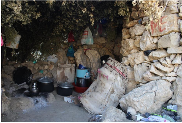
Fotoğraf 9. Hol meskeninin ikinci bölümü. Photo 9. Second compartment of the Hol dwelling.

Avacık yaylası meskenlerinde, hemen yakınında bulunan Kurdek yaylasına benzer bir değişim süreci yaşanmaktadır. Kurdek yaylasında geleneksel yayla meskeni olan Kıl çadırların yerini taş veya betonarme meskenler alırken, Avacık yaylasının geleneksel meskenleri olan Hol'lerin yerini ise yine betonarme binalar almaya başlamış bulunmaktadır (Fotoğraf 10).