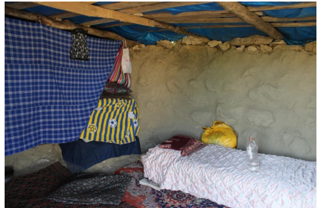
Fotoğraf 8. Hol'ün büyük bölümünün içi. Photo 8. Inside of the big part of Hol.