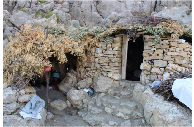
Fotoğraf 7. Avacık yaylasında 2016 yılında kullanılmakta olan iki bölmeli bir geleneksel mesken. Photo 7. A traditional dwelling with two division being used in 2016 in Avacık yaylasi.

2016 yılı Temmuz ayında arazi çalışması gerçekleştirdiğimiz Avacık yaylasında hâlihazırda kullanımda olan bir tane geleneksel mesken olduğunu gözlemledik. Sözü ettiğimiz mesken iki bölmeden oluşmaktadır (Fotoğraf 7). Bölmelerden büyük olanı insanların barınak ünitesini oluşturmakta, günlük yaşama uygun ve ihtiyaca göre düzenlenmiş bulunmaktadır. Bir bakıma yatak odası olarak düşünülebilecek olan bölmenin içinde herhangi bir ayıraç söz konusu değildir (Fotoğraf 8). Taş malzemeyle örülmüş olan mesken bölümünün iç duvarı çamurla sıvanmak suretiyle hem daha korunaklı hale getirilmiş ve hem de daha estetik bir görünüm sağlanmıştır.