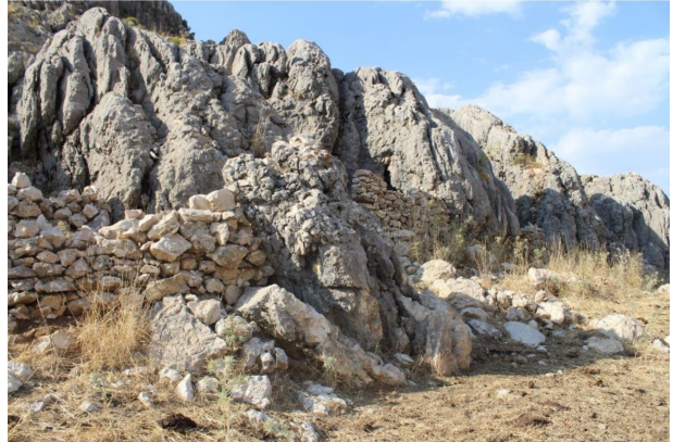
Fotoğraf 11. Avacık yaylasında çok sayıda geleneksel meskenin duvar bakiyeleri izlenebilmektedir. Photo 11. It can be observed the wall of many old traditional dwellings in Avacık yaylası.

çok yakın bir gelecekte, yöre geleneksel yaylacılığının geçmişteki simgeleri olarak tarihteki yerlerini alacaklarını göstermektedir.