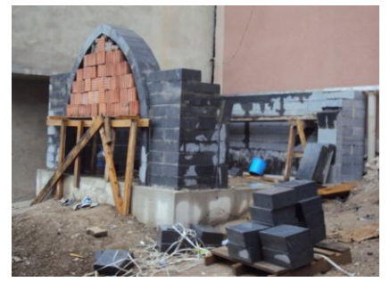
Havza İmaret Türbesi ve Ladik Ahmetsaray Köyü Seyyid Zeynel Abidin Rufai Türbesi ve Baldaken Tarzda İnşaa Edilmekte Olan Kavak Şeyh Hamza Türbesi

Baldaken tarzı türbelerin Beylikler ve Osmanlı döneminde çok sayıda örneği görülmekte olup geç dönemlere kadar sevilerek uygulandığı bilinmektedir. Plan ve form özellikleri yönünden zengin bir çeşitliliğe sahip olan Baldeken Türbelerinde genel olarak kare, dikdörtgen formlar ile altıgen ve sekizgenden oluşan çokgen plan tipleri tercih edilmiştir. Bu örnekler içerisinde dört cephesi açık olanlara rastlandığı gibi iki cephesi kapalı/sağır olan türbelere de rastlamak mümkündür. Mevcut Baldeken tarzı türbelerin çoğunda örgü tekniğinde alması sistemini tercih edildiği görülmektedir. Genel uygulama üç sıra tuğla ve bir sıra kesme taş şeklinde olup kubbede çoğunlukla tuğla tercih edilmektedir. Amasya Merkez Yörgüç Paşa, Halkalı Dede, Suluova-Yolpınar Mahallesi Seyyid Yahya, Aksaray Hırkalı