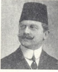
Ali Kemâl Bey (1867-1922)

İstanbul'da doğdu. Mekteb-i Mülkiyye'de okudu. 1886'da yurtdışı-na kaçarak Paris ve Cenevre'de yaşadı. Dönüşünde eğitimine kaldığı yerden devam etti ise de gizli dernek kurma teşebbüsünden dokuz ay kadar mahbus kaldı. Çıktıktan sonra, 1889'da Halep'e sürgün edildi. Beş yıl dayandıktan sonra, İstanbul'a ve oradan da Paris'e kaçtı. Orada bir yandan İkdam Gazetesi 'nin muhabirliğini yaparken, diğer yandan da Ecole Libre des Sciences Politiques'i bitirdi. Bir ara Brüksel Sefaret Kâtipliği yaptı ama, 1900'de Mısır'a geçerek çiflik yönetmeyi daha karlı bir iş bildi. 1908'de İstanbul'a döndü ve meşrûiyetten sonra Dârülfünun'da, Mekteb-i Mülkiyye'de hocalık yaptı. 31 Mart Vak'ası'nda payı olduğu iddiaları üzerine yeniden Paris'e kaçtı ve 1912'de iktidar el değiştirirince çıkarılan aff-ı umûmî'ye kadar orada yaşadı. İstanbul'a dönmüşün ardından, İttihadîlar tekrar iktidara geçince, Viyana'ya gönderilirse de kısa süre sonra İstanbul'a döndü. Mütareke yıllarında Hüriyet Ve İtilâf Fırkası'nın ilk kabinesinde Maarif Nâzırı, ikincisinde Dâhiliye Nâzırı oldu. Milli Mücadele'ye karşı olan muhalefeti sebebiyle İzmir'de linç edilerek öldürüldü.