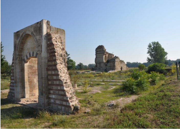
Res. 7. EYSK, Babüssaade'nin güneybatıdan görünümü