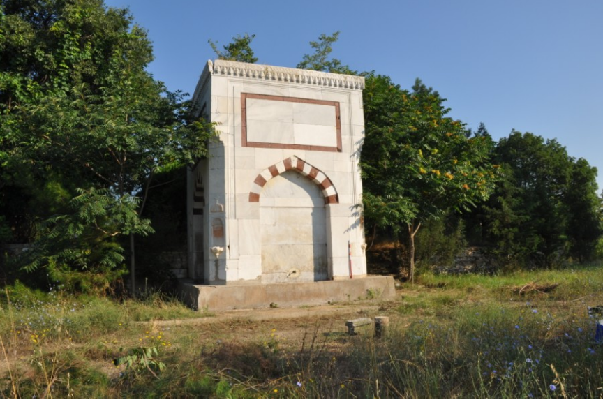
Res.1.Eysk, Namazgahlı Çeşme'nin genel görünümü.