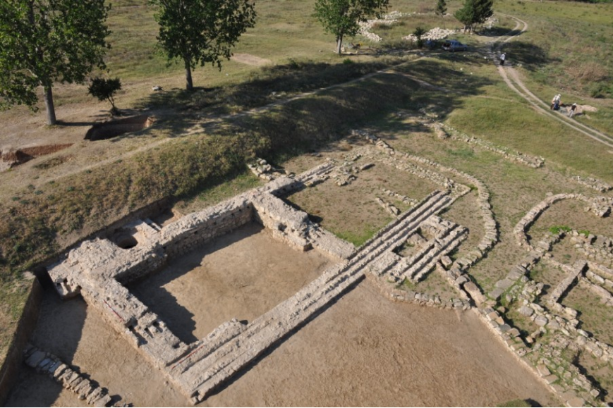
Res. 15. EYSK, Kum Kasrı ve Kum Kasrı'nın batıdan görünümü (kazı sonrası)