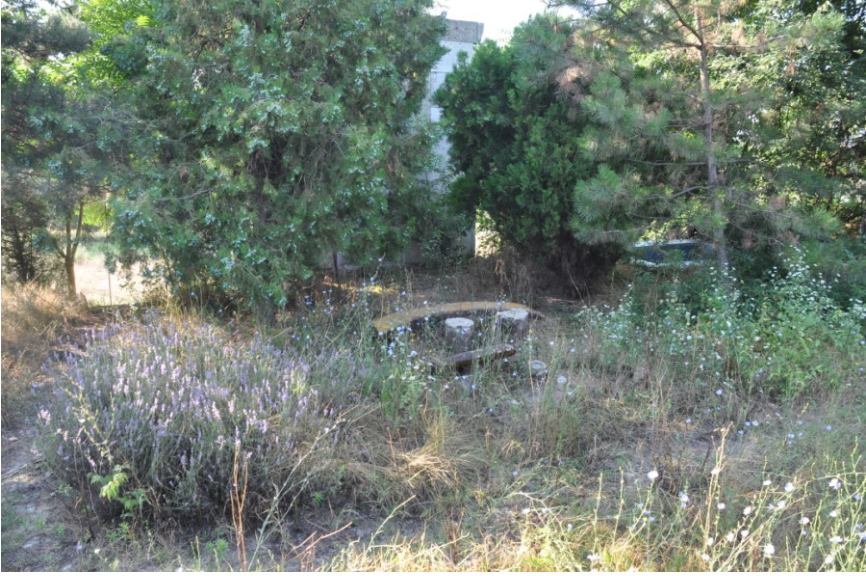
Res. 3. EYSK, Namazgahlı Çeşme'nin Namazgah bölümünün kuzeyden görünümü