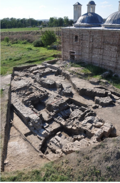
Res. 10. EYSK, Matbah-ı Amire'nin güneyinde gerçekleştirilen kazı alanının havadan görünümü (kazı sonrası).