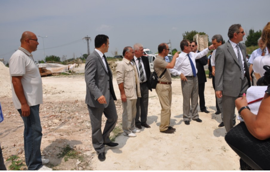
Res. 18. Kùltür ve Turizm Bakan'ının Kazı Çalıřmalarını Ziyaretleri