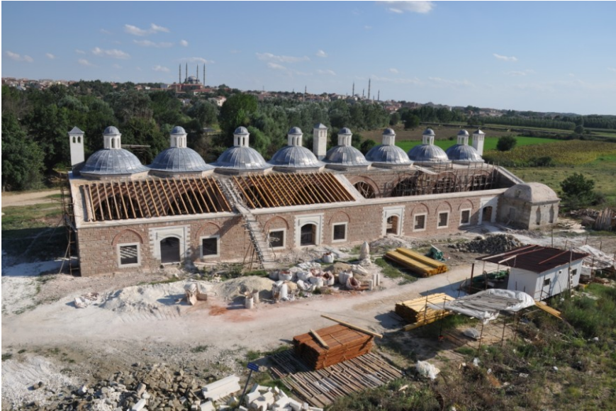
Res.9. EYSK, Matbah-ı Amire (Saray Mutfağı)( restorasyonu devam ederken)