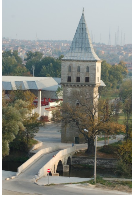
Res.6. EYSK, Adalet Kasrı'nın kuzeyden görünümü