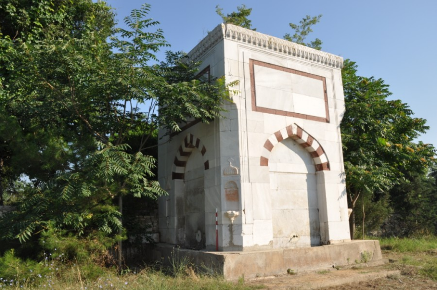
Res. 2. EYSK, Namazgahlı Çeşme'nin güneybatıdan görünümü.