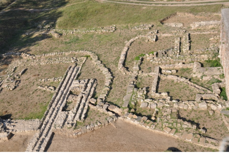
Res. 14. EYSK, Kum Kasrı ve Kum Kasrı'nın batıdan görünümü (kazı sonrası)