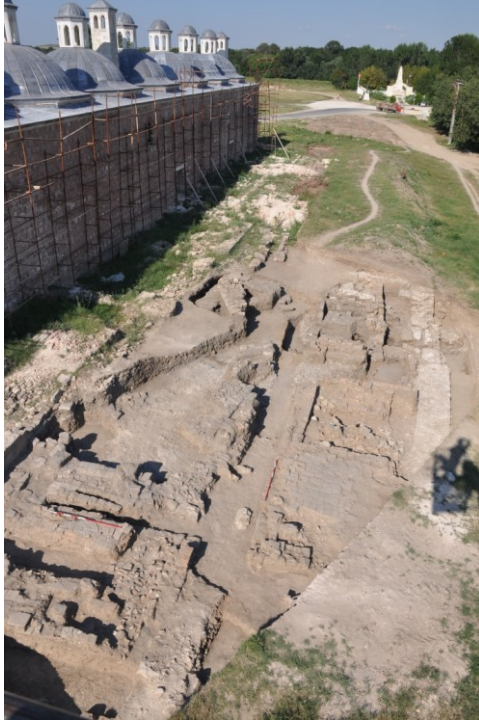
Res. 12. EYSK, Matbah-ı Amire'nin güneyinde gerçekleştirilen kazı alanının havadan bir diğer görünümü (kazı sonrası)