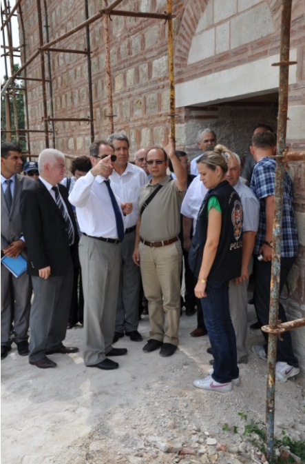
Res. 17. Kültür ve Turizm Bakanı'nın Kazı Çalışmalarını Ziyaretleri