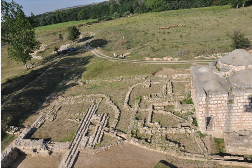
Res. 13. EYSK, Kum Kasrı ve Kum Kasrı Hamamı'nın batıdan kısmi görünümü (kazı sonrası)