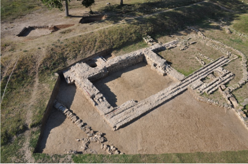
Res. 16. EYSK, Kum Kasrı ve Kum Kasrı'nın batıdan bir diğer görünümü (kazı sonrası)