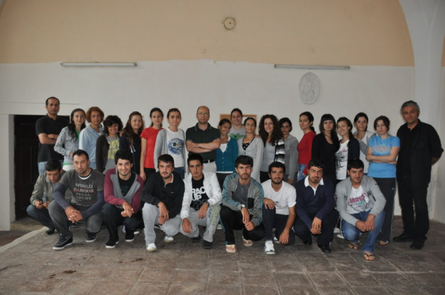
Res. 19. Edirne Sarayı Kazı Ekibi (Bir Bölümü) (2010)