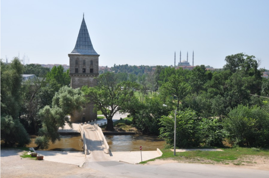
Res.4. EYSK, Adalet Kasrı'nın kuzeybatıdan görünümü