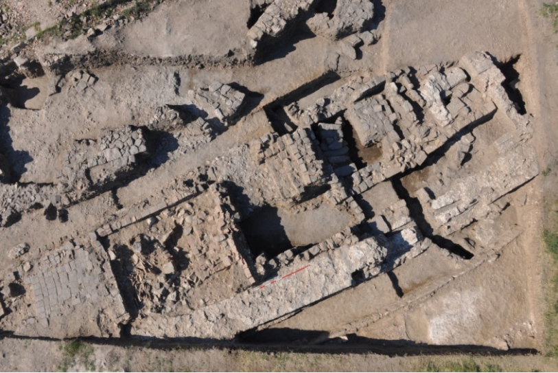
Res. 11. EYSK, Matbah-ı Amire'nin güneyinde gerçekleştirilen kazı alanının havadan bir diğer görünümü (kazı sonrası)