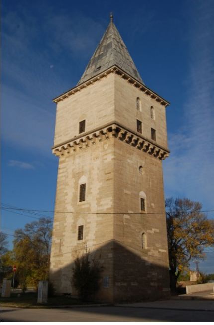
Res. 5.EYSK, Adalet Kasrı'nın güneydoğudan görünümü