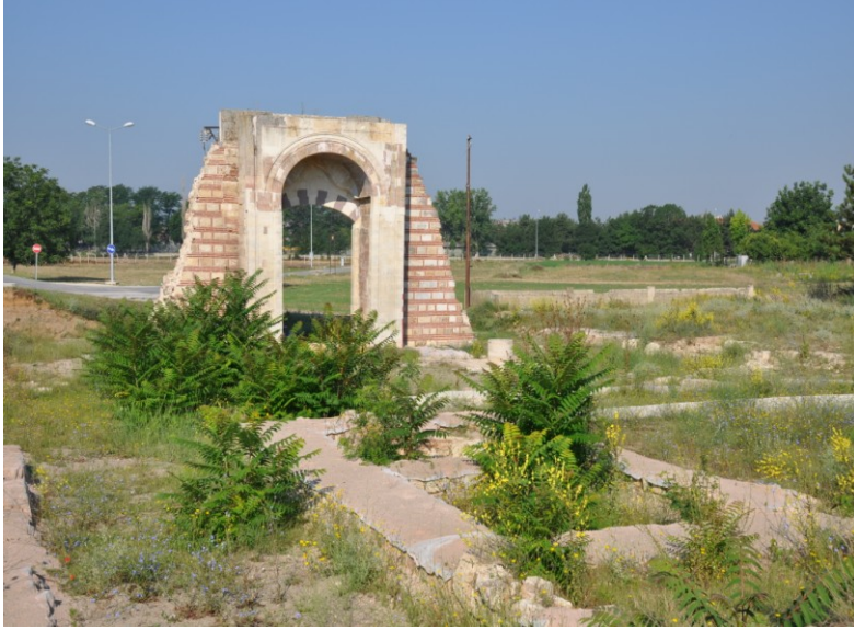
Res.8. EYSK, Babüssaade'nin doğudan görünümü