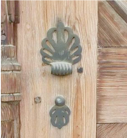
Foto. 15-a: Tabakhane Mahallesi Ağalar Sokak, No: 17. (Sağ Kapı Kanadı)