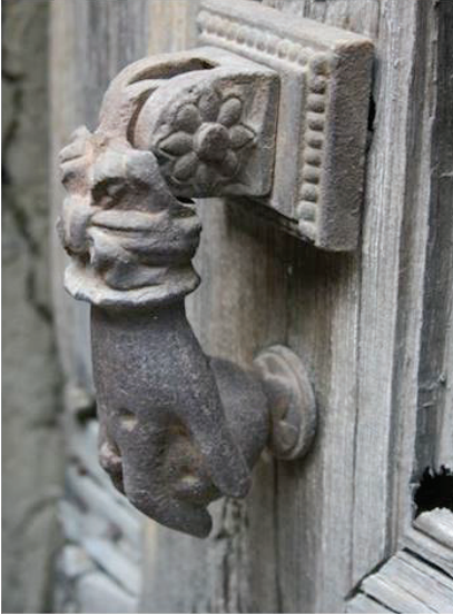
Foto. 27: A. Sait Dumanoğlu Konağı Karasait Mahallesi 348 Ada 63 Parsel Envanter No: 34 (Günümüze ulaşmamıştır)