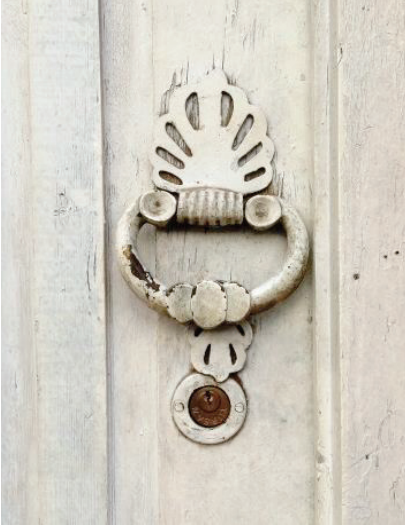
Foto. 1: Tabakhane Mahallesi, Yüzbaşı Cengiz Topel Sokak, No: 5/1.