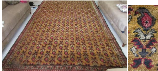
Foto 19-20: Buta Motifli Halı- Detay, İğdir, Tuzluca, Aşağı Mahalle, (Fotoğraf Esen Baydemir).