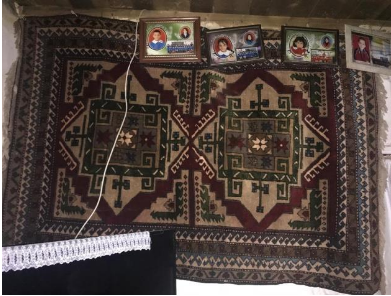
Foto 10: Halı Örneği, Kars – Sarıkamış İlçesi Alisofun köyü.

İstanbul'da bulunan ve Kars halılarını uzun yıllar toplayıp ticaretini yapan Bereket Halı firması sahibi Celalettin Vardarsuyu ile görüşülmüş, mağazada yer alan 6 adet Kars halısı fotoğraflanmıştır. Ayrıca Bereket Halı'nın Antalya Döşemealtı'nda yer alan depolarındaki Kars halılarından 57 adedinin fotoğrafına ulaşılmıştır. Celalettin Vardarsuyu ile yapılan görüşmede bu halılar hakkında bilgi edinilmiştir.