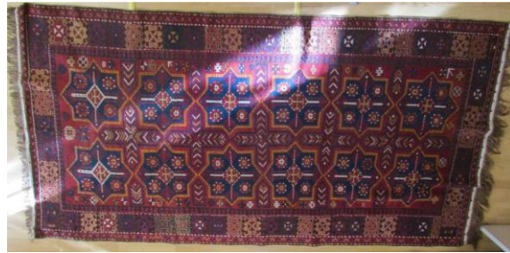
Foto 40: Kars Yıldız Halı koleksiyonu, Şirvan Halısı 20.yy, (Fotoğraf Esen Baydemir).

3.2. Lesghi Yıldız Motifli Halılar: Bazı bölgelerde Hun gülü, Türkmen Gülü olarak adlandırılan, sekizgen köşeli yıldız motifli; Kars, Bakü, Şirvan, Kafkasya bölgesinde "Lasghi Yıldızı" olarak bilinir. Şirvan halılarında yaygın şekilde görülen ve Doğu Anadolu halılarında da yer alan yıldız madalyon motiflerinin özellikle Kars ve İğdır bölgesinde sık kullanıldığı