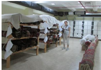
Foto 1-2: Azerbaycan Milli İncenanat Müzesi. Depo İncelemesi, Bakü, 2019.

Bap Projesi kapsamında öncelikle Bakü Azerbaycan Milli İncenanat Müzesi'ne ziyaret gerçekleştirilmiştir. Azerbaycan Milli İncenanat Müzesi'nde teşhirde olan halılar görülmüş, Müze Envanterleri incelenmiş ve tespit edilen 41 halının fotoğraflarına ulaşılmıştır. Ayrıca müze arşivinde bulunan 3 halı üzerinde inceleme yapılmıştır. Bunun dışında Bakü Halı Müzesi ziyaret edilmiş, teşhirde bulunan halılar görülmüş ve Bakü de bulunan Azer İlme Halı Atölyesi ziyaret edilmiş ve kurucusu Profesör Vidadi Muradov ile konu hakkında karşılıklı bilgi aktarımı gerçekleşmiştir.