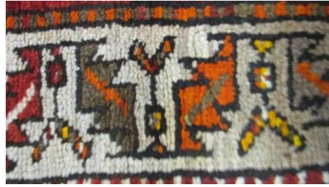
Foto 21: Kars Halısı Bordür Detayı, Sarıkamış Şehit Halit Köyü Camii, 20.yybaşı, (Fotoğraf Esen Baydemir).

1.3. Lanset Yaprak (Testere Dişli Yaprak) Motifi: Lanset yaprak motifi Kars ve Azerbaycan halılarında sık görülmektedir. Lanset yapraklı bordür deseni (Bu motife Anadolu da testere dişli yaprak motifi, çınaryapağı motifi de denmektedir.) Şirvan, Lehistan, Kazak, Milas, Balıkesir, Çanakkale- Ezine, Kars ve Kafkas halılarında bolca görülmektedir. 10 Bu desen köken olarak Kafkas bölgesine ait olmasına rağmen Anadolu'da bolca kullanılmıştır. Geniş bir coğrafyada yaygın olarak kullanılan motif Kars ve İğdır bölgesinde bulunan halıların özellikle bordürlerinde sıkça karşımıza çıkmaktadır.