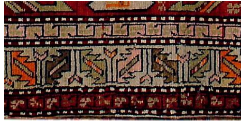
Foto 22:Env.No. T-903, Karabağ Halısı Bordür Detayı, 19. yy, Azerbaycan İnce Senet Müzesi.

1.4. Ok Motifi: Azerbaycan da “Molla başı” olarak adlandırılan motif Kafkas halılarının temel özelliğidir. Motif genel olarak halıların suyolu (sedef) denilen ince bordürlerinde kullanılmaktadır. Kars ve İğdır bölgesindeki halılarda sıkça görülmektedir. Kars bölgesinde ise genel olarak ok motifi olarak adlandırılmaktadır.