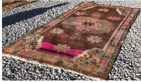
Foto 33: Kars Halısı, Bereket Halı Koleksiyonu