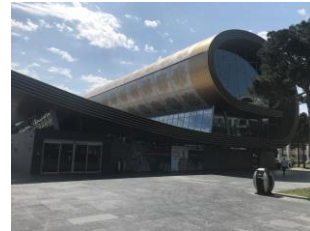
Foto 3: Azerbaycan Bakü Halı Müzesi, Bakü, (Fotoğraf Esen Baydemir).