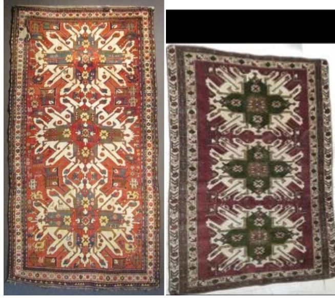
Foto 46: Çelebi Halısı, Bakü Halı Müzesi Foto 47: Kars Halısı, 19.yy Kars Müzesi

madalyonlar oluşturmaktadır. Bu madalyonlara Azerbaycan'da göl adı verilmektedir. Bu tür halılara Kars bölgesinde de sık sık rastlanmaktadır. Bölgede dokunan halıların desen özelliklerini bire-bir koruduğu tespit edilmiştir.