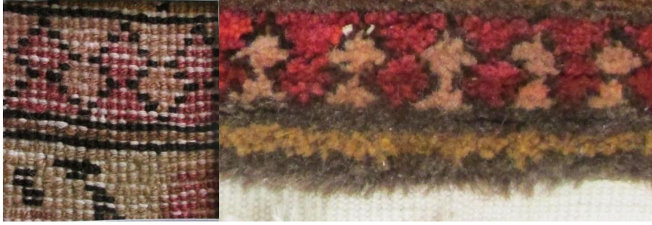
Foto 24-25: Ok Motifi, Tuzluca Buta desenli halının sırt detayı ve ön detay, (Fotoğraf Esen Baydemir).