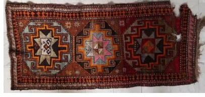
Foto 12: Ardahan-Merkez, Hasköy Camii, 20.yy'ın ilk çeyreği, Kars Etnografya ve Arkeoloji Müzesi.

1.2. Buta Motifi: Azerbaycan bölgesinde Buta motifi olarak adlandırılan ve birçok çeşidi olan motif İran'da da sık kullanılan bir motiftir. Zaten aynı motif yurdumuzda da özellikle kumaş süslemelerinde kullanılan “şal” motifi olarak bilinmektedir. 9 Kars ve İğdir bölgesinde nadir de olsa halılarda görülen motifin Tebriz halılarında çok sık kullanıldığı bilinmektedir.