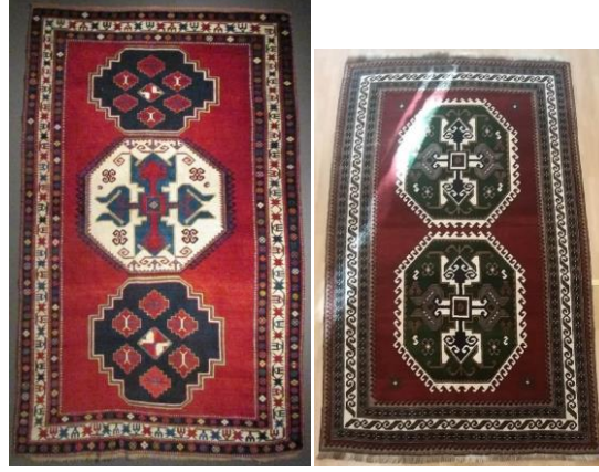
Foto 49:QazakBorçalı Halısı 20.yy öncesi, Foto 50: Kars Halısı, 1989-90Bakü Halı Müzesi.