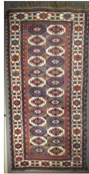
Foto 11: Muğan Halısı, Karabağ Grubu 20. yyöncesi, Azerbaycan Bakü Müzesi.

1.1.Türkmen Gülü Motifi: Bazı kaynaklarda Türkmengülü, Türkmen aynası veya Ejder motifi olarak adlandırılan motife Anadolu'da özellikle Kars, Ağrı, Muş, Bitlis, Erzurum, Malatya, Adıyaman, Elazığ ve Tunceli'nin köylerinde rastlamak mümkündür. 8 Azerbaycan'ın da birçok bölgesinde sık kullanılan bir motiftir. Motif sekizgenler içerisinde yer alan çengel basamaklardan oluşan ve ortasında yine sekiz köşeli yıldız bulunan bir tasarıma sahiptir. Bazı halıların zemininde büyük boyutta ve sıralı olarak kullanılırken, bazı halılarda ise küçük boyutta sıralı ve yan yana getirilerek kompozisyonlar oluşturulur. Motifin Anadolu, Kafkas ve Türki Cumhuriyetlerde ortak kullanılan bir motif olduğu düşünülmektedir.