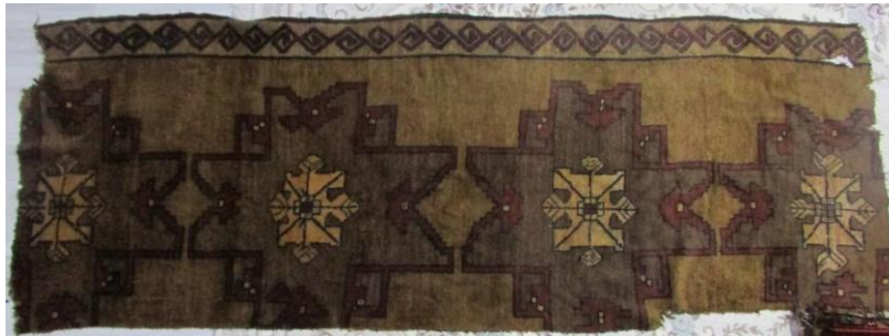
Foto 45:Iğdır Halfeli Köyü Halı Parçası, 1989, Dokuyucu Adile Yanık

3.3. Çelebi Halıları: Bu halı ismini Azerbaycan'ın Karabağ bölgesi Berde reyonuna (bölge) bağlı Çelebi köyünden almıştır. Latif Kerimov'a göre Çelebiköyü bu halının dokunduğu ilk merkezdir. 13 Halı kompozisyonunu zemini kaplayacak şekilde yer alan ve art arda sıralanan