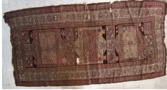
Foto 29: Şirvan Halısı, 1972 yılında Kars'ta satın alınmıştır, Kars Etnografya ve Arkeoloji Müzesi