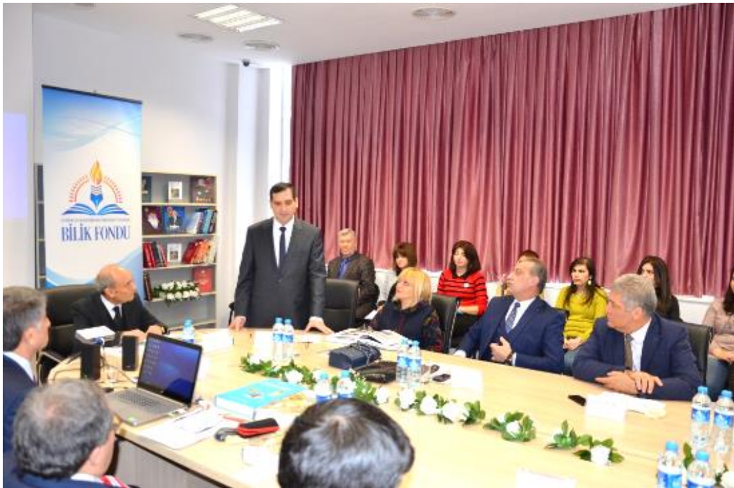
Foto 11: TC Bakü Büyükelçisi Erkan ÖZORAL ve eşi Meltem ÖZORAL toplantıyı takip ederlerken

Azerbaycan Bilimler Akademisinde gerçekleştirilen toplantıya Türkiye Cumhuriyeti Bakü Büyükelçisi Erkan ÖZORAL ve eşi Meltem ÖZORAL da katıldılar. Büyükelçi ÖZORAL da Gobustan 'ın Türk boy ve toplulukları açısından önemi ve ALYILMAZ tarafından hazırlanan eserin değeri hakkındaki görüşlerini dile getirdi.