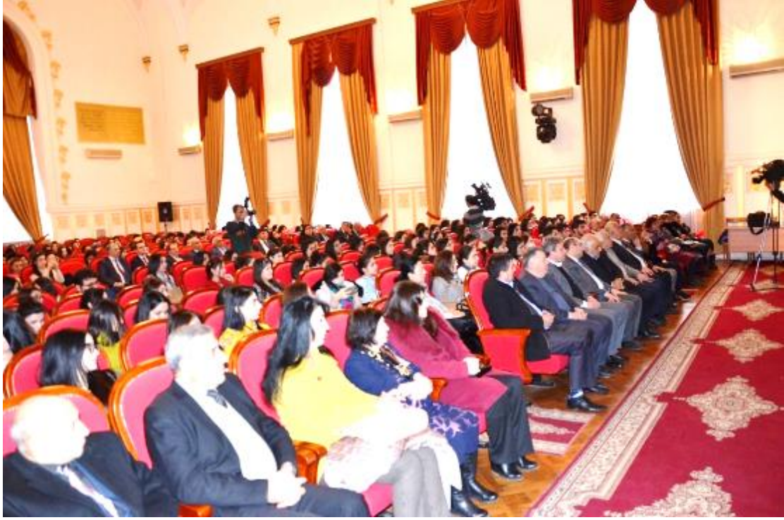
Foto 16: Pedagoji Üniversitesinde tanıtım toplantısının yapıldığı salondan genel bir görüntü