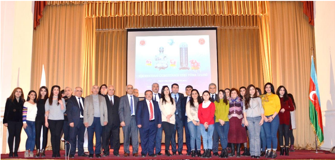
Foto 19: Konuşmacılar ve katılımcılar birlikte hatıra fotoğrafı çekilirken

Programın sonunda ise konuşmacılar ve katılımcılar birlikte hatıra fotoğrafı çekildiler.