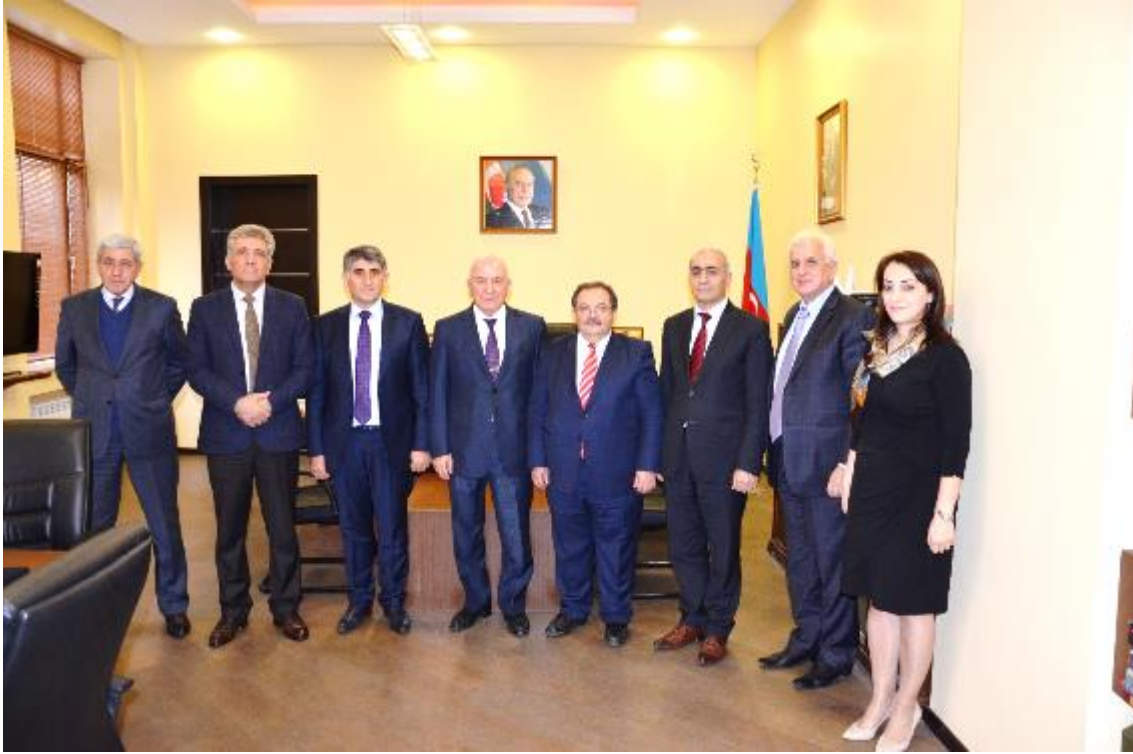
Foto 4: DOĞRU ve ALYILMAZ, Vagıf G. ALİYEV ve bazı bilim insanlarıyla

Bakan Yardımcısı Vagıf G. ALİYEV de yapılan görüşmede kitabın hem içeriği hem de baskı kalitesiyle bundan sonra yapılacak çalışmalara örnek teşkil edeceğini vurguladı.