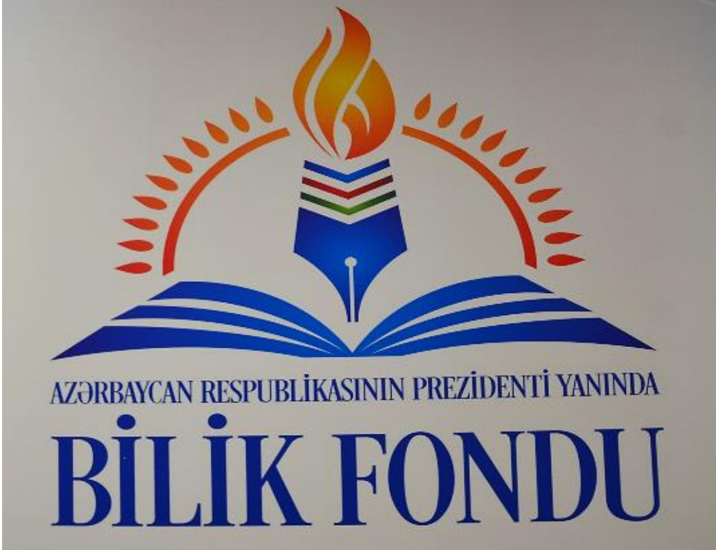
Foto 6: Azerbaycan Cumhuriyeti Cumhurbaşkanlığı Bilik Fondunun logosunun görüntüsü