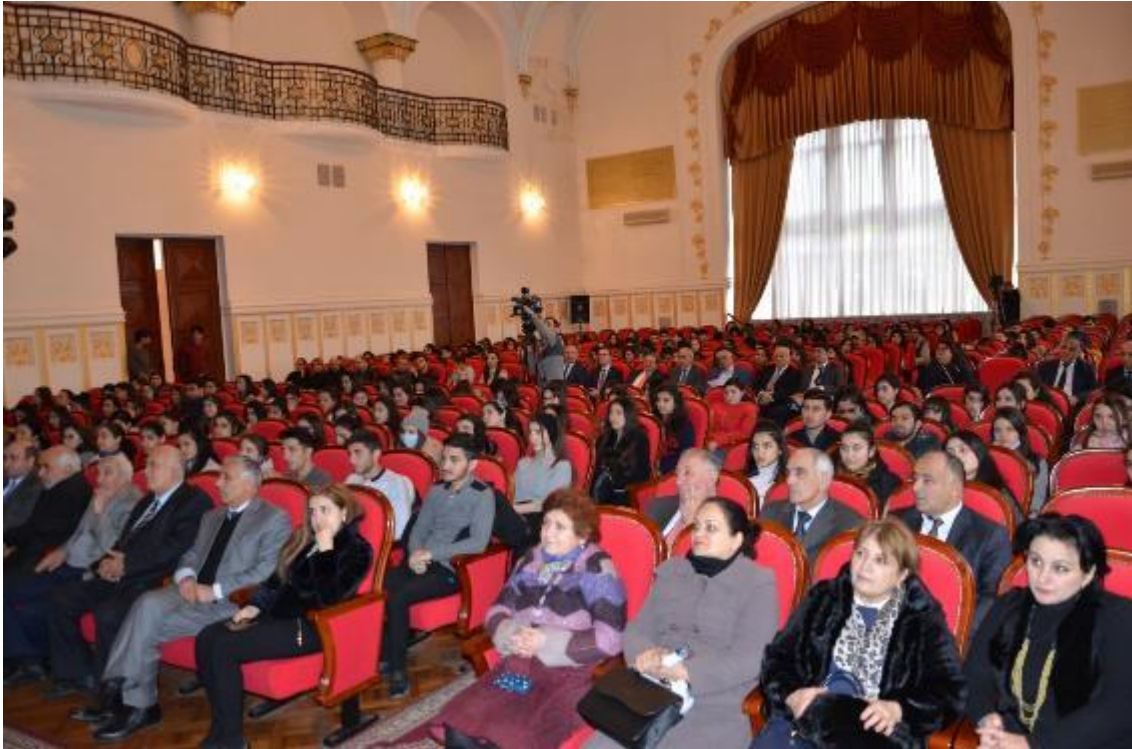
Foto 17: Pedagoji Üniversitesinde tanıtım toplantısının yapıldığı salondan genel bir görüntü