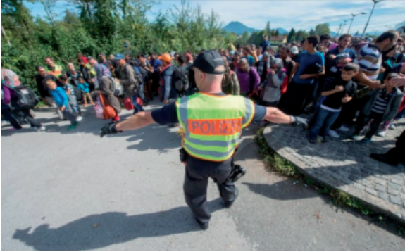
Görsel 5: Polis kontrolü, Der Spiegel , (Zhang, Hellmueller, 2017, s. 505).

maktadır. (b) Kadın, çocuk, aile ve ölüm fotoğrafları ile yakın plandan çekilen acıyı, çaresizliği ve umutsuzluğu yansıtan birey fotoğrafları ise insani bir söylemi desteklemektedir (Hansen, Adler-Nissen ve Andersen, 2021, s. 383; Banks, 2011, s. 293).