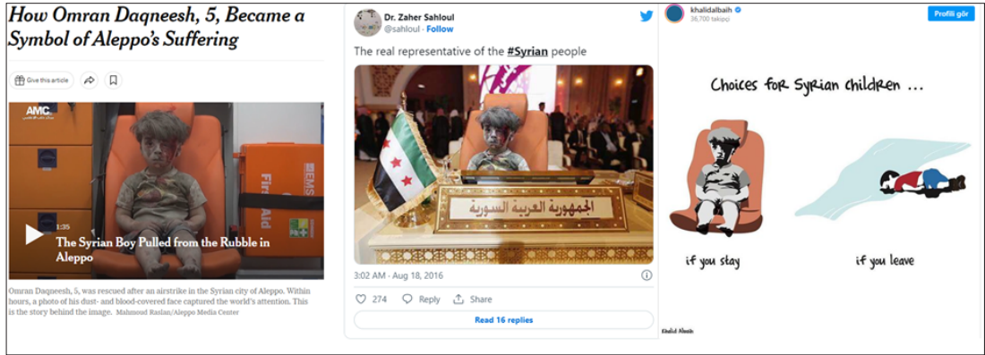
Görsel 9: Umran bebek, New York Times haber görselleri (New York Times, 2016)

2016 yılında Avrupa Birliği ve Türkiye arasında ilgili göç geçişlerini engellemek amacıyla Geri Kabul Antlaşması kabul edilmiştir.