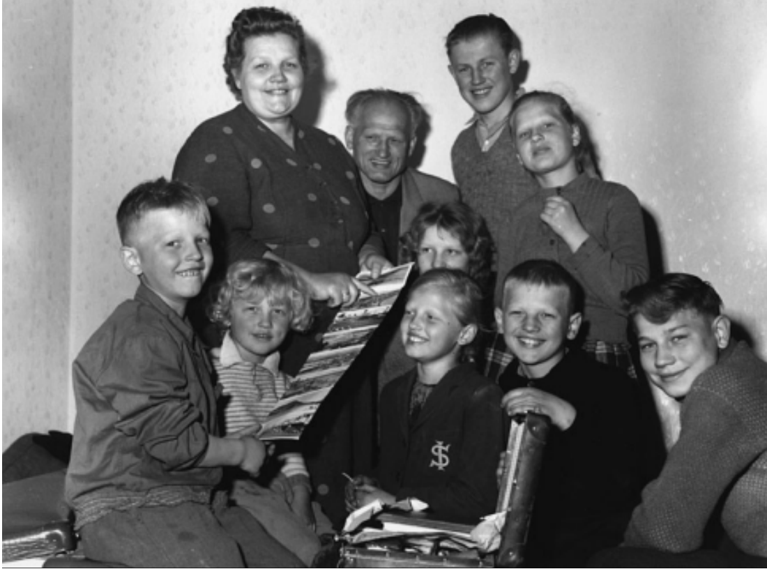
Görsel 1: Almanya, Avrupalı Göçmenler, 1953, UHNCR (Johnson, 2018, ss. 245)

Görseller küresel politikadaki mülteci rejiminin oluşturulmasında ve bu rejimin geçirdiği değişim-dönüşüm sürecini anlamlandırmada önemli bir referans kaynağı oluşturmuştur. Küresel mülteci rejiminin desteklenmesi ve kaynak sağlanması, ilgili göç prosedürlerinin kamuoyu desteği alınarak hayata geçirilmesi gibi konularda görsellerin gücü politik bir enstrüman olarak da kullanılmıştır. Uluslararası göç olgusu II. Dünya Savaşı sonrasında Avrupa'nın gerçeklikleri doğrultusunda küresel politikada yer bulmuş, mülteci ve göçmenlerin temsilleri Sovyet ve Doğu Bloğunun totaliterliğinden kaçan, aktif ve güçlü -bu anlamda daha çok erkek temsilleri-, "bizim gibi Avrupalı", beyaz, orta sınıf, savaş sonrası ekonomik yapılanmada iş gücü sağlayacak, ev sahibi topluma kolayca entegre olabilecek, siyasi kahramanlar imgelemi üzerine inşa edilmiştir (Bleiker, Campbell, Hutchison, 2014, s. 193; Johnson, 2018, ss. 246-247).