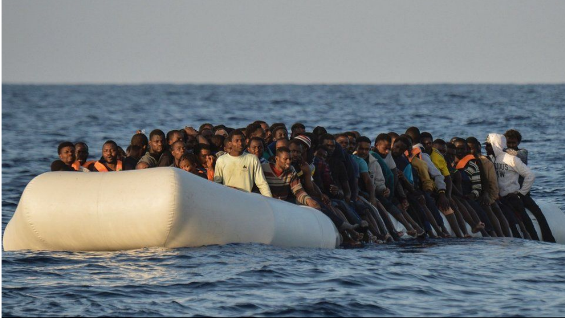
Görsel 4: Sallardaki göçmenler (BBC, 2016)

maktadır. (b) Kadın, çocuk, aile ve ölüm fotoğrafları ile yakın plandan çekilen acıyı, çaresizliği ve umutsuzluğu yansıtan birey fotoğrafları ise insani bir söylemi desteklemektedir (Hansen, Adler-Nissen ve Andersen, 2021, s. 383; Banks, 2011, s. 293).