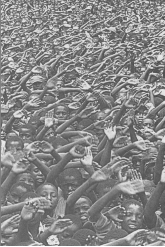
Görsel 3: Zambiya'da Mülteciler 1977, fotoğraf: Peter Marlow (Malkki, 1996, s. 387).

Özetle söz konusu dönüşümde bireysel görsel anlatılar değil, kalabalık topluluklar veya bireysel olacaksa da çocuk ve kadın mülteciler görsel imgelerde dikkat çekmektedir. Çünkü anne ve çocuk imgesi herkes tarafından kolayca anlaşılabilen ve en derinlere dokunan bir tür doğal, tarih dışı ve apolitik bir semboldür. Bu görsel temsiller, yeni küresel göç politikalarının merkezine klişeleşmiş cinsiyetçi ezberleri oturtmuştur; kadınlar kırılğan, pasif, güçsüz, savunmasız, içinde buldukları koşullar altında ezilen ve başkalarına bağımlı olarak stereotipleştirilmiştir (Bleiker, Campbell, Hutchison, 2014, s. 193). Standartlaştırılmış temsilli uygulamaların bu küresel görsel politiği, etkileri bakımından oldukça şaşırtıcıdır. Keza çocuk ve kadın resimleri uzun yıllar boyunca ulus ötesi bir sosyal mültecilik tasavvurunun detaylandırılmasında, yardım kampanyalarının yürütülmesinde, fonların kurulmasında ve küresel desteğin harekete geçirilmesinde önemli görsel enstrümanlar olmuştur (Malkki, 1996, s. 386). Diğer yandan yoğun kalabalıklar, Doğulu erkek toplulukları, teknelerle gelen insanlar gibi