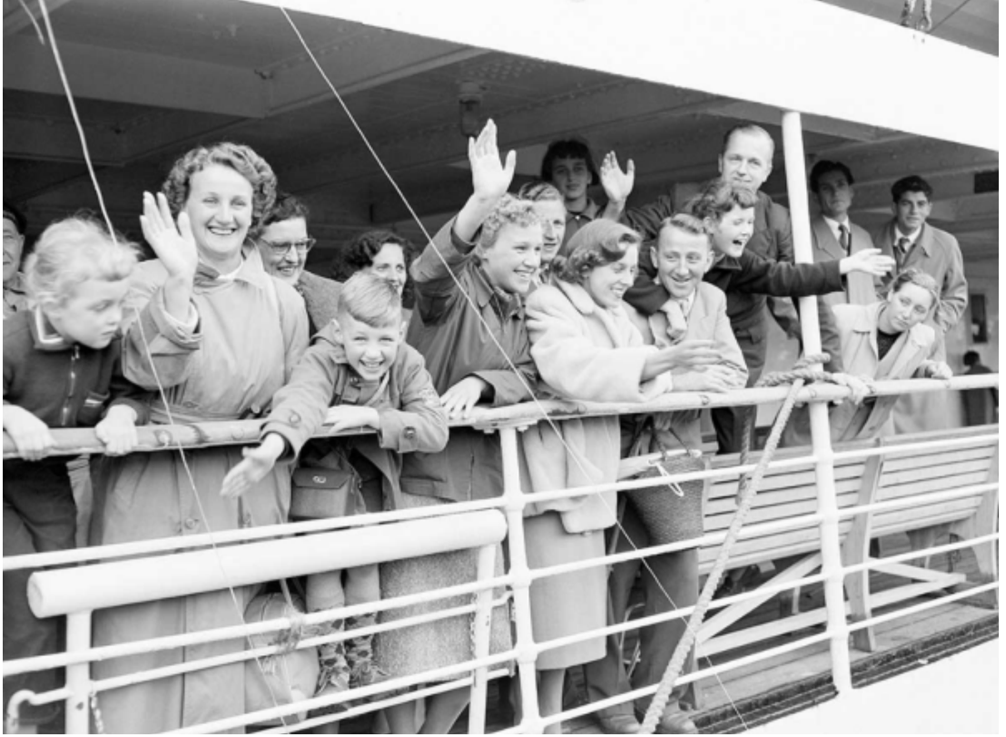
Görsel 2: Melbourne Limanı'na Ulaşan Hollandalı Göçmenler, 1954, ( https://www.nma.gov.au/defining-moments/resources/postwar-immigration-drive )

politik gücü konusunda bize önemli bir ipucu sunar: “Basın o grubun fotoğraflarını yayınladıktan sonra Avustralya halkına göçmenlik satmak zor değildi” (National Museum Australia, 2022). Buradaki söylemsel içerik analizi, paylaşılan görsel temsillerle ilişkilendirildiğinde güzelliğin biyopolitikası bağlamında Avustralyalıların gelen göçmenlerle iç-grup özdeşleştirilmesi ve duygudaşlık kurmasının amaçlandığını ve dâhil etme/kabul etme stratejisi izlendiğini söylemek mümkündür.