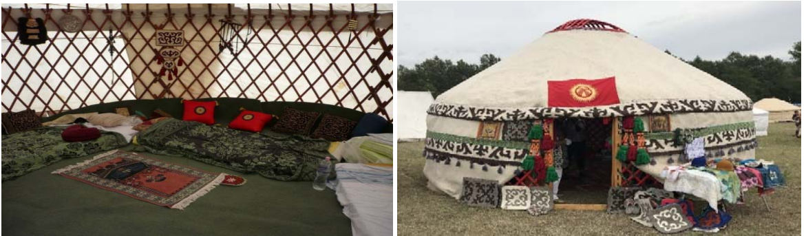
Şekil 10: Yurtların İç ve Dış Görünümleri

Yurtların içerisine girildiğinde kenarlarının hasır sistemi olarak tabir edilen çapraz çıtaların birbirine bağlanması ile oluşturulmuş olduğu gözlenmektedir. Kanat denilen hasır sistemi çadırın büyüklüğüne göre açılıp kapanabilen ve dairesel bir biçimde alanının küçültülebildiği fonksiyona sahiptir. Bu özellik yurtların daha hızlı ve pratik bir biçimde kurulmasını, sökülmesini ve taşınmasını sağlamaktadır. Yurtların tavan kısmına bakıldığında bir ucu kanat denilen sistemin üst kısmına bağlanan diğer ucu üst kısımdaki dairesel boşluğu oluşturulmak için kullanılan sistemin üzerindeki deliklere yerleştirildiği görülür. Bu çıtaların birleşimi ile tepe alanın ortasında yuvarlak bir boşluk oluşur. Genel itibari ile yapının iç kısmının mükemmel geometric biçimlerden oluştuğu ve bu hali ile dahi estetik görüldüğü söylenebilir.