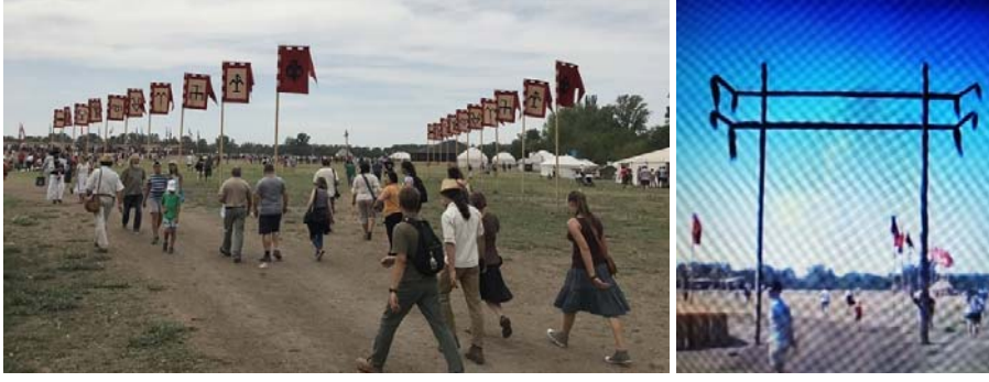
Şekil 9: Kurultay ve Yurt Alanı Girişi

Bu alan içerisine ayrıca yurtlardaki yaşantının birbirini engellemeyecek şekilde yapıldığı da görülmektedir. Yurtlar orta büyüklükte, içerisinde yaklaşık 15 kişinin konaklayabileceği biçimdedir. Yapılan yurtlara yakından bakıldığı zaman, yurtların ana unsurları olan kapı, kanat, uç, çevlik, keçe ve kolonlardan meydana geldiği görülmektedir.