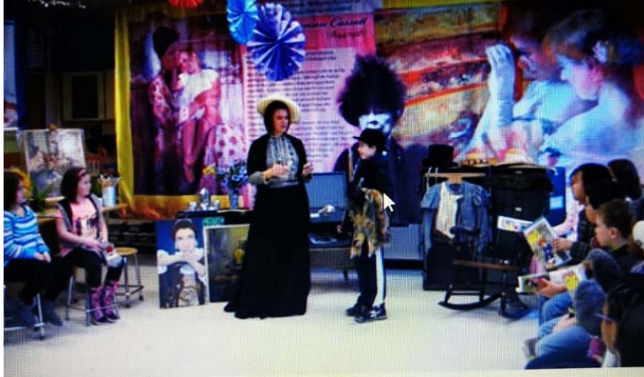
Şekil 4: James A. Michener Sanat Müzesi Gezici Bavul Müze Uygulaması

Toplumun neredeyse her kesimine katkı sunan müzeler; çeşitlendikçe daha da işlevsel hale gelebilmektedir. Taşınabilmesi kolay müze nesnelere olduğundan gezici bavul müzecilik ile kimsesiz çocukların barındığı evlerden, yaşlı bakım evlerine kadar, toplumun her kesimine fırsat eşitliği sağlanabilmektedir.