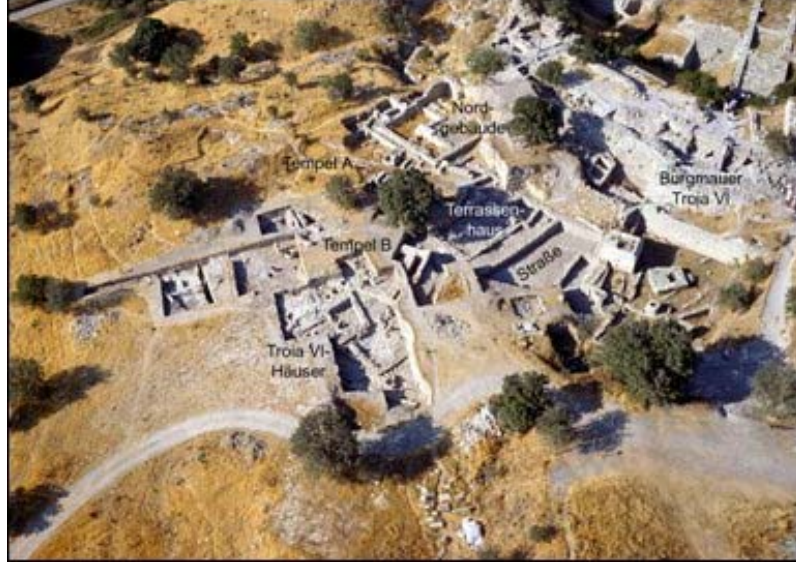
Şekil 5: Troya Antik Kenti (Ören Yeri)

Toplumun her kesiminin rahatlıkla gidip ziyaret edebileceği genellikle kar amacı gütmeyen koruma amacına hizmet eden alanlardır. Çalışma alanlarının büyüklüğünden dolayı uzun zaman gerektiren sabırla her geçen gün üstüne koyulan dinamik bir alandır.