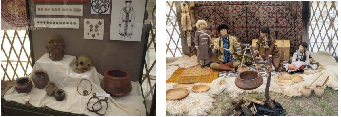
Şekil 15: Hun Savaşçısı Orijinal Kafa tası ve günlük yaşam

Serginin ana unsurlarından biri, silahları (mızrak, yay, kılıç, hançer) ve savunma teçhizatı (lamella metal zırh) ile gerçek boyutlu bir at modeli üzerinde oturan silahlı bir Hun savaşçısı figürüdür. Yıldızlı at aletleri, gerçek buluntulara dayanan rekonstrüksiyonlardır. Savaşçının yüzü, Transilvanya'daki Marosszentgyörgy'de bulunan soylu Hun savaşçısının orijinal kafa tasına dayanmaktadır.