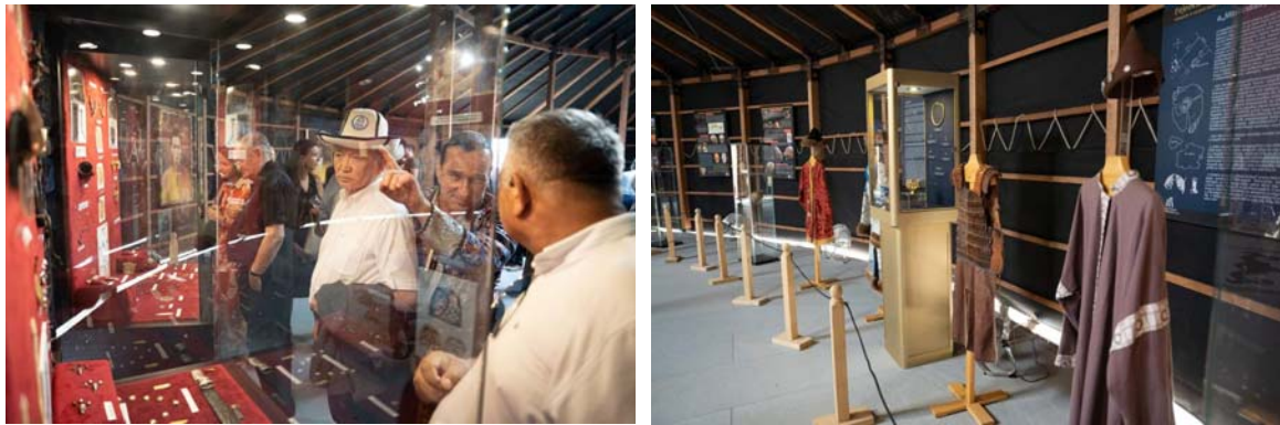
Şekil 14: Atilla Yurt (Atilla Satra) Müzesi İçerisinden Bir Kesit

Döneminin özelliklerine göre yapılan yurt içerisinde Macar sanatçı Zalan Kertai tarafından ele alınan “Hunların gelişi” temalı büyük akrilik tablolardan oluşan bir sergi yer almaktadır. Yapılan bu eserler Macar Türk tarihine ışık tutmaktadır. Yapılan eserler o dönemin kültürünü, mücadelesini ve kıyafetlerini göstermektedir. Bu eserler içeri kısımda sergilenen arkeolojik kalıntılar ve antropolojik rekonstrüksiyonlara uyumludur.