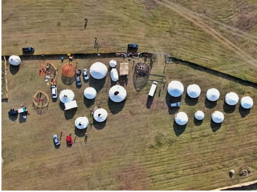
Şekil 11: Yurtların Kurulma Aşamasını Yansıtan Üstten Bir Görüntü

hava gelmesini sağlayan önemli bir diğer işlevi de bulunmaktadır. Yurt kapıları kişilerin başını eğerek girebileceği kadar küçük olması dikkati çekmektedir. Bu kapıların bu şekilde inşa edilmesi kadim Türk kültürünün içindeki yurt sahibine gösterdiği saygının ince bir örneğidir. Bu kanat ve çatıyı dışarıdan saran keçe ve kolonlar daha dayanıklı olmaları için tercih edilmiştir. Yurtların ana kısmını üstten tamamen örten kolonlar, keçeleri iskelete tutturup ihtiyaca göre belli kısımların açılıp kapanmasını kolaylaştırır. Bunun yanı sıra yurtları keçe altından geçerek saran kolonlar da bulunmaktadır.