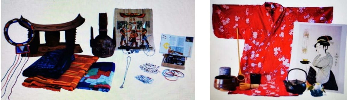
Şekil 3: Seattle Sanat Müzesi Gezici Bavul Müze İçeriği

Toplumun neredeyse her kesimine katkı sunan müzeler; çeşitlendikçe daha da işlevsel hale gelebilmektedir. Taşınabilmesi kolay müze nesnelere olduğundan gezici bavul müzecilik ile kimsesiz çocukların barındığı evlerden, yaşlı bakım evlerine kadar, toplumun her kesimine fırsat eşitliği sağlanabilmektedir.