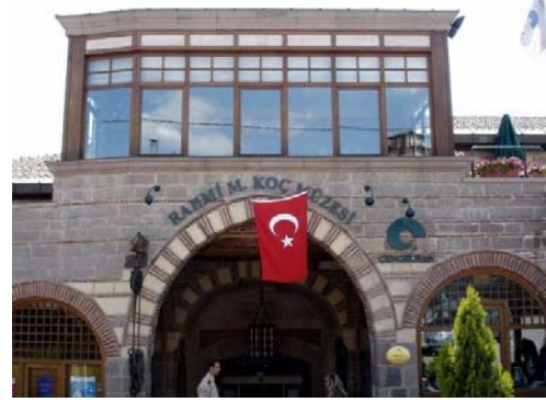
Şekil 2: Rahmi M. Koç Müzesi

Gezici bavul müze uygulaması ise uzaklık, ulaşım zorlukları, maddi olanaksızlık, zamansızlık, hastalık gibi nedenlerden dolayı müzeleri ziyaret etme imkânı olmayan kişilere, kurumlara ve kuruluşlara çeşitli eğitim materyalleri ve müze nesnelere içeren bavullar ile olanak sağlama amaçlı geliştirilmiştir. İçerisinde taşınabilir müze nesnelere olan bavullar ile yetersizlikler neticesinde ulaşılamayan çeşitli alan ve bireylere ulaşım kolaylaşmaktadır. Bu tip yaklaşımlar müzelerin toplum ile bütünleşmesini sağladığı gibi toplumda müze kültürünün oluşmasına da katkı sunmaktadır. Toplumsal kültür ve bütünleşmenin sağlanmasında müzeler önemli bir yere sahiptir. İçerisinde Türkiye'nin de bulunduğu Avrupa'dan 22 ülkenin katıldığı 1992 tarihli Salzburg sempozyumu, bir Avrupa kültürü ve kimliği olup olmadığı ve müzelerin böyle bir kimliğin oluşumuna katkıda bulunup bulunmayacağı sorunlarını ve çözüm önerilerini dile getirmektedir (Seidel ve Hudson'dan çeviren Ata, 1999).