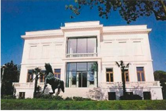
Şekil 1: Sabancı Müzesi

Bakanlık tarafından belirtilen kriterlere uygun oluşturulan koleksiyonlar alanında uzman kişiler tarafından incelenir, belgelenir ve değerlendirilmesi sonucunda müze alanlarında sergilenir. Türkiye'de özel müzelere örnek olarak Rahmi M. Koç Müzesi, Sabancı Sanat Müzesi ve İş Bankası Müzeleri gösterilebilir.