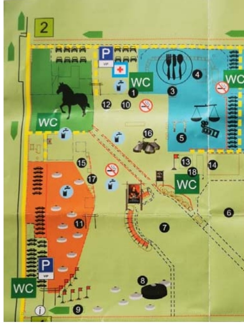
Şekil 12: Macaristan Turan Kurultayı Alan Planı

olduğunu ortaya koymuştur. Karpat havzasından gelen Kazakistan Türk topluluğu ve Macar Türk topluluklarının katıldığı bir toplantı gerçekleştirilmesiyle Zsolt András Bíró önderliğinde Macaristan'ın Bugaç yaylasında adına kurultay denilen bir organizasyon yapılması kararı alınmıştır (web 3).