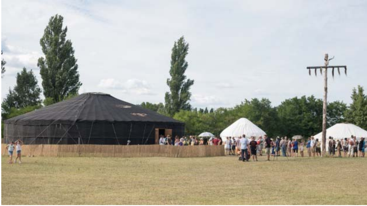
Şekil 13: Atilla Yurt (Atilla Satra) Gezici Müzesi

Gezici müzeciliğin Türk toplumuna has en güzel örneklerinden olan Atilla Yurt (Atilla Satra) içerisinde antropolojik ve arkeolojik kalıntılar ile bir sergi alanı oluşturulmuştur. Bir büyük ve iki küçük yurttan oluşan bu alan içerisinde Hun Avar bölgelerinden çıkarılan arkeolojik kalıntılar yer almaktadır. Ayrıca çapı 20 metreden fazla olan bir yurt, dünyanın en büyüğü olma özelliğini de elinde tutmaktadır.