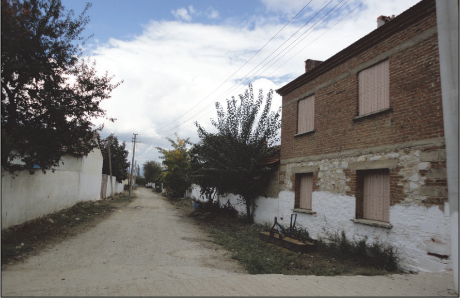
Fotoğraf 1. Tire'nin batısındaki köylerin genelinde olduğu gibi Yeniçiftlik köyünde de yollar araç geçişine izin verecek genişlikte ve genellikle toprak veya asfalt kaplıdır.