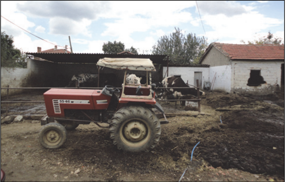
Fotoğraf 2. Yeniçiftlik köyündeki evlerin tamamı içinde hayvan besiciliğine uygun ahırların bulunduğu bir avluya sahiptir.