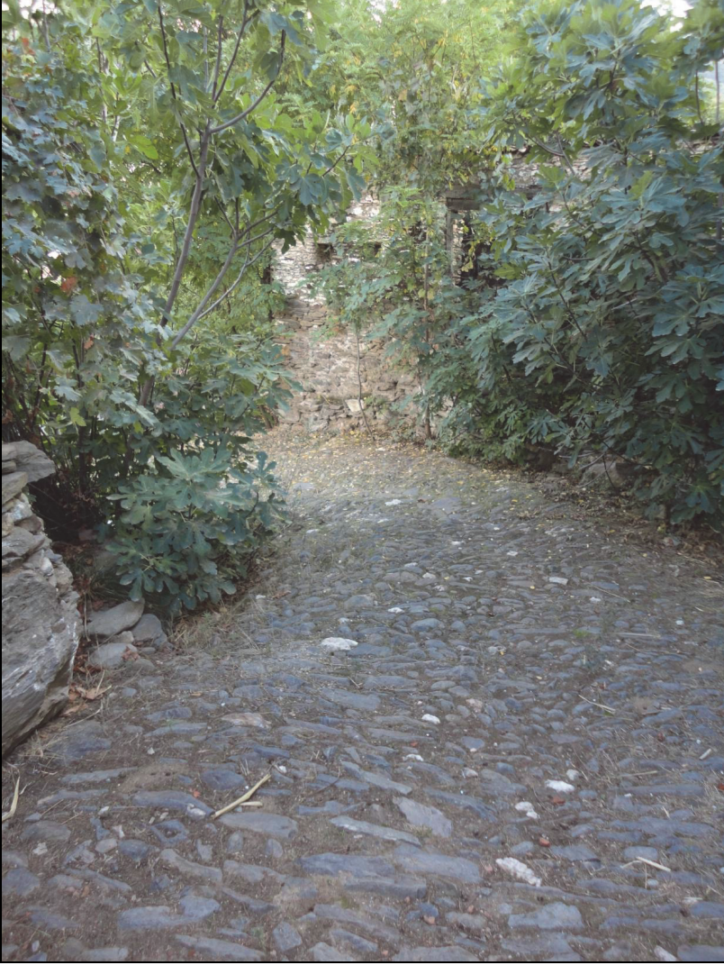
Fotoğraf 4. Tire'nin batısındaki köylerin taş döşeli yolları genellikle araç geçişine imkan vermeyecek genişliktedir.

köy mezarlıklarındaki mezar taşları batıdaki köylere nispetle doğudaki köylerin çok daha eski bir yerleşme tarihine sahip olduğunu göstermektedir (Armağan, 1994).