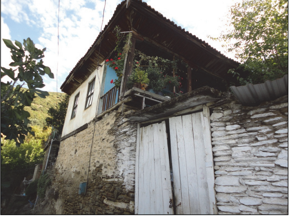
Fotoğraf 3. Kireli köyünde yapı malzemesi ve sundurmali mimarisi ile geleneksel bir köy evi

Batıdaki köylerin aksine Tire'nin doğusundaki köylerin mimarisi daha geleneksel bir yapı arz etmektedir. Köy evlerinde yapı malzemesi olarak tuğla ve briket gibi çağdaş yapı malzemelerinin yerine bölgenin yerel yapı malzemeleri olan taş ve kereste kullanılmıştır. Evlerin büyük bir çoğunluğu geleneksel mimariye uygun biçimde bir sundurmaya sahiptir (Fotoğraf 3). Yolların büyük bir çoğunluğu araç geçişine imkân vermeyecek biçimde dar ve taşlarla kaplıdır (Fotoğraf 4).