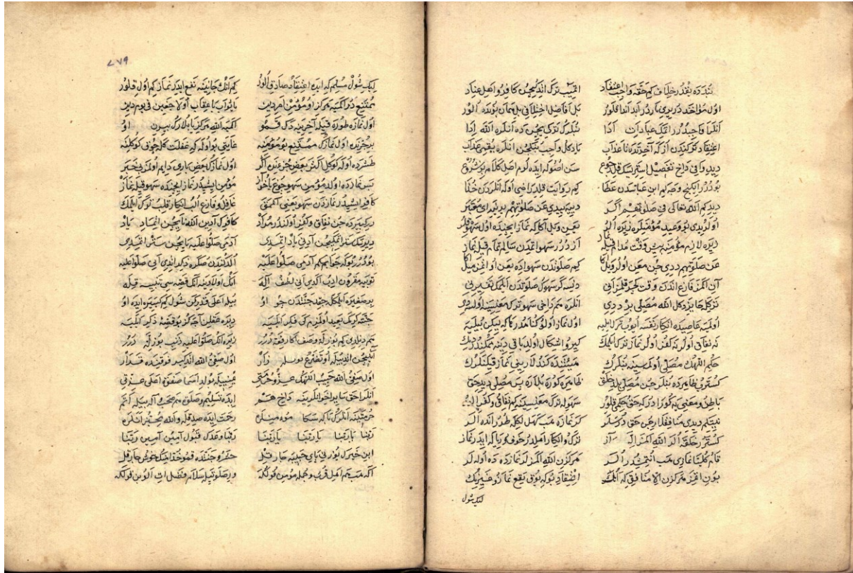
Vr: 39 b – 40 a