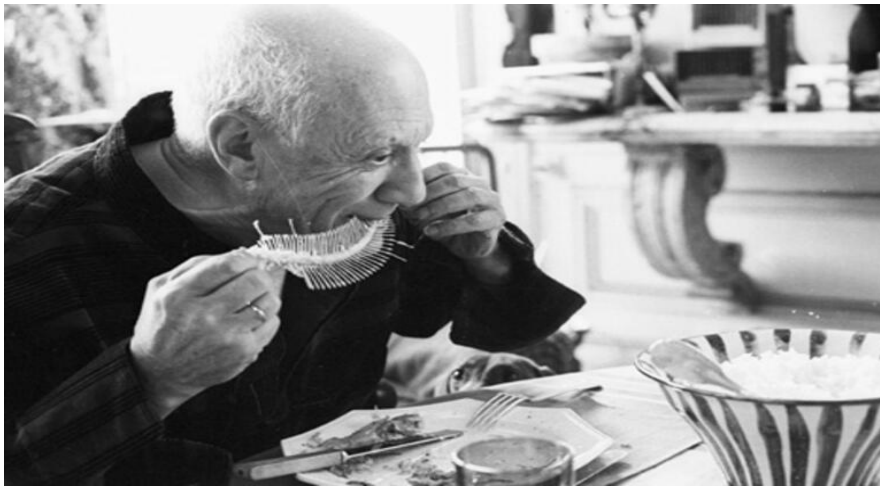
Şekil1. (https://www.hurriyet.com.tr/kelebek/hurriyet-pazar/sanaticilarin-favori-yemekleri-36920442Alıntılama Tarihi:31.08.2022 Saat:17.55 )

Pablo Picasso yaşamı boyunca karakter olarak özünden kopmamıştır. Yemek ile olan ilişkisi bir anlamda geçmişle bağını sürdürmesine, sanatına katkı sağlamasına, yeni çevre ve dostluklar kurmasına da vesile