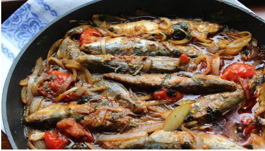
Şekil 2. Picasso'nun Eskabeş Usulü Sardalyası ( https://www.hurriyet.com.tr/kelebek/hurriyet-pazar/sanatcilarin-favori-yemekleri-36920442 Alıntılama Tarihi:31.08.2022 Saat:17.59)

olmuştur diyebiliriz. Picasso'nun geleneksel İspanyol yemeklerini sevmesi, alışkanlıklarını sürdürmesi eski Rus sanatçısı olan eşi Olga ile aralarında çatışmaya hatta ayrılmalarına sebep olmuştur. Pablo Picasso mizahi biçimde biraz da serzenişle "Olga çay, pastalar ve havyar severdi, bense Katalan sosisi ve fasulyesi." diyerek ayrılmalarının sebebini kendince ifade etmiştir. Bu konuşmadan anlaşılan Picasso ile eski eşinin arasında sınıfsal farkın olmasıdır. Çünkü Olga daha yüksek sosyete mensup eski Rus sanatçısıdır. Daha gösterişli lüks ortamlarda mutludur. Picasso ise daha basit ortamlarda olmaktan, fasulye ve sosis yemekten hoşnuttur. Olga'dan ayrıldıktan sonra evlendiği yeni eşi Marie Thérèse ve kızı Maya için "İncir ve üzüm dolu tabak" "Demir telli portakallar" , "Limonun dudakları" , gibi isimlerde natürmortlar yapar. Yapmış olduğu resimler ise Picasso'nun mutluluğunun bir nevi yansıması olarak düşünülebilir.