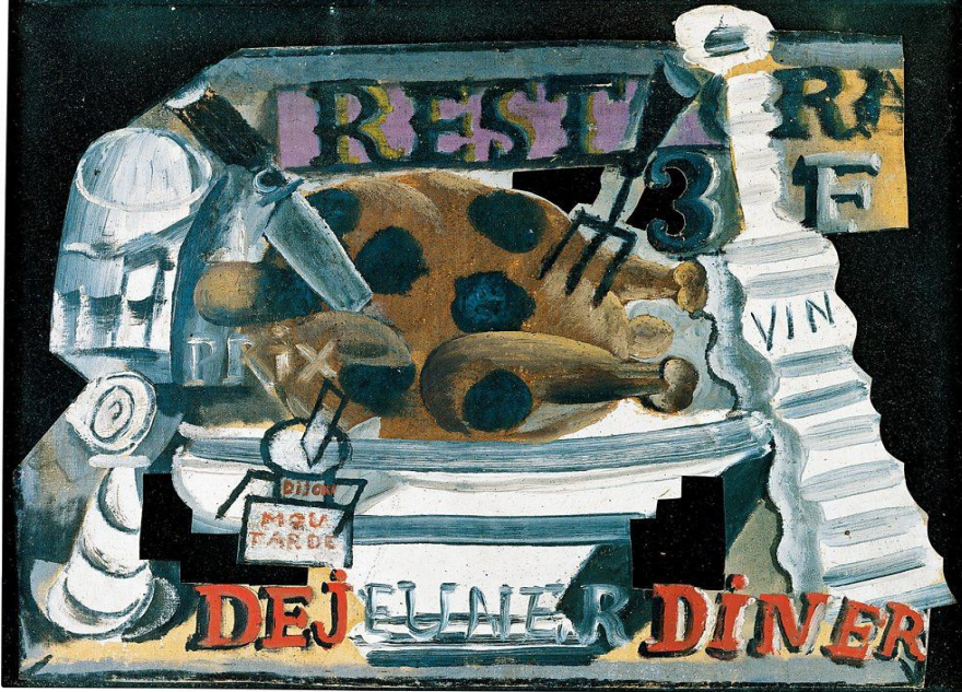
Şekil 3. Pablo Picasso - The Restaurant, 1914 ( https://www.gazeteduvar.com.tr/picasso-picassonun-yerinde-yemek-yer-makale-1578050 Alıntılama Tarihi: 04.09.2022).