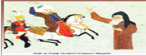
Fatih ve Patrik Ovakim'i Gösteren Minyatür

XVIII. yüzyılda Katolik ve Ortodoks Ermeni cemaati arasında mezhep kavgaları yaşanmaya başladı. Osmanlı Devleti bu anlaşmazlıkların engellemek için 1531'de Katolik Ermeni Patrikhanesi'nin kurulmasına izin verdi. Hıggörü ve özgürlüğün bir sonucu olarak Türklerle en fazla kaynaşan topluluk Ermeniler oldu. Türkçe konuşurlar hatta ibadetlerini bile Türkçe yaptılar. İshak Fermanı'ndan sonra her çeşit devlet memurlarında bulundular. Ermenilerden Osmanlı idaresinde 33