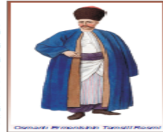
Osmanlı Ermenisinin Temsilî Resmi