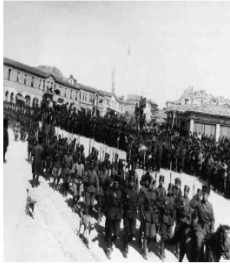
Kars'ın işgalden kurtulması sonrasında Ankara'da yapılan toplantı (1920)