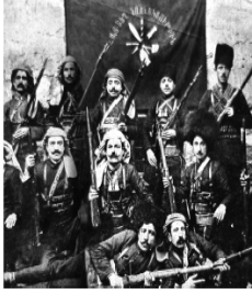
Rusya'nın yanında savaşan bir Ermeni çetesi

Doğu Cephesi'nin kapanmasıyla buradaki birliklerin bir kısmı Batı Cephesi'ne kaydırılmıştır. Halkın gözünde ordu ve Meclis'e duyulan güven artmıştır.