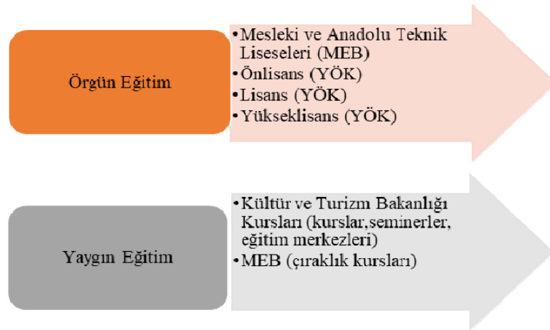
Şekil 2. Türkiye’de turizm eğitimi

Avrupa Birliği ve Türkiye turizm politikalarında hedeflenen diğer bir önemli politika kaliteli bir sektör oluşturulması adına nitelikli personel yetiştirmek için turizm eğitimidir. Türkiye’de turizme yönelik mesleki eğitim örgün ve yaygın olmak üzere iki grupta incelenmektedir. Şekil 2’de Türkiye’de turizm eğitiminin verilmiş biçimine yer verilmiştir: