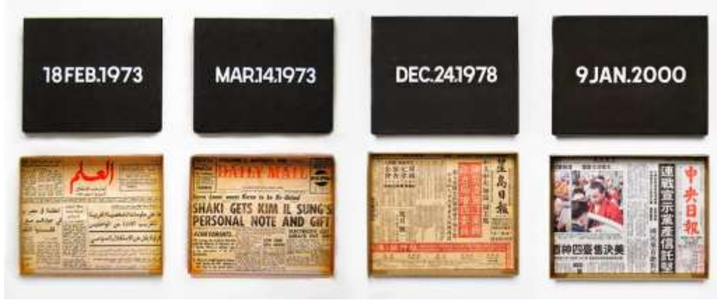
Görsel 2. On Kawara, 1966-2013, Bugünün Serileri/Tarih Resimleri/Today Series/Date Paintings , New York, ABD.

On Kawara'nın, dil odaklı Kavramsal Sanat işlerinden en uzun süreli olanı, 1966 ile 2013 yılları arasında toplam 47 yıl sürdürdüğü 'Bugünün Serileri/Tarih Resimleri', (Görsel 2) adlı çalışmasıdır.