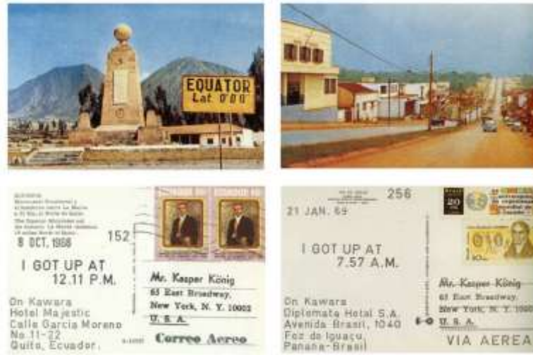
Görsel 4. On Kawara, 1968-1984, Başlık ve Telgraflar/Title And Postcards, Uyandım/I Got Up At , New York, ABD.

On Kawara, 'Başlık ve Telgraflar', adı altında yaptığı 'Uyandım' ibareli kartpostallarında da Kavramsal Sanatta dil konusuna ilgi gösterir.