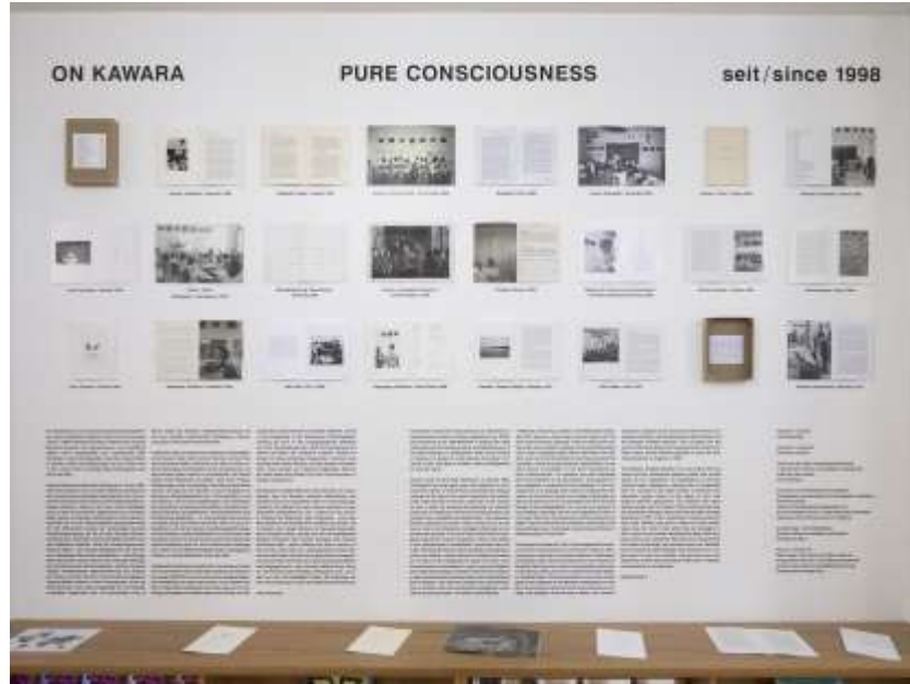
Görsel 7. On Kawara, 2017, Saf Bilinç/Pure Consciousness , Enstalasyon, Präsentation im Kunstmuseum Pablo Picasso, Münster, Almanya.