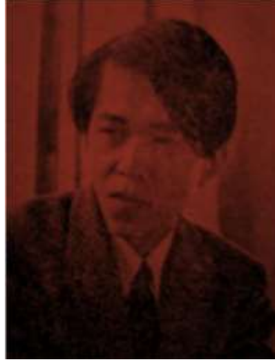
Görsel 1. On Kawara'nın çok az sayıdaki portre fotoğraflarından biri, New York, ABD.

Dolayısıyla On Kawara, kendi kişisel durumlar temelinde yaşadığı (nerede ve ne zaman) rutin olayları 'kayıtsız ve şartsız' kavramsal işlerine taşıyan; düşünsel sorgulamalara ve sonuçlara yol açan bir sanat ortaya çıkarır. Kawara Kavramsal Sanat işlerinde, insanın ve doğanın varlık durumunu sorgular ancak, onun için geçmişe ait olduğunu hissettiği tüm yazılı ve görsel belgelerin hiçbir önemi yoktur; aksine kişinin o anda ve nerede durduğu/bulunduğu/yaşadığı önemlidir.