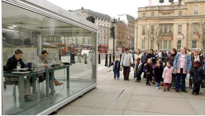
Görsel 5. On Kawara, 2004, Bir Milyon Yıl/One Million Years , Performans, Trafalgar Meydanı, Londra, İngiltere.