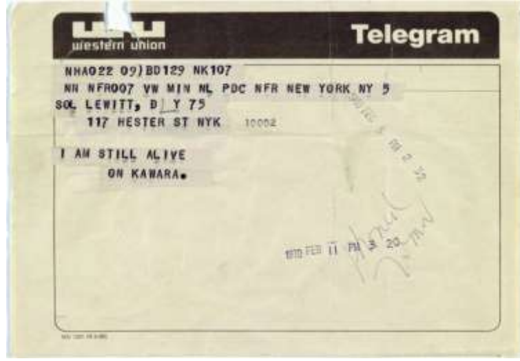
Görsel 3. On Kawara, 1968-1984, Başlık ve Telgraflar/Title And Postcards, Hâlâ Hayattayım/I Am Still Alive , New York, ABD.