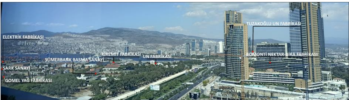
Fotoğraf 1- Güncel coğrafi görünümde Liman Ardı Bölgesi'nin eski fabrikaları. Photo 1- Current geographical view of old factories behind of Alsancak Port.

Figure 2- The distribution of the old factories established behind of Alsancak Port and around. The İzmir Development Agency's datas were used in the determination of the factories.