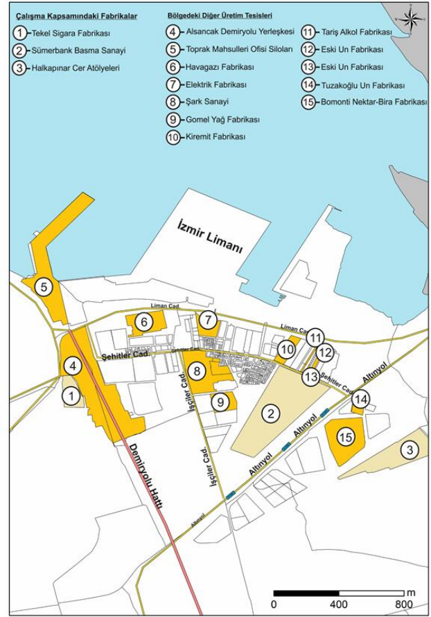
Şekil 2- Liman Ardı ve çevresinde kurulmuş eski fabrikaların dağılışı. Fabrikaların belirlenmesinde İzmir Kalkınma Ajansı'nın verilerinden faydalanılmıştır.

dönüşüm hamleleri bulunmaktadır. Planlama süreçlerindeki belirsizliklerin çözülmesi sonrası alandaki fonksiyonel değişimin konuta doğru olacağı düşünülmektedir.