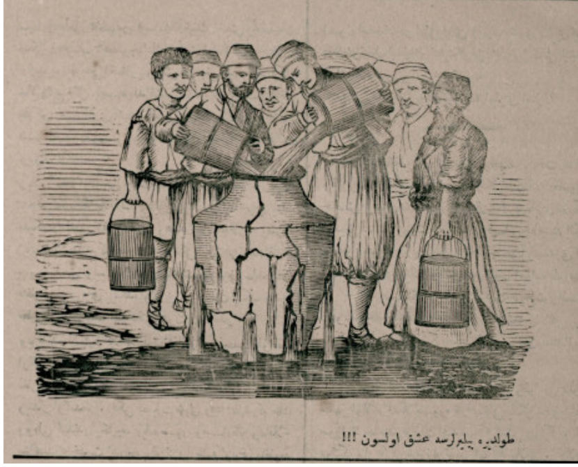
GÖRSEL 1: “Doldurabilirlerse aşk olsun !!!”

itibaren üç mah müddetle ta'til edilmiştir 9 şeklindeki emirname ile üç aylık kapatma cezası aldığı için kaçırılmıştır. Cezaya konu olan “resim” derginin 18 Eylül 1292 (30 Eylül 1876) tarihli 301. sayısında yayımlanan “ doldurabilirlerse aşk olsun ” lejandlı karikatürdür.