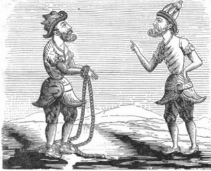
— Eh bien ! dans quel état se trouvent, Karagözü ? — Bah-jözü, tout-à-fait ! C'est la liberté dans les limites de la loi !

Aussitôt qu'un petit traité avec l'Hôtel-de-Ville lui eut donné l'essor, il s'habilla, il tomba avec