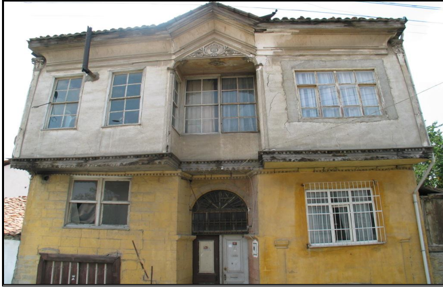
Foto-1. İmam Hasan sokakta, 150 yıl önce yapılmış olan Ağa evi.

inşa edilmiştir. Kapalı hanaylar daha ziyade camekanla kapatılmıştır. Üst kattaki odaların pencereleri hanaya bakmaktadır. Türk evinin en belirgin özelliği olarak ön plana çıkmış olan “ cumba (çıkma) ”, Isparta evlerinde de yaygın olarak görülmektedir.