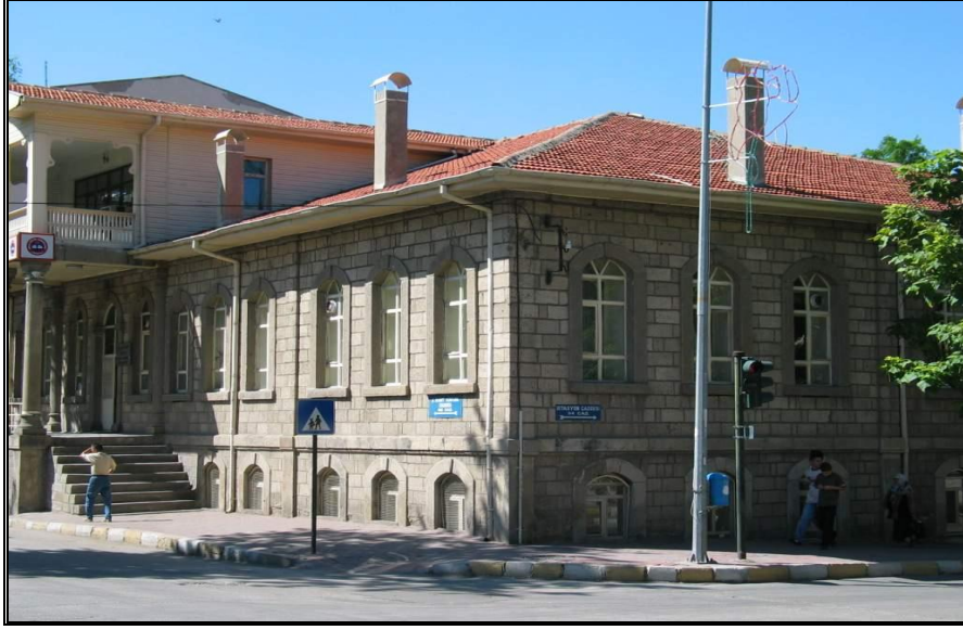
Foto-6. 1900'lü yılların başında yapılmış olan eski Ticaret Yüksekokulu.

onarım durumu ve dış görünümü iyi durumdadır. Ancak binanın daha özenli kullanılması, korumanın amacı açısından önemlidir. Yapı 1977 yılında tescil edilerek koruma altına alınmıştır.