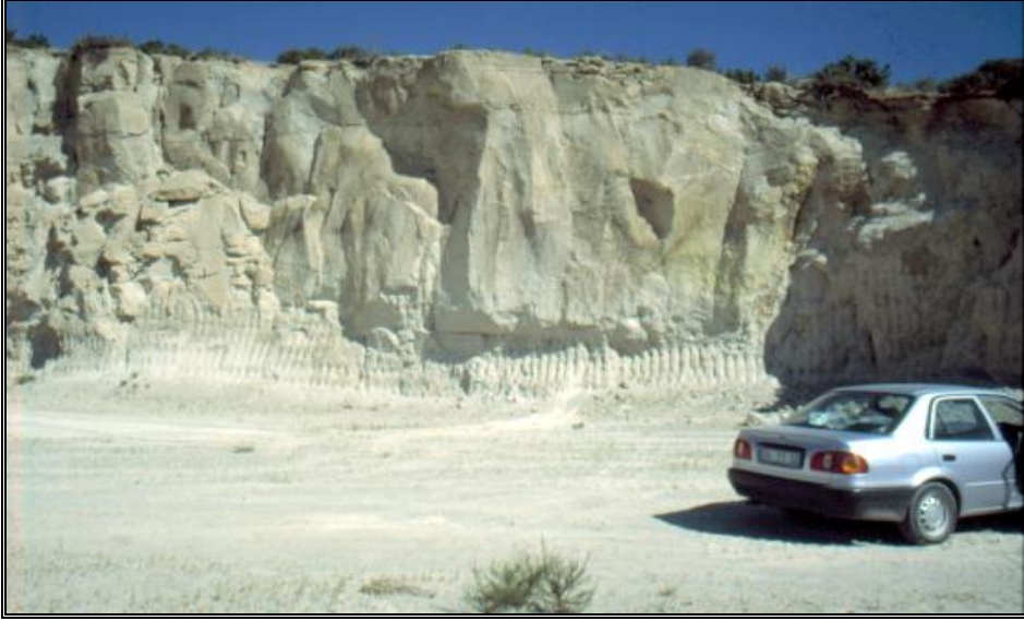
Foto-9. Isparta Çayderesi batısında yüzeyleme veren kaynaklanmış tüflerin genel görünümü.

ve civarında kullanılmaktadır. Söz konusu yapıtaşları, kullanıldığı yapılarda, hem statik olarak yük taşıyan olduğu gibi, hem de binaların duvarlarında dolgu malzemesi olarak uygulanmaktadır. Bunun yanı sıra özellikle köfke taşı, binaların dış cephelerini dekore etmede kaplama taşı olarak da yaygın bir şekilde kullanılmaktadır. Kaynaklanmış tüflerin, Isparta'nın dışında yakın illere kadar taşındığı ve oralarda da başarılı bir şekilde kullanıldığı görülmüştür.