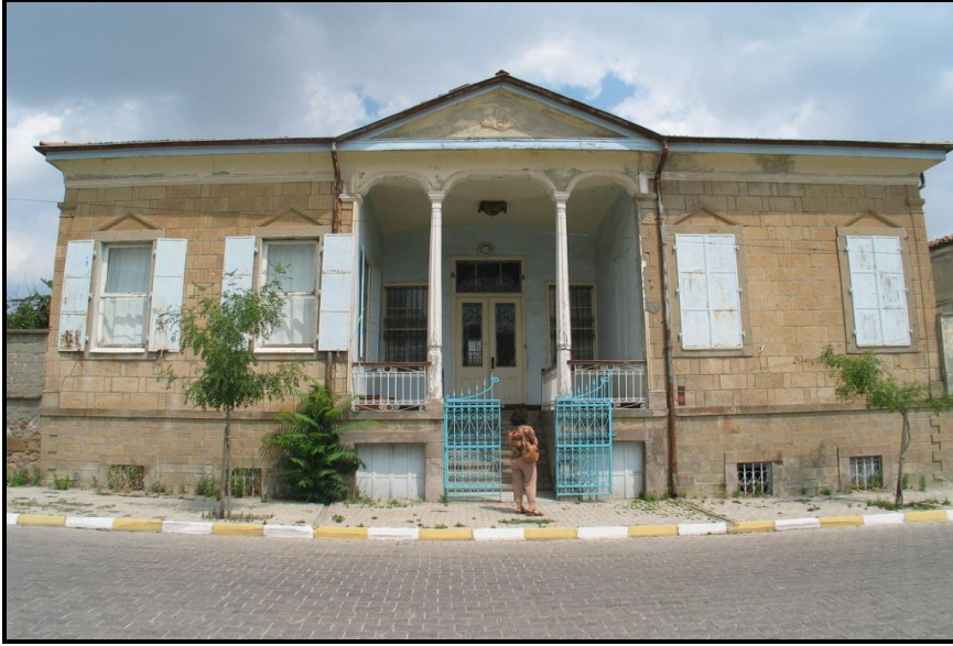
Foto-2. Üçgen alınlıklı bir gayrimüslim evi (Isparta, Çay Yolu'nda).

Bu evlerde kullanılan süslemeler Türk evlerinde kullanılan süslemelerden tamamen farklıdır. Örneğin Türk mimarisinde bulunmayan üçgen alınlık, gayri müslim evlerinin en belirgin özelliğidir. Üçgen alınlık özellikle evin ana giriş kapısının üzerinde bulunmaktadır. Bu üçgen alınlığın çevresinde süslemeler veya ortasında madalyon şeklinde boyalı kabartmalar mevcuttur. Evlerin pencere üstlerinde de üçgen alınlıklar bulunmaktadır. Evlerin ana girişlerinde sütun veya sütunçeler (süs) vardır. Bir zamanlar gayri müslimlere ait olan bu evlerin, bugünkü sahipleri tarafından kullanılan birkaç tanesi oldukça iyi durumdadır. Özellikle taş malzeme kullanılarak inşa edilmiş olan, Çay yolundaki ardışık birkaç evin durumu, Isparta da koruma altına alınmış ve resmi kurumlar tarafından restore edilmiş olan tüm diğer evlerden daha iyi durumdadır. Bunun en önemli sebebi, bu evlerin hem yapı malzemesinin hem de dış cephe kaplama malzemesinin kesme taş oluşudur. Taşın zamana karşı direncinin, ahşap ve çamur kullanılarak yapılan ve bağdadi denilen yapı tekniğine göre daha fazla olması, bu evlerin günümüze daha az yıpranmış olarak gelmesinde etkili olmuştur.