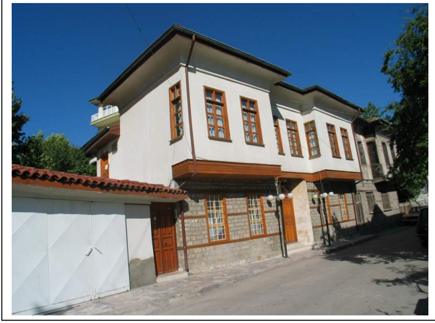
Foto-11. Isparta Davras mahallesinde restore edilmiş eski bir Isparta evi.

Korunması devlete ait kurumlarca yapılan ve işlevsel özelliklerini sürdüren resmi binalar ile cami, tekke, türbe, bedesten gibi yapılarda koruma işlemi daha sağlıklı sürdürülmektedir. Bu yapılarda daha dayanıklı bir malzeme olan taşın kullanılmış olmasının önemli payı olduğu açıktır.