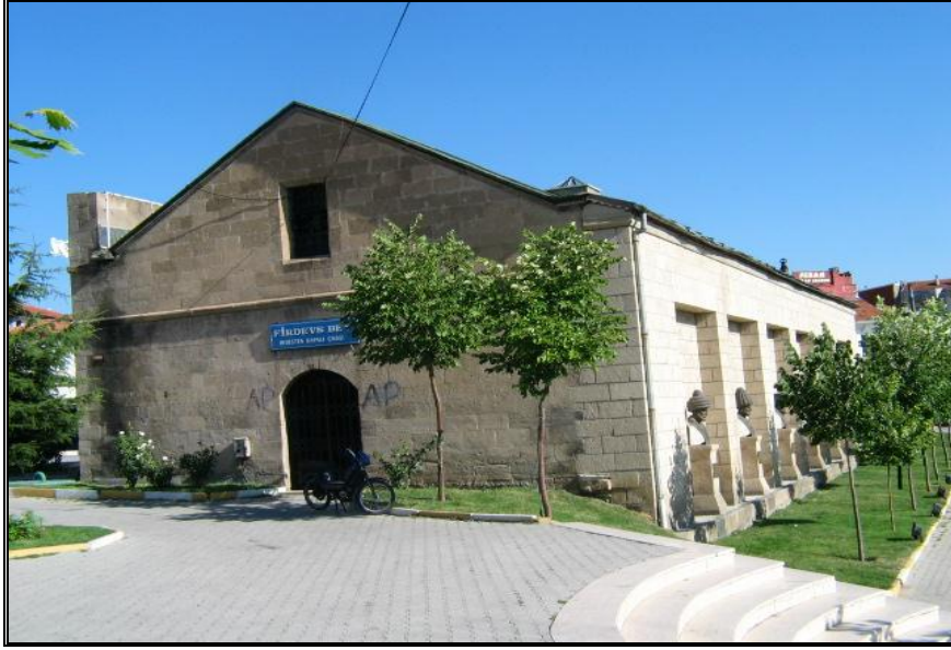
Foto-5. Şehrin merkezinde Osmanlı döneminden kalma bedesten (Firdevs Han).

Türk kentlerinin en önemli öğelerinden biri olan kapalı çarşıya güzel bir örnek teşkil etmekte ve kentin imajında önemli bir yer tutmaktadır.