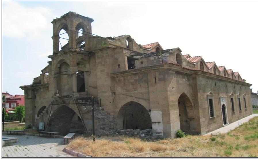
Foto-4. Aya Yorgi Kilisesinin batıdan görünüşü (Doğancı Mahallesi).

Isparta'nın eski mahallelerinden birini temsil eden, bugünkü devlet hastanesinin kuzeyinde kalan, Doğancı mahallesindeki bu kilise, 1857-1860 yıllarında yapılmıştır (Foto-4). Harap görünümde olan kilisenin çatısının bir bölümü restore edilmiştir.