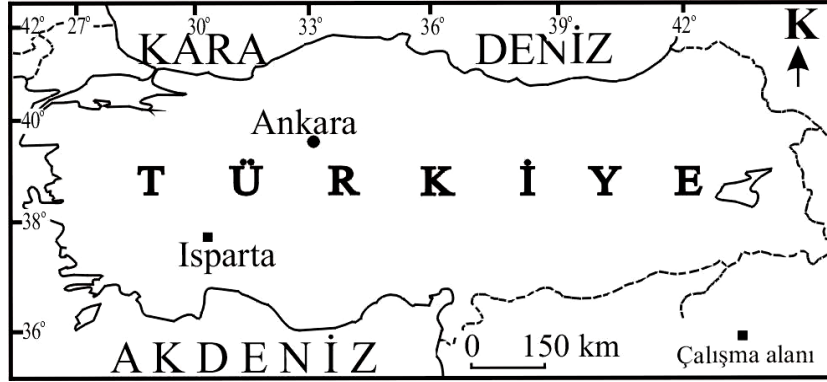
Şekil-1. Yer bulduru haritası.

Isparta, güney batı Anadolu'da yer alan, tarihi eski olmasına rağmen son yarım yüzyılda hızla gelişen bir Anadolu kentidir (Şekil-1). 1950'li yıllarda nüfusu 20 000 civarında olan Isparta günümüzde 150 000 nüfuslu çağdaş bir kent görünümünü kazanmıştır. Bu gelişim sırasında tarihi değeri olan eski Isparta evlerinin ancak bir bölümü korunabilmiştir. Bu arada cami, kilise, okullar ve diğer tarihi binaların bir kısmı, bakımdan geçirilerek günümüzde de kullanılmaktadır.