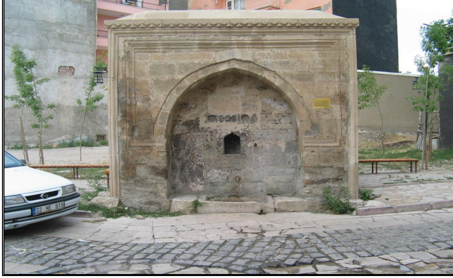
Foto-8. İmam Hasan Sokak'daki korumaya alınmış olan Hamidiye çeşmesi.