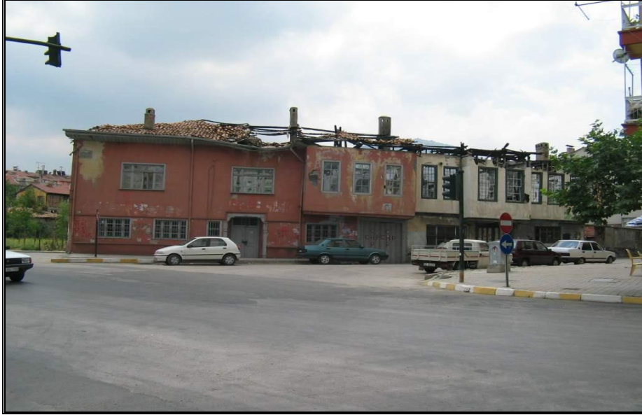
Foto-12. Koruma altına alınmış eski Isparta evleri zaman zaman sahipleri tarafından yakılarak, yıkılarak tescilden düşürülmeye çalışılmaktadır (Aksu Caddesi)

(CaSO 4 . 2H 2 O) mineralleri yığılması şeklinde dikkati çekmektedir. Bu oluşum kirli havadaki SO 2 ile yapıtaşının etkileşiminin bir sonucudur. Bu tür oluşumlara eski tarihi binaların duvarlarında kullanılan kaynaklanmış tüflerde (köfke) sıkça rastlanmaktadır. Yine çok eski binalarda kullanılan traki-andezitlerde görülen oyuklar buradaki mafik bileşimli anklavların ayrışma ürünü olarak ortaya çıkmıştır.