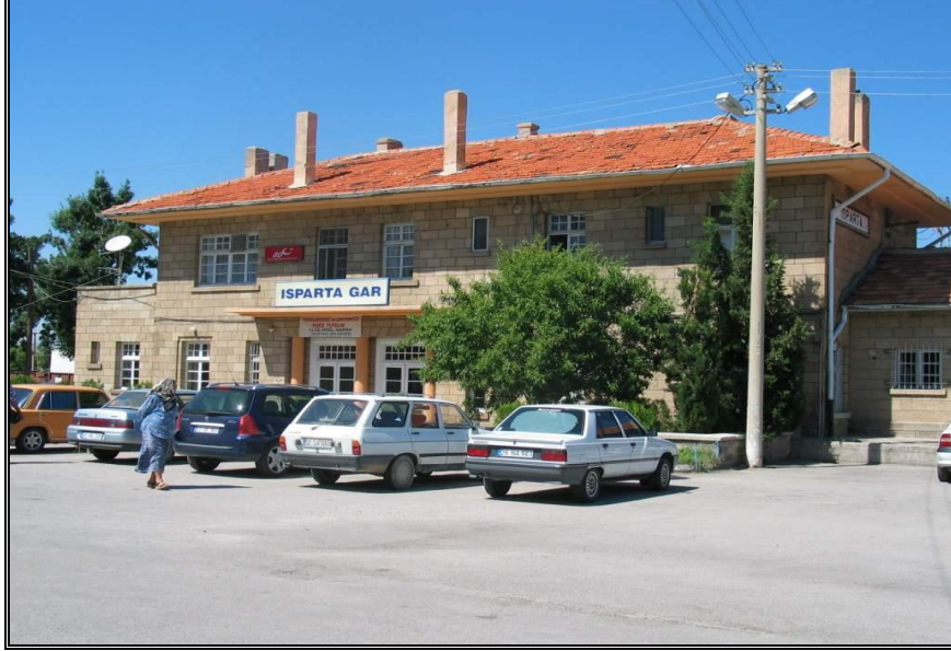
Foto-7. Cumhuriyet dönemine ait önemli yapılardan Isparta Gar Binası.