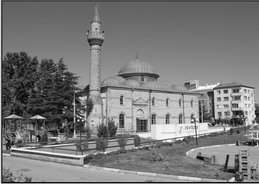
Foto-3. Osmanlı döneminde yapılmış olan Ulu Caminin batıdan görünüşü.

Isparta'da ki camiler içerisinde en eski ve tarihi değeri olan cami Ulu Cami veya diğer adıyla Kutlubey camiîdir. Caminin 1417 yılında Osmanlı komutanlarından Kutlubey tarafından yaptırılmış olduğu bilinmektedir (Foto-3). 1914 depreminde caminin tamamen yıkılması üzerine, 1922 yılında bugünkü cami yapılmıştır.