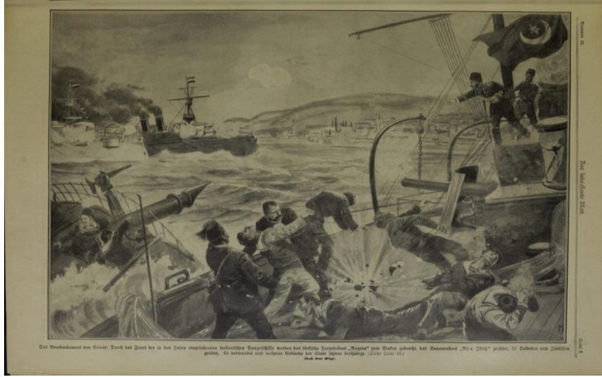
Çizim 1: İtalyan Donanmasının Beyrut Limanını Bombalaması 10

bir görünüm çizerek konumu itibariyle Doğu Akdeniz'in en önemli limanlarından birisi haline gelen Beyrut, doğu ve batı Beyrut tepelerinin oluşturduğu bir yarımadaanın üzerinde yer almakla birlikte on sekiz kilometre karelik bir alana sahip olup Lübnan ve Antilübnan dağları ile çevrilmekte ve Nehr-i Beyrut ile Nehr-i Kelb isimli iki adet nehir de kenti sulamaktadır. 8 Osmanlı Devleti tarafından oldukça önem verilen bir liman olan Beyrut, Trablusgarp Savaşı'nda İtalyan donanması tarafından bombalanmış olsa da stratejik önemini kaybetmemiş ve Balkan Savaşı'nda Hamidiye kruvazörünün Doğu Akdeniz'de Yunan donanmasına karşı faaliyetlerinde Osmanlı donanması tarafından önemli bir üs olarak kullanılmıştır. 9